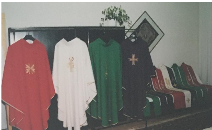
Obrázek 7: Ukázka paramentní výroby