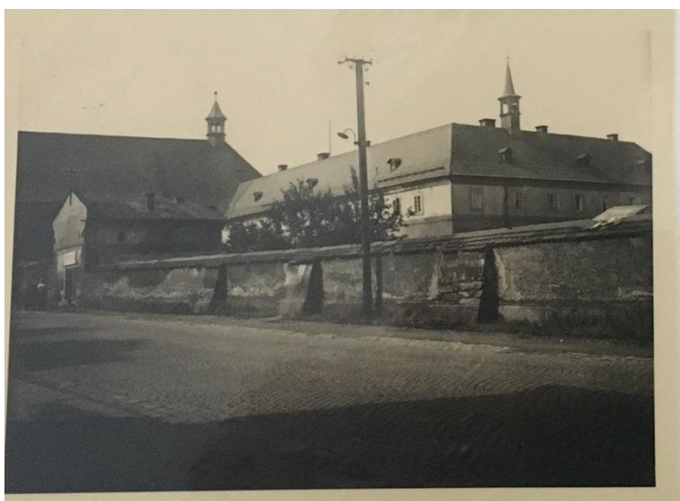
Obrázek 4: Františkánský klášter v Hostinném nad Labem