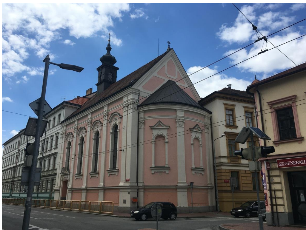
Obrázek 2: Kostel Božského srdce Páně