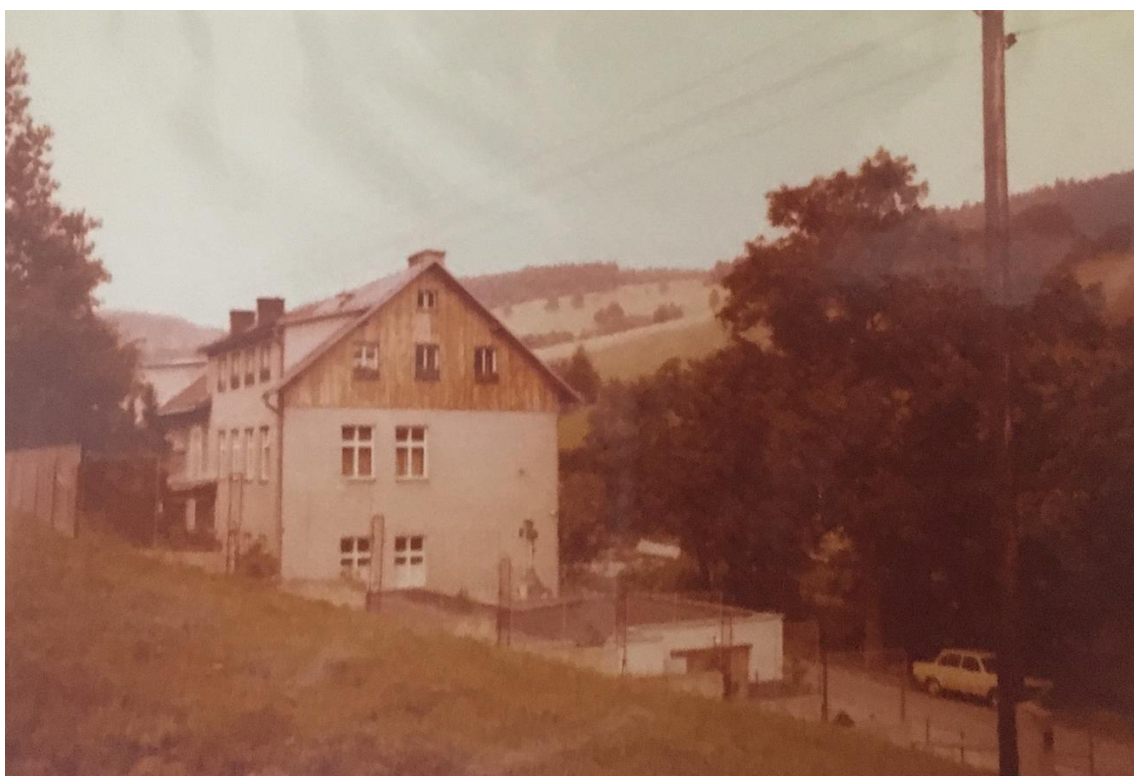
Obrázek 3: Domov v Dolních Alběřicích