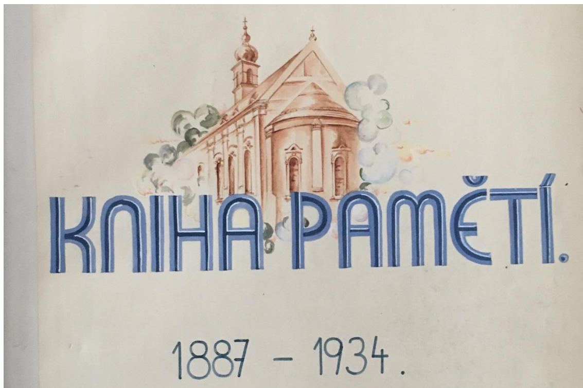
Obrázek 9: Ilustrace kostela Božského Srdce Páně v Pamětní knize 1887–1934