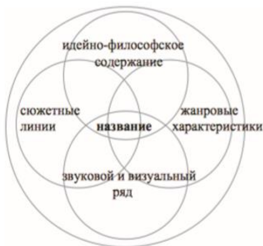
Рисунок 1 Название художественного фильма

Учитывая специфическое взаимоотношение визуального и текстового плана в художественных фильмах исследователи выделили новый соответствующий тип – «фильмонимы». Однако на данный момент этот термин не пользуется широкой популярностью, как у российских так и у чешских лингвистов. Названия фильмов остаются недостаточно изученными и по-прежнему относятся к категории текстовых заглавий 14 .