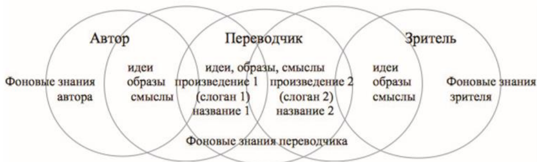
Рисунок 3 Интерпретация авторского замысла

Название фильма равно единице смысла, а значит равно единице перевода.