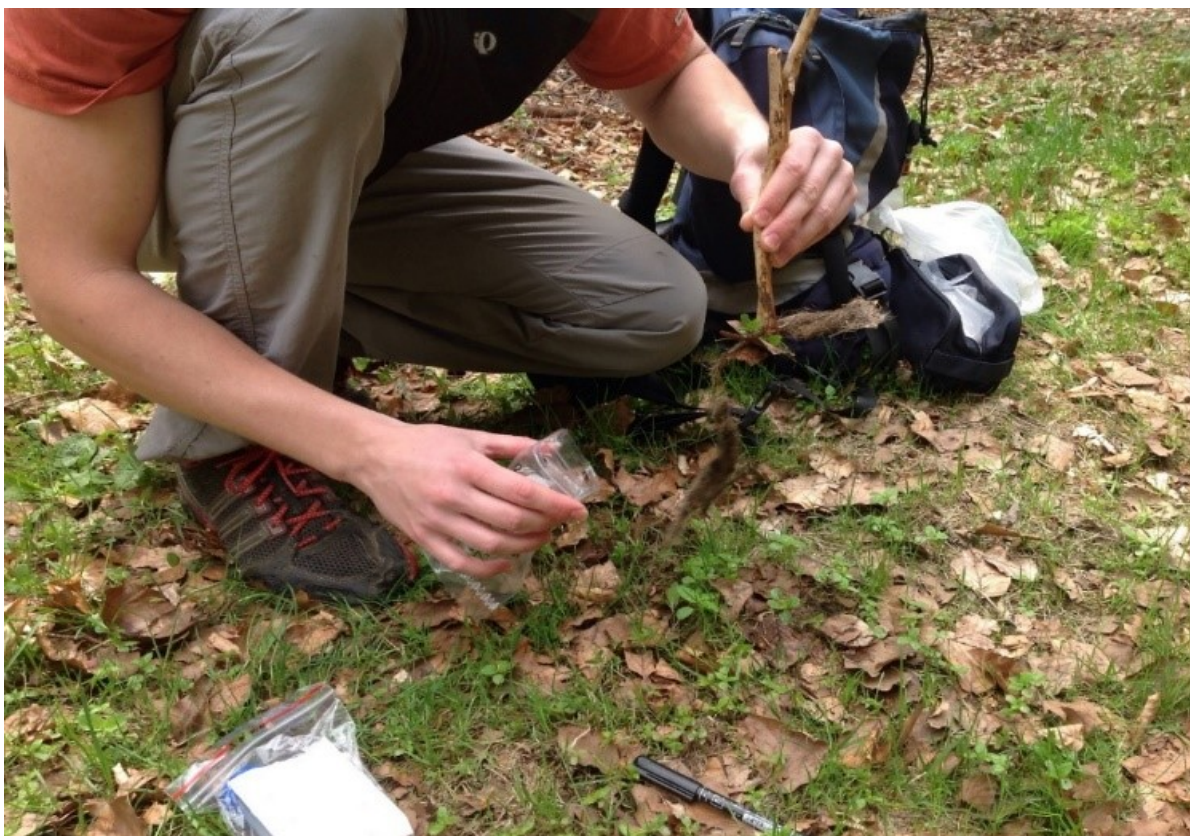
Foto: Lukáš Senft, 2019. Nabírání trusu pro potravinovou analýzu, Vraní hory.

Každý rozpadlý chuchvalec v sobě nese příběh. Skrze trusové zbytky je možné spekulovat a fabulovat (ve smyslu vyprávění příběhů a „spekulativní fabulace“; Haraway, 2016, 10) o tom, kdy tudy prošla smečka, jaká zvířata lovila, jaký prostor proměnila ve své teritorium, čím se živí, kudy vedou noční trasy. Jednotlivá vlákna trusu mohou být přeložena do narativních „vláken“ a příběhových linií. O vlčích a jejich životě je možné myslet skrze obyčejné předměty – a nejedná se pouze o trus.