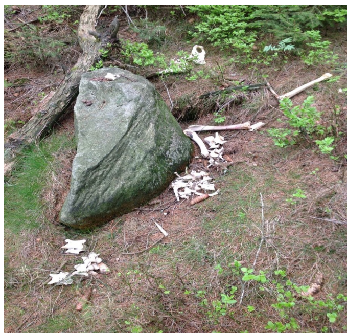
Zbytky lani kostry, Vraní hory.

Podobně by bylo možné uvažovat o koexistenci farmářů a ovcí, pastvin a environmentálních podmínek – vytváří sympoietický systém, v němž je „společně tvořeno“ nejenom mléko či vlna, ale výsledkem sympoietické práce je také například rození jehňat. A jak už bylo zmíněno, není možné zcela přesně určit, kdo z aktérů zaujímá vůdčí postavení: chod farmy se často blíží spíše horizontální decentralizaci, která je vlastní systémům sympoietickým.