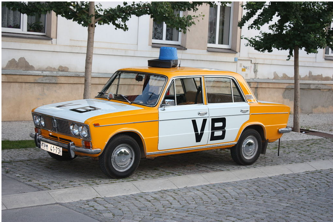
Obrázek 2 – Lada 2103 Veřejná bezpečnost

K velkým změnám došlo v roce 1968-1969. Na území republiky působilo federální ministerstvo vnitra a ministerstva vnitra obou republik. Rozhodnutím vlády byly zřízeny pohotovostní útvary VB. Vše bylo postaveno na vedoucí úloze KSČ, jednotě SNB a ochrany majetku v socialistickém vlastnictví. (Vilášek, Fiala, Vondrášek, 2014)