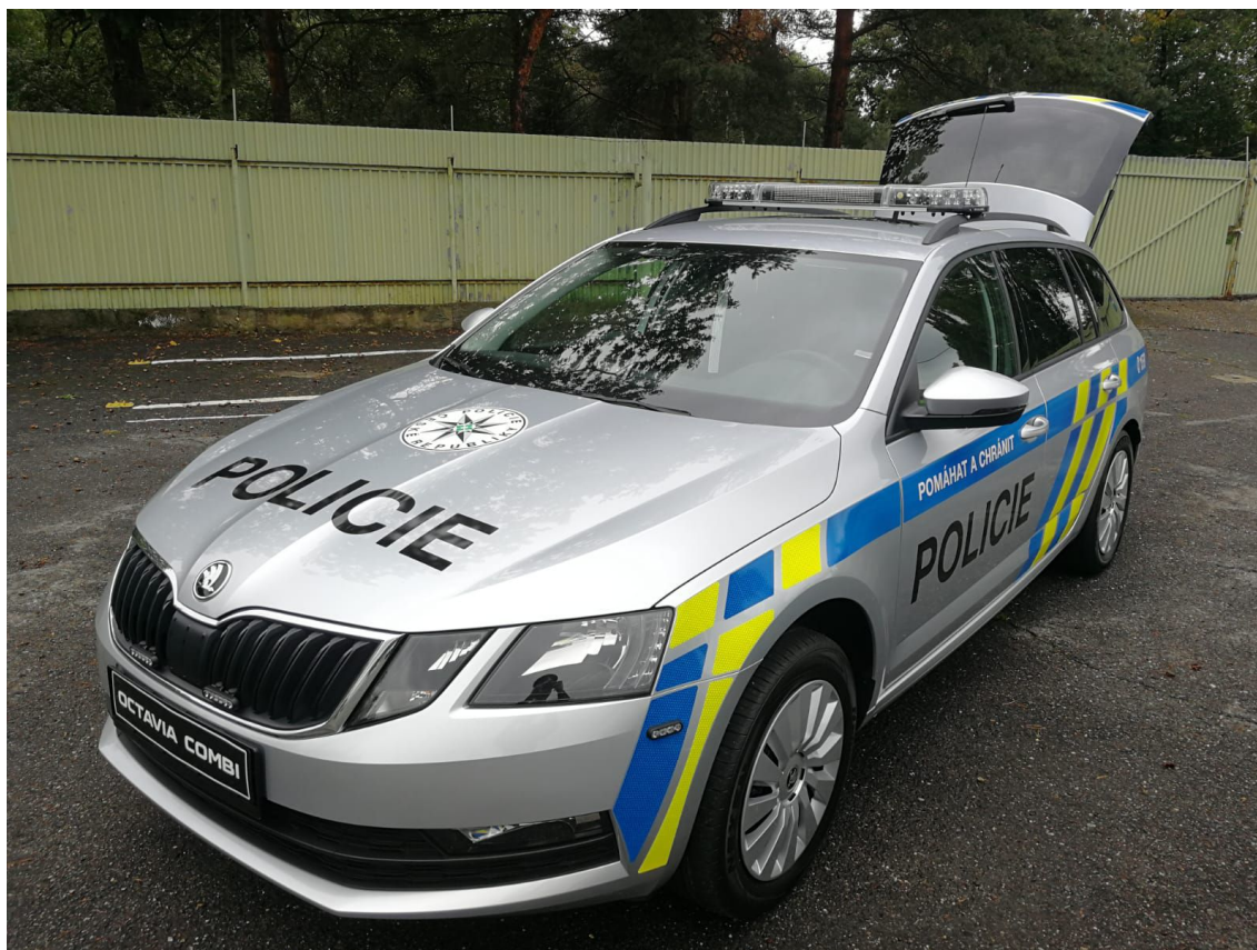
Obrázek 4 – Vozidlo Policie ČR