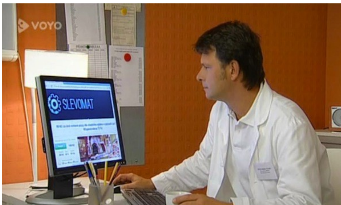
Obrázek č. 6 – Jedná se o skrytou reklamu?