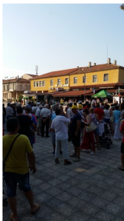
Obrázek 7 Hlavní náměstí v Bălgarevu. 2017.