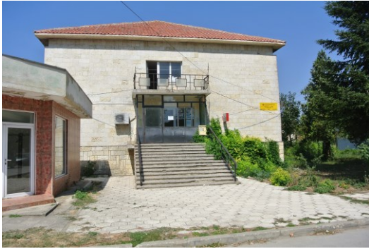
Obrázek 4 Radnice v Bălgarevu. 2017.