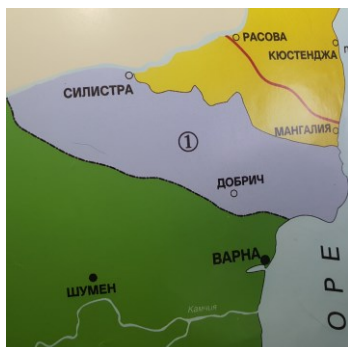
Obrázek 1 Oblast Jižní Dobrudži (šedou barvou)