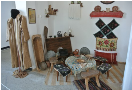
Obrázek 5 Gagauzské centrum v Bălgarevu. 2017.