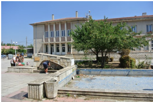
Obrázek 6 Hlavní náměstí v Bălgarevu. 2017.