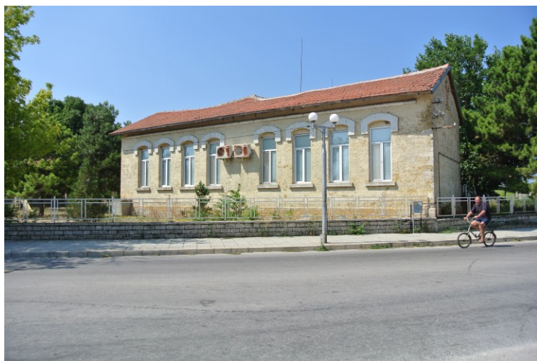
Obrázek 3 Opravená škola v Bălgarevu. 2017.