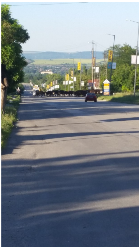
Образек 9 Пријезд до Бãлгарева. 2017.