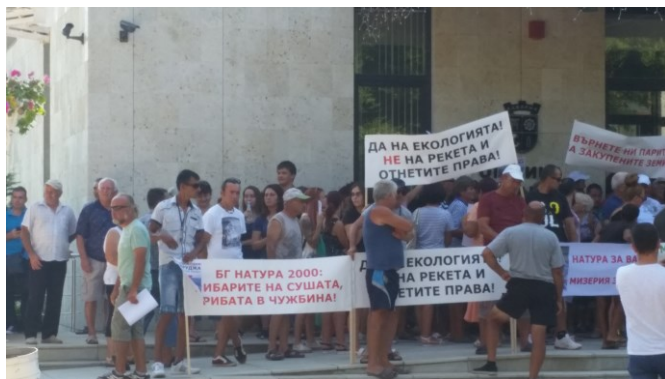
Образек 8 Демонстраце в Каварнë. 2017. Здрoј: архив аутора.