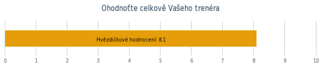
Graf 2 Celkové hodnocení trenéra

U poslední otázky používali respondenti opět hodnocení jako u výše zmíněné otázky, na základě tohoto hodnocení měli respondenti celkově ohodnotit svého trenéra (1 hvězdička = nejhorší hodnocení, 10 hvězdiček = nejlepší hodnocení). Respondenti hodnotili jejich trenéry velmi pozitivně, celkové hodnocení skončilo na škále na čísle 8,1. Nikdo z respondentů nepřihodil svému trenérovi 1 či pouze 2 body. Nejčastěji udělovali respondenti 9 bodů, celkově 25 % všech respondentů.