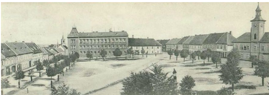
Obr. č. 11. Fotografie náměstí z roku 1910. 10

O reprezentativnosti náměstí píše taktéž Vacek (2013) v souvislosti s výsadbou lip (viz obr. č. 11., 12.), díky které prošlo náměstí další výraznou vzhledovou proměnou. Lípy byly vysázeny po celém obvodu prostoru v roce 1889 místním Strašeckým Okrašlovacím spolkem (Černý 2013). Dle Vacka (2013) mohl výběr druhu zeleně souviset s érou národního obrození. Málo vzhledná plocha náměstí tak byla okrášlena lipovým stromořadím a lavičkami, které zdobí náměstí doposud. Výsadba lip jako by zapříčinila potlačení primární funkce náměstí jako tržiště a aleje stromů mohly vzbuzovat dojem pro promenády a chvíle oddechu a relaxace ve stínu.