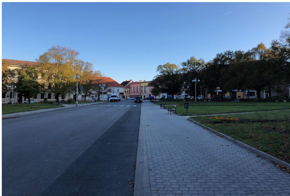
Obr. č. 3. Úhlopříčná silnice, foceno ze severozápadního rohu.