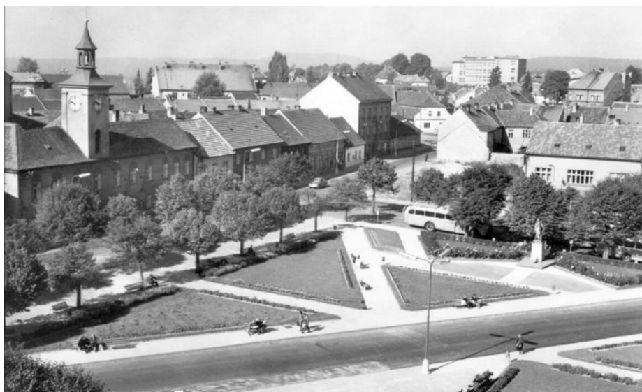
Obr. č. 13. Fotografie náměstí 60. léta 20. stol.

Další změny náměstí zažilo v šedesátých letech, kdy došlo k odstranění sochy sv. Jana Nepomuckého. Světcova socha byla nakonec nahrazena roku 1957 sochou Rudoarmějce, v nadživotní velikosti, která byla odhalena při čtyřicátém výročí VŘSR (Černý 2013, str. 147; viz obr. č. 13). Nové soše se následně začala kompozičně podřizovat nová koncepce náměstí, která byla zpracována počátkem šedesátých let. Podle této studie se tak volně prostranství náměstí rozdělilo dlážděnými chodníky, mezi kterými vznikly travnaté plochy se záhony květin a listnatých keřů, do prostoru se přidaly zídky a vodní prvek s fontánkou (Kuča 2001).