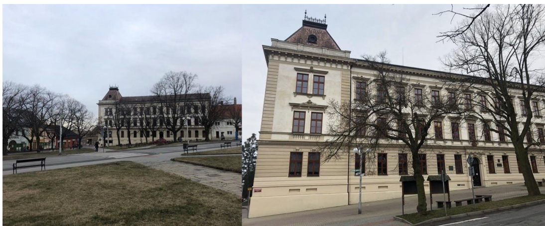
Obr. č. 6. Budova gymnázia díky své materiální stránce působí v kontextu okolních domů na náměstí mimořádně. Levý roh budovy zároveň představuje dolní okraj náměstí.

(...) Mezitím, co se procházím u gymplu (viz obr. č. 6), přemýšlím, jak ho ve své práci popíšu. Takhle na první dobrou vím, že napíšu, že jde o novorenesanční dvoukřídlovou budovu. Její východní křídlo, které stojí do prostoru náměstí, je dvoupatrové. Uprostřed tohoto křídla jsou pod kamenným portálem dřevěné a částečně prosklené vstupní dveře. Vzpomínám, jak jsem jako žákyně na dveře lepila informační plakáty. I dnes jsou jimi polepené. Barva nové fasády je nenápadná, kolem hnědých oken působí až elegantně, jestli se to tak o fasádách dá říct. Ještě se dívám nahoru nad dveře budovy. Je nad nimi umístěná busta Jana Amose Komenského. Před odchodem od budovy ještě rychle nakouknu do okna vpravo vedle dveří, kde bývala učebna hudební výchovy. Stále tam je. (září, 2019)