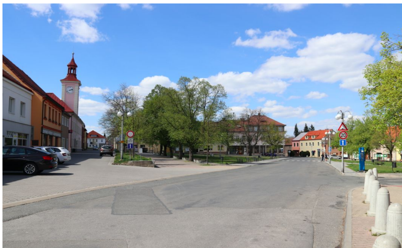
Obr. č. 2. Úhlopříčná silnice, foceno z jihovýchodního rohu.

Cesty dle Lynche (2004) představují dráhy, po kterých se obyvatelé měst pohybují a jsou hlavním prostorotvorným prvkem. Mohou to být ulice, silnice či procházkové trasy. Vizuální dojem cest může zvýšit výsledný vzhled prostoru: zajímavá navazující cesta nebo například použití zeleně apod. Sledované Komenského náměstí je tvořeno hned několika cestami/osami. Zmíněné osy rozdělím na dvě kategorie, a to osy pro automobily – tedy silnice, a osy pro pěší – tedy pěší zóny a chodníky. Na náměstí lze automobilem přijet třemi silnicemi, které vedou z jeho třech rohů, z jihozápadního, jihovýchodního a jihozápadního. Všechny silnice jsou na náměstí jednosměrné a v rohu severovýchodním se spojují v jednu a ústí ven z náměstí. Hlavní úhlopříčná silnice, představující jeden z charakteristických rysů náměstí, svou polohou jeho prostor rozděluje (viz obr. č. 2, 3.).