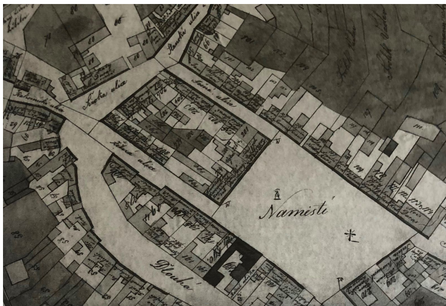
Obr. č. 9. Výřez centra městečka z roku 1850.

Prvním zdrojem toho, jak mohla různá náměstí po celou historii měst vypadat, jsou mapy (Černý 2013). Naše sledované Komenského náměstí je znázorněno na první podrobné mapě, která vznikla podle stabilního katastru kolem roku 1850 (viz obr. č. 9). Podle zmíněného výřezu z plánu města si náměstí po celou dobu zachovalo původní skoro čtvercový půdorys, a to i s jednotně vyměřenými parcelami domků (Černý 2013; Vacek 2013).