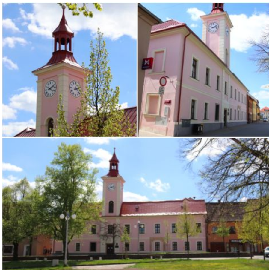
Obr. č. 7. Budova bývalé radnice, dnešní Základní umělecké školy.

„Myslím si, že tady z toho hlediska by šlo s tím náměstím ještě něco udělat, asi jako ho víc opečovávat, když to má být jakože dominanta města, jako je dominanta samotná ta liduška prostě nebo gympl víc jak. To se třeba taky upravily fasády, vyměnil se zvon, okna gymplu, prostě aby to vypadalo líp. Což je dobře, tyhle důležité budovy maj vypadat pěkně. Navíc je škoda, když se o historický budovy ty města nestaraj. To naše snad jo (...) Je to bejvalá radnice, stojí tam strašně dlouho, ani nevím, která ta budova je důležitější. Ale to je asi jedno, obě jsou obrovský a takový symbolický a něco pro to město znamenaj, tak by se o ně starat prostě mělo.“ (z rozhovoru se Simonou, 18.2.2020)