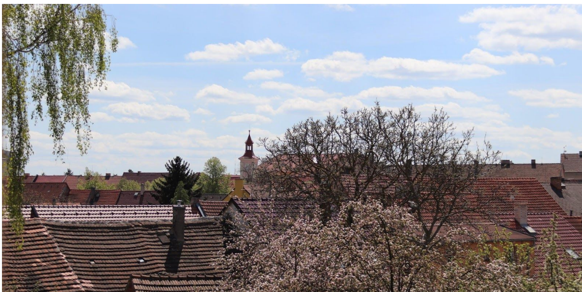
Obr. č. 5. Věž Základní umělecké školy. Skrze již rozkvetlé stromy nelze dobře vyfotit i budovu gymnázia, která by se nacházela na okraji levé části fotografie.

(...) Mezitím, co se procházím u gymplu (viz obr. č. 6), přemýšlím, jak ho ve své práci popíšu. Takhle na první dobrou vím, že napíšu, že jde o novorenesanční dvoukřídlovou budovu. Její východní křídlo, které stojí do prostoru náměstí, je dvoupatrové. Uprostřed tohoto křídla jsou pod kamenným portálem dřevěné a částečně prosklené vstupní dveře. Vzpomínám, jak jsem jako žákyně na dveře lepila informační plakáty. I dnes jsou jimi polepené. Barva nové fasády je nenápadná, kolem hnědých oken působí až elegantně, jestli se to tak o fasádách dá říct. Ještě se dívám nahoru nad dveře budovy. Je nad nimi umístěná busta Jana Amose Komenského. Před odchodem od budovy ještě rychle nakouknu do okna vpravo vedle dveří, kde bývala učebna hudební výchovy. Stále tam je. (září, 2019)