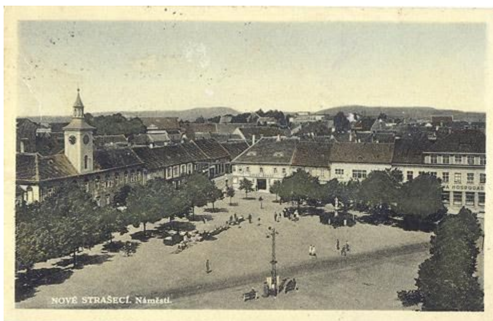
Obr. č. 12. Fotografie náměstí z roku 1939.