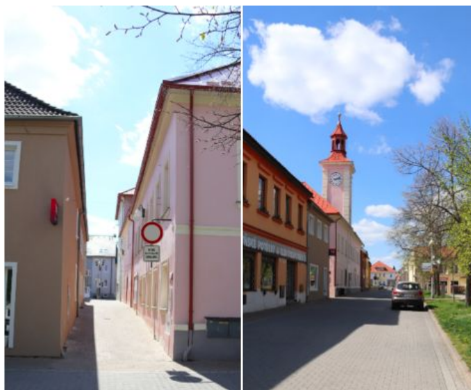
Obr. č. 8. Vlevo příchod z Úzké uličky; vpravo trasa k minimarketu.

Na základě tohoto úryvku z mých terénních poznámek udělám malou odbočku a nastíním, jakou roli zaujímá Úzká ulička jako Lynchův (2004) obrazotvorný prvek vůči prostoru náměstí, i když se na něm vlastně skoro už nenachází. Ulička, nikoliv ulice, v tom smyslu, že ji nikdo z mých informátorů a informátorek během rozhovorů nenazval jinak. Ulička dále také proto, že se nejedná o “plnohodnotnou” ulici ve smyslu s uprostřed umístěnou silnicí s postranními chodníky, ale o úzkou pěší uličku/zónu. Tato ulička zprostředkovává tak jakýsi průchod z nejméně frekventovanější komunikace města na klidné a tiché prostranství náměstí. Úzká ulička je tedy cestou, stejně jako ostatní rohové ulice, vedoucí do/z prostoru náměstí. Zároveň je však v Lynchově (2004) podání uzlem (viz obr. č. 8).