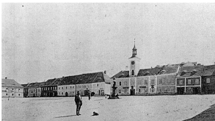
Obr. č. 10. Pravděpodobně první fotografie náměstí.

Nyní navážu na informátorku Simonu. Fotografie (viz obr. č. 10), o které se informátorka zmiňuje, pochází pravděpodobně z osmdesátých let 19. století a je to první fotografie, na které je Komenského náměstí zobrazeno (Černý 2013). Z fotografie lze vyčíst mírně klesající prostranství bez stromů, laviček či nějakých jiných prostorových prvků, kromě zmíněné vztyčené sochy a budovy bývalé radnice, tedy dnešní Základní umělecké školy.