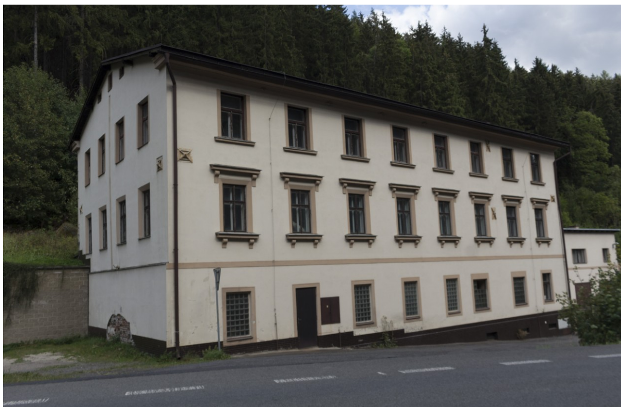
Bývalá brusírna skla na vodní pohon v Železném Brodě, tzv. tovární brusírna (č. p. 290).