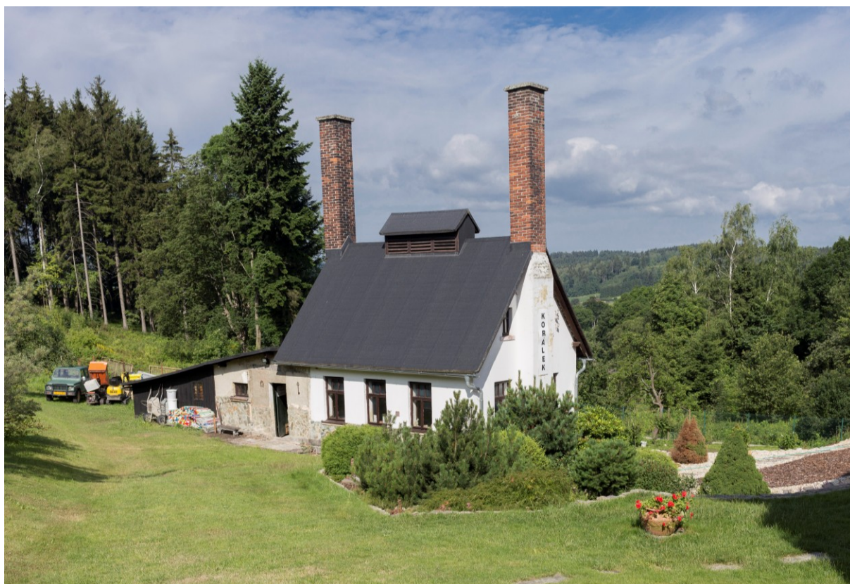
Mačkárna Korálek v Maršovicích, která byla již v provozu v roce 1904. Její provoz byl ukončen v roce 1975. Zajímavostí je, že se jedná o mačkárnu, která nebyla nikdy znárodněna.