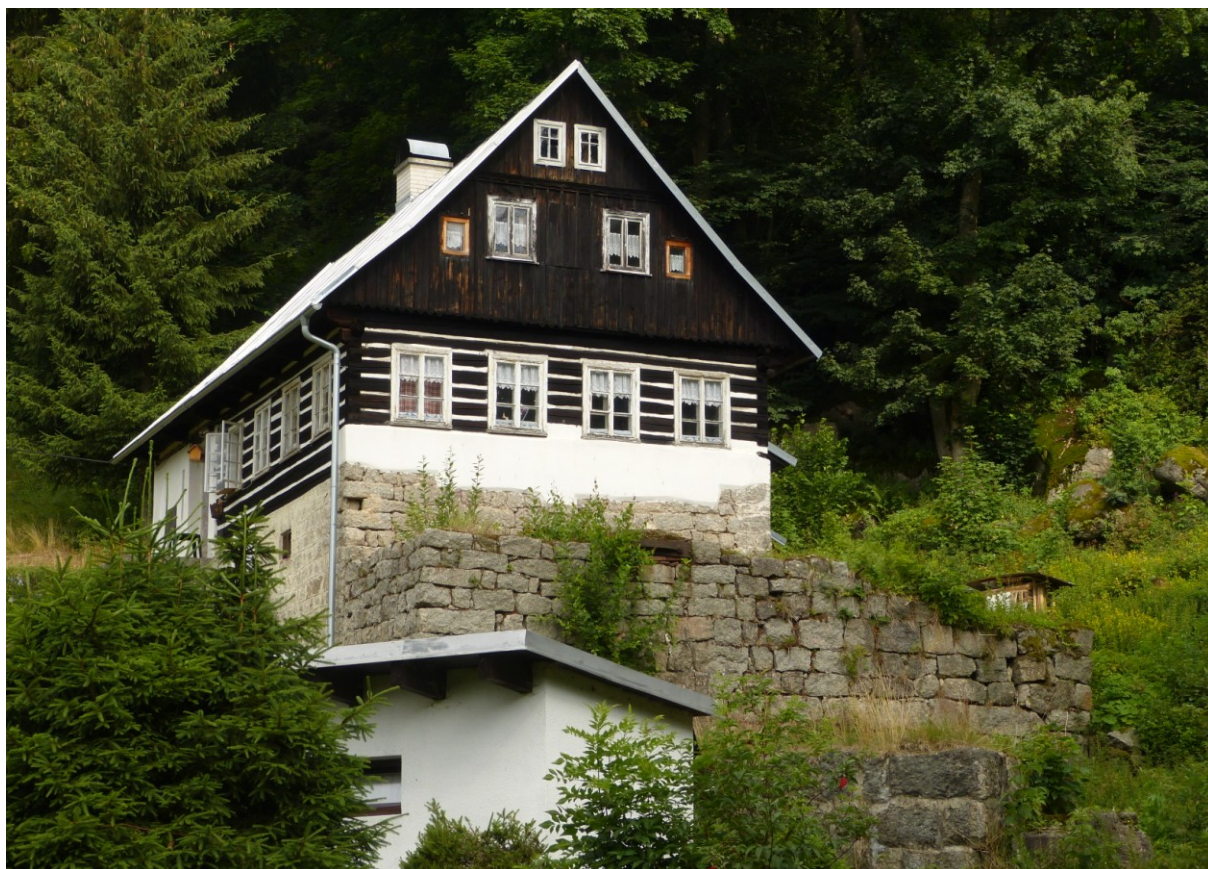
Bývalá brusírna skla na vodní pohon v Josefově Dole (ev. č. 887).