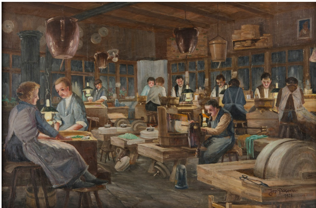
Interiér brusírny skla na vodní pohon v Lučanech nad Nisou, autor Josef Pikora, 1928. Sbírka Muzea skla a bižuterie v Jablonci nad Nisou.