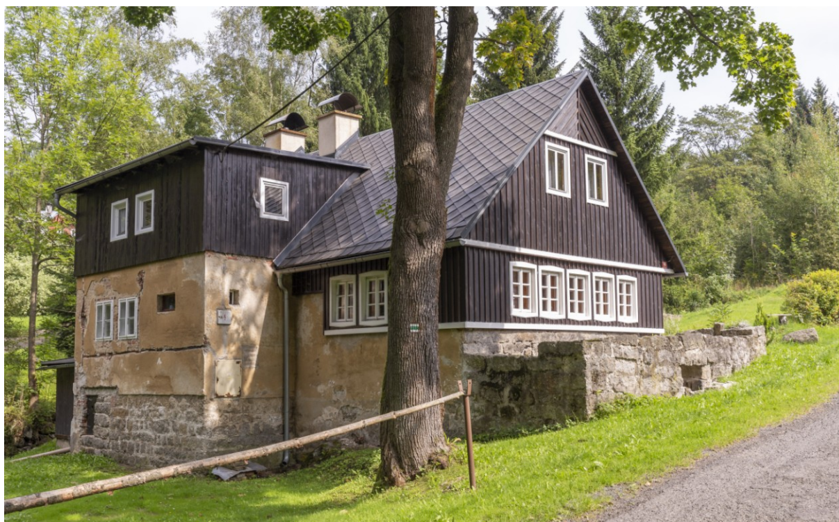
Pohled na bývalou brusírnu skla na vodní pohon v Janově nad Nisou na Velkém Semerinku (ev. č. 1187).