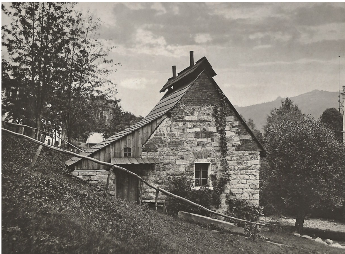
Stará mačkárna skla v Horním Tanvaldě.