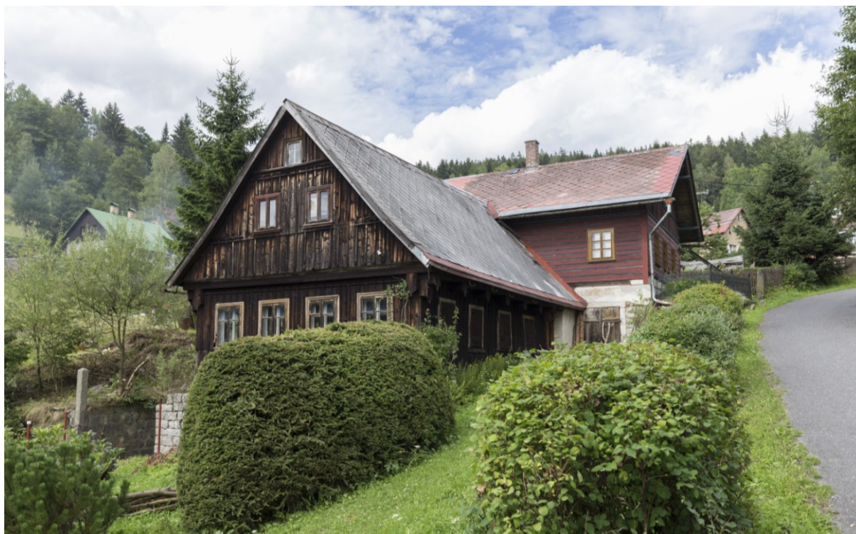
Bývalá brusírna skla na vodní pohon v Josefově Dole (ev. č. 992).