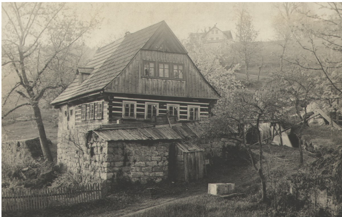
Bývalá brusírna skla na vodní pohon na Mariánské Hoře. Sbíрка Muzea skla a bižuterie v Jablonci nad Nisou.