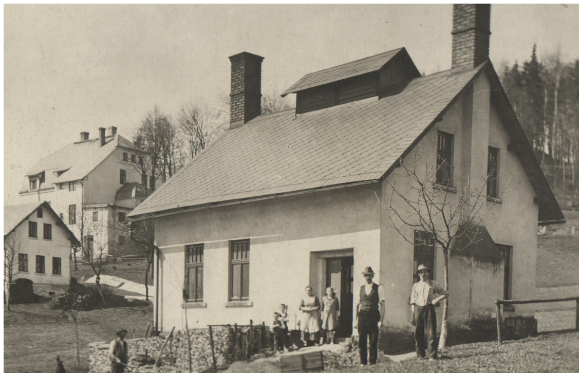
Mačkárna skla na Jablonecku, první třetina 20. století. Sbírká Muzea skla a bižuterie v Jablonci nad Nisou.