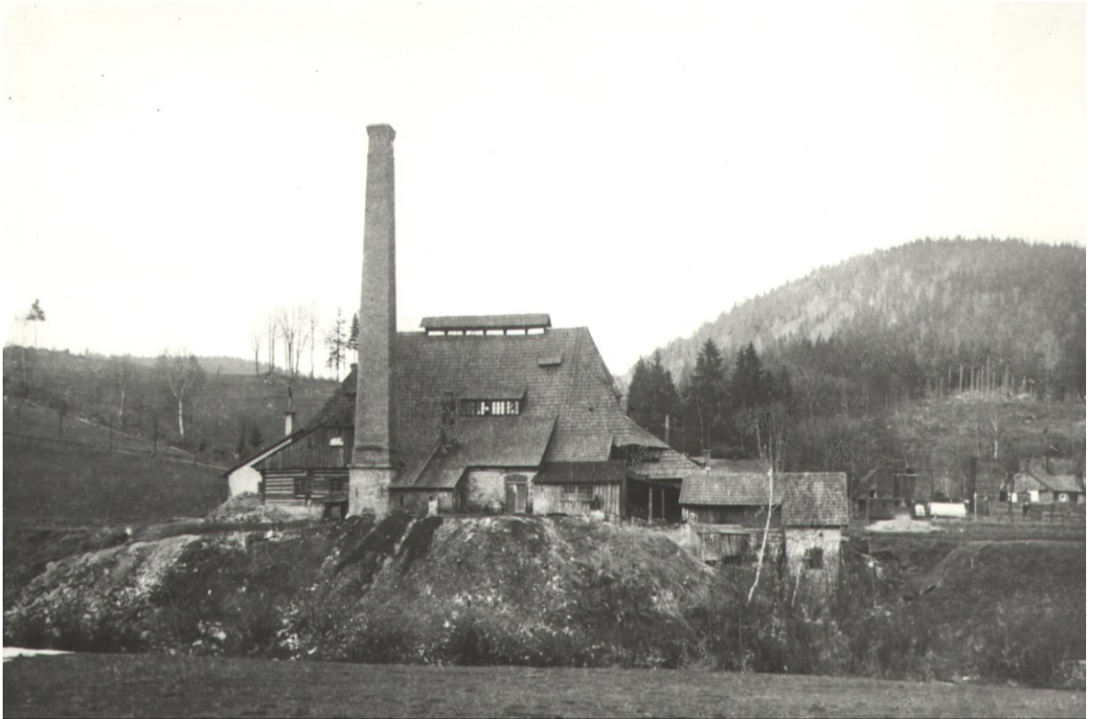
Antonínovská, tzv. Zenkerova sklárna v Josefově Dole (na Jablonecku) byla postavena koncem 17. století, zbořena byla v roce 1909. Fotografie pořízena před rokem 1909.