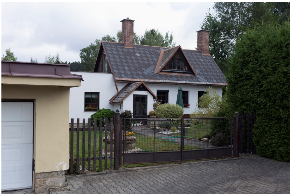
Bývalá mačkárna skla na Maršovicích (č. p. 142).