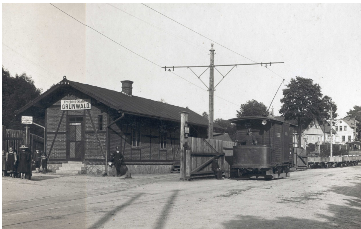
Nákladíště ve Mšeně (součást Jablonce nad Nisou) s motorovými vozy nákladní tramvajové dopravy.