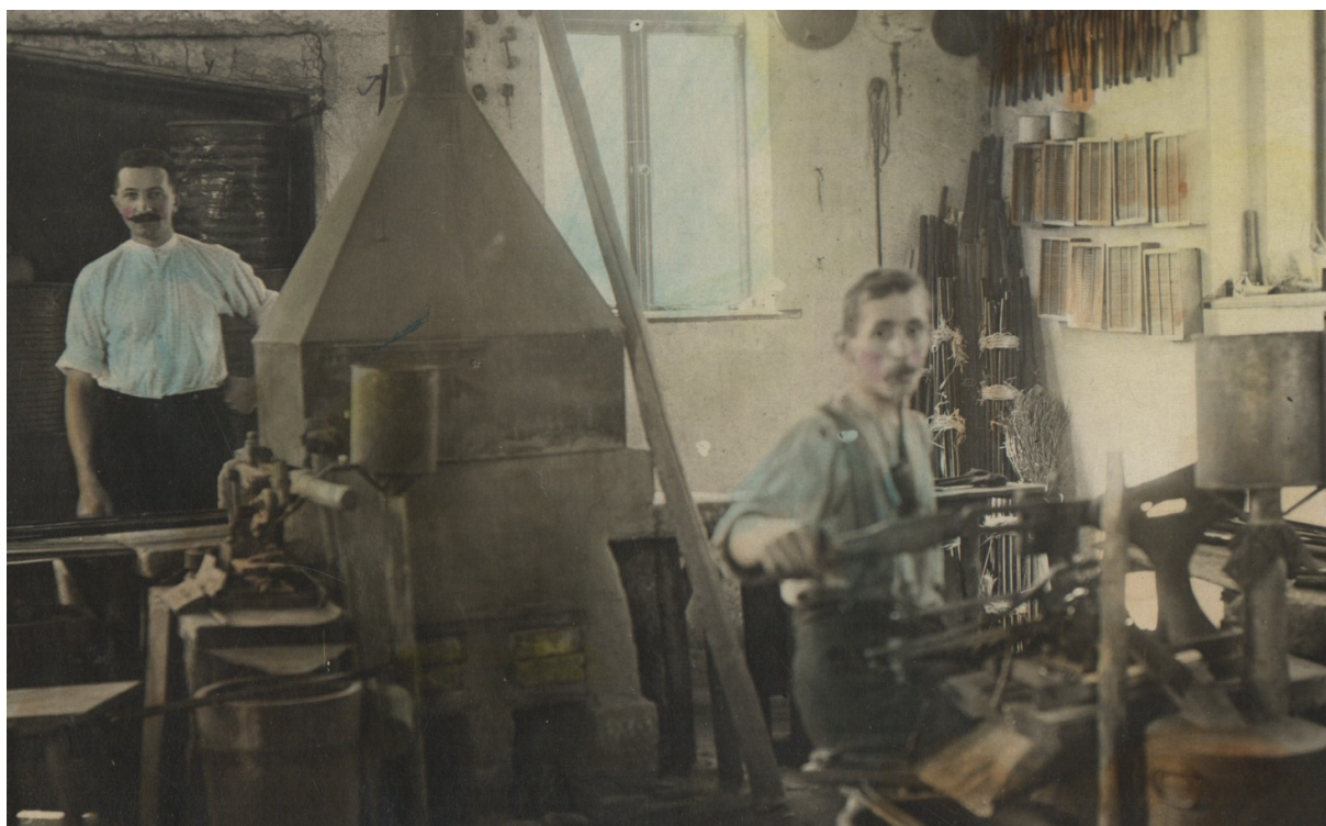
Interiér mačkárny skla s mačkáři na počátku 20. století. Sběrka Muzea skla a bižuterie v Jablonci nad Nisou.