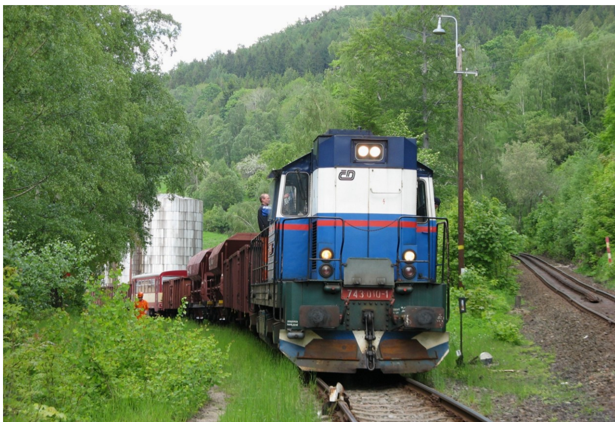
Druhá vlečka na „Zubače“ v Dolním Polubném, za Dolnopolubenským tunelem, odkud vlečka vede do Příchovické sklárny.