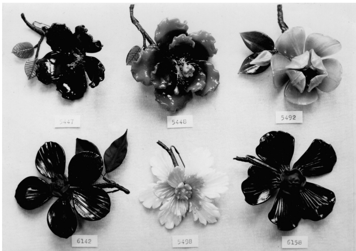
Fotografie částí výrobků skleněné bižuterie, které vyráběla firma Jaroslava Hlubůčka st. v Železném Brodě.