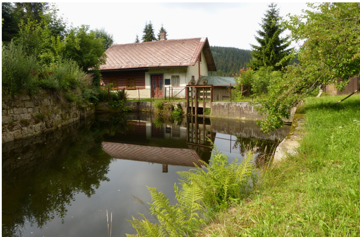
Vodní rezervoár (akumulační nádrž) před brusírnou skla na vodní pohon v Josefově Dole (ev. č. 922).