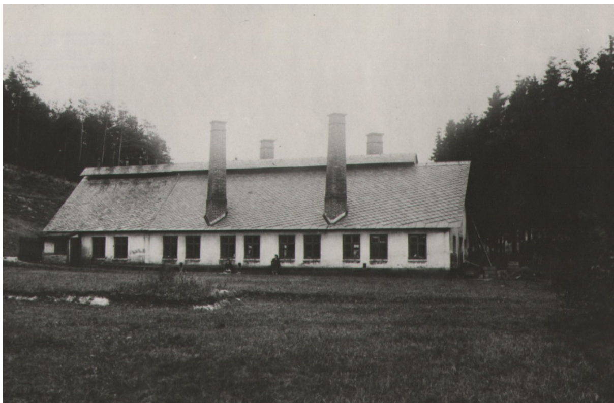
Fotografie bývalé tovární mačkárny skla na Dolní Černé Studnici z počátku 20. století.