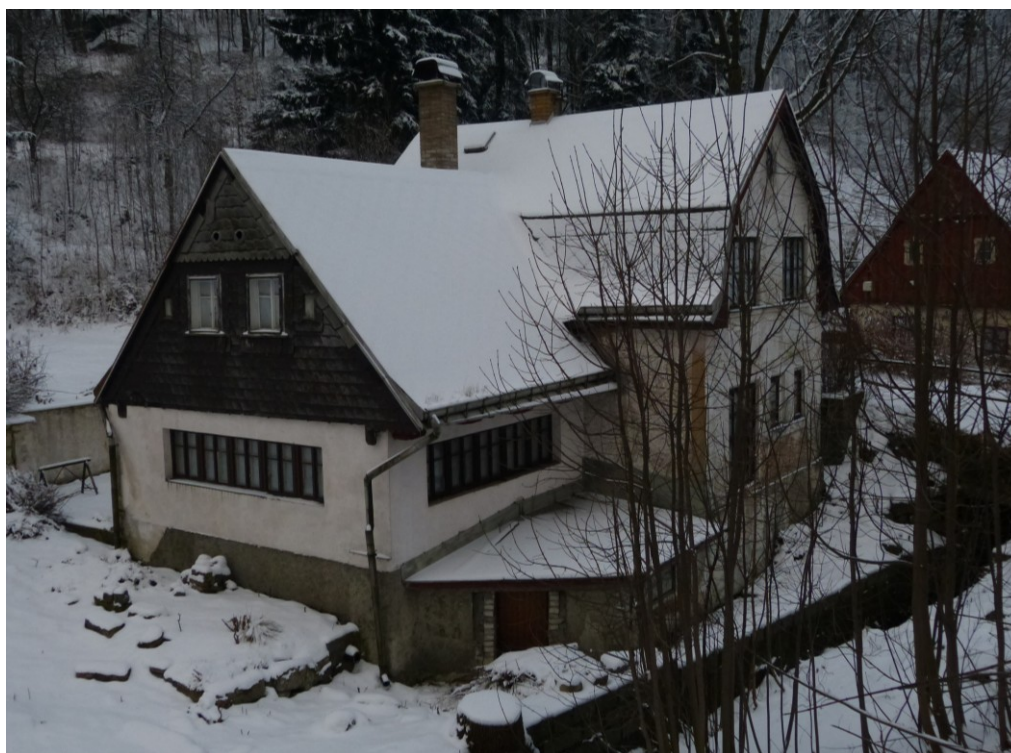
Bývalá brusírna skla na vodní pohon (č. p. 190) v Lučanech nad Nisou.