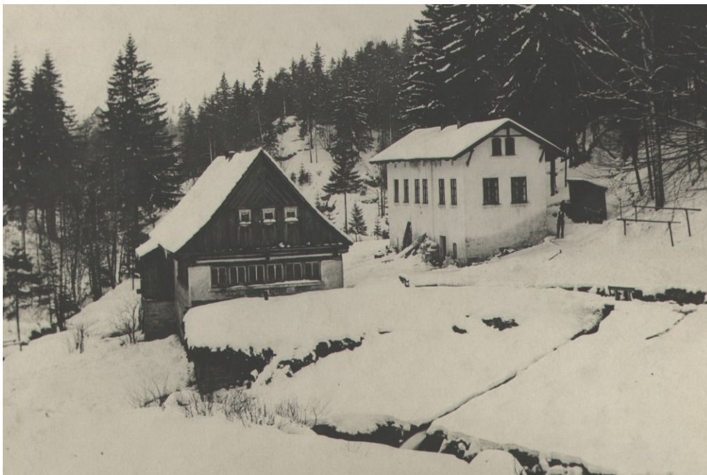
Bývalá brusírna skla na vodní pohon (č. p. 144) v Lučanech nad Nisou na počátku 20. století. Sbíрка Muzea skla a bižuterie v Jablonci nad Nisou.