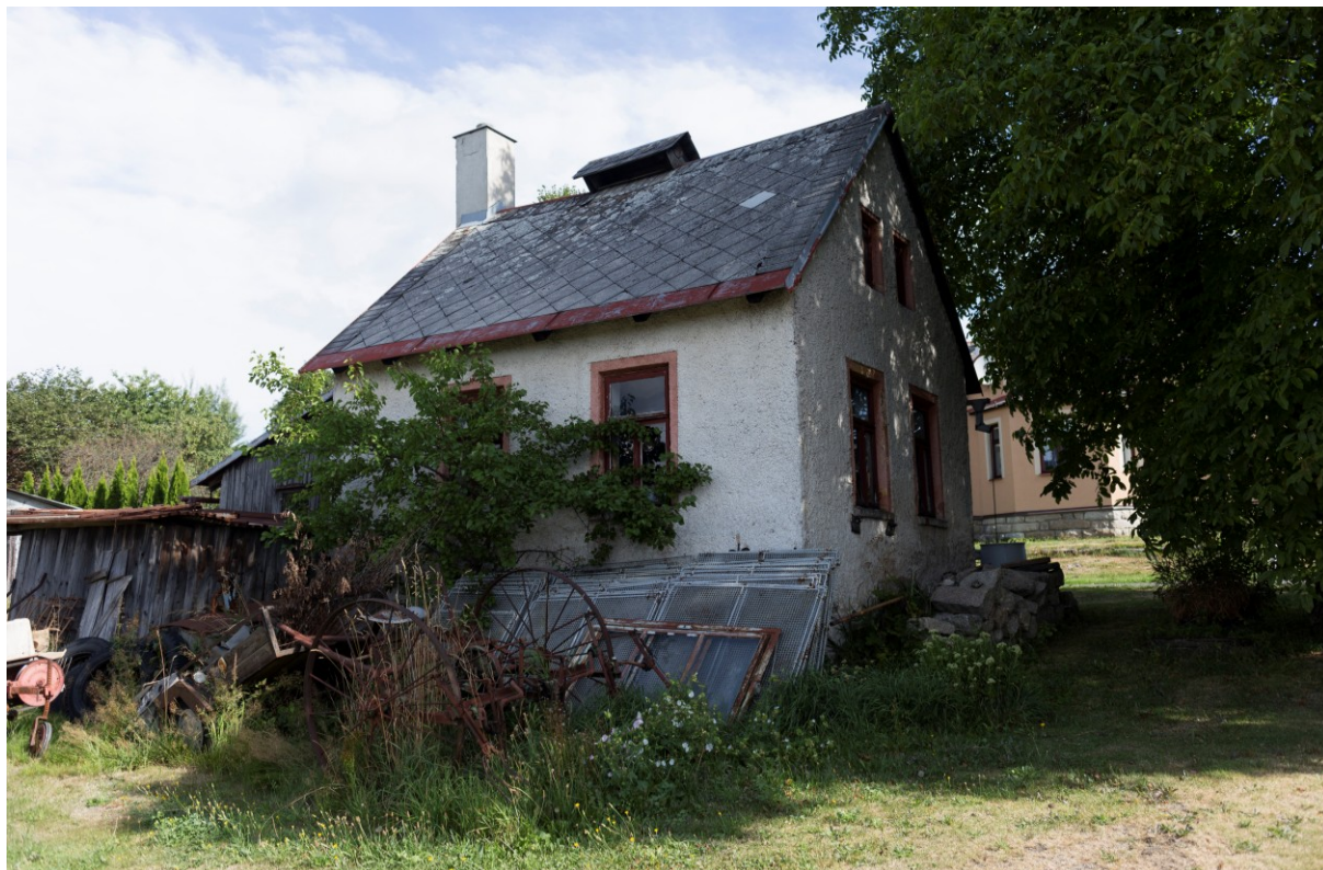
Bývalá mačkárna skla ve Skuhrově (č. p. 3).