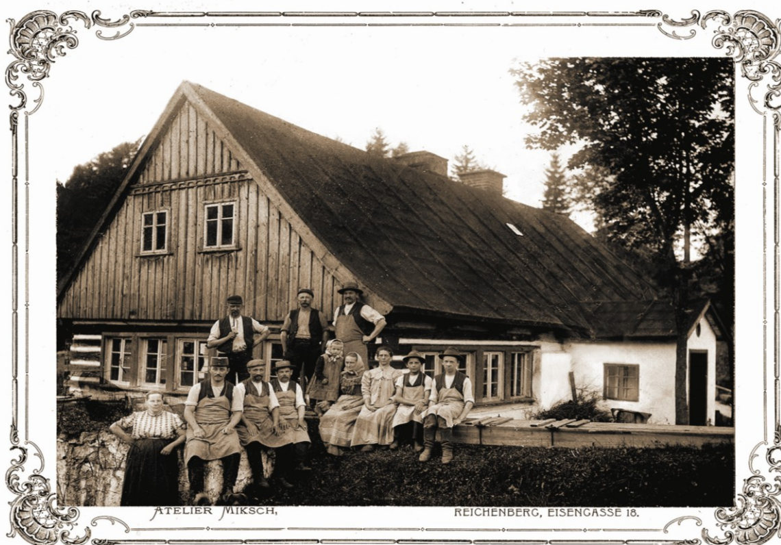
Bývalá brusírna skla na vodní pohon v Janově nad Nisou na Velkém Semerinku (ev. č. 1187). Fotografie pořízena na počátku 20. století.