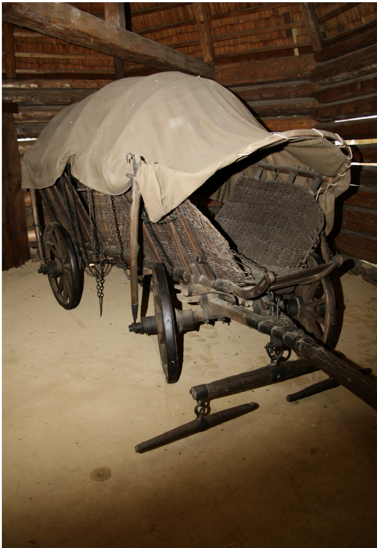
Formanský vůz z druhé poloviny 19. století ve sbírce Valašského muzea v přírodě v Rožnově pod Radhoštěm (VMP).