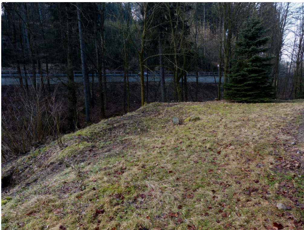
Fotografie místa, kde stávala brusírna skla na vodní pohon (č. p. 144) v Lučanech nad Nisou.