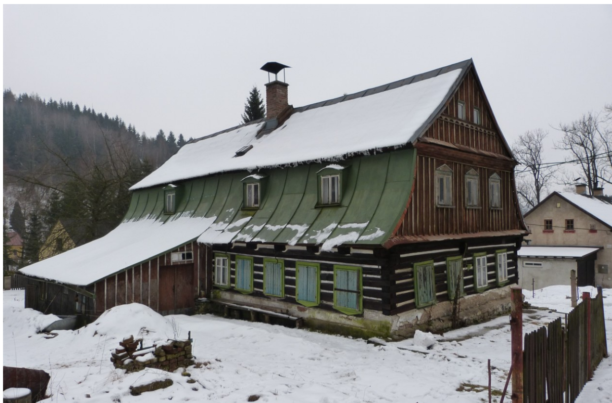
Bývalá brusírna skla na vodní pohon (č. p. 74) v Desné v Jizerských horách.