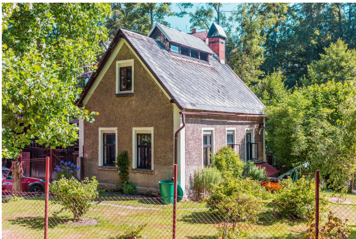
Mačkárna knoflíků (č. p. 527) Jaroslava Lipského.