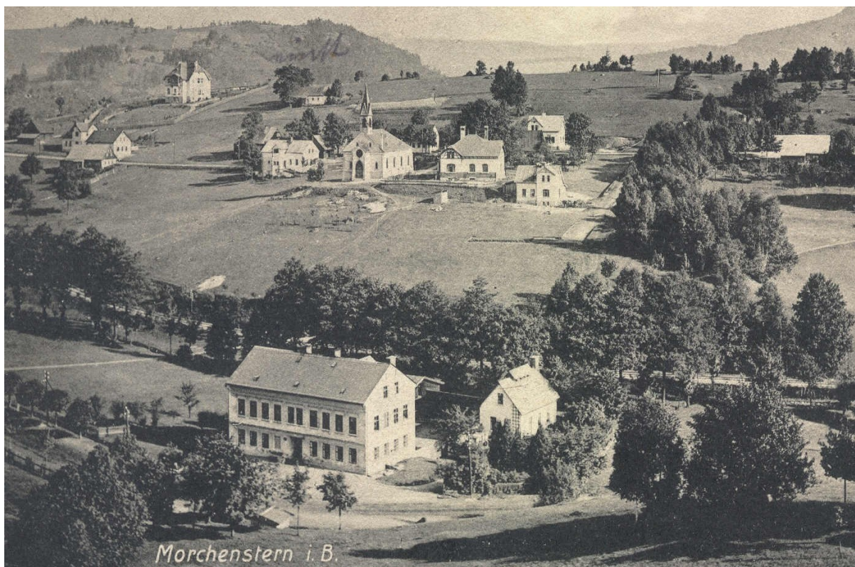
Pohlednice Smržovky, přibližně kolem roku 1910, se záběrem na Staffenovu brusírnu a mačkárnu (č. p. 527).