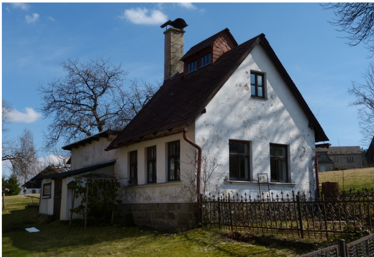
Bývalá mačkárna skla na Nové Vsi (č. p. 407).