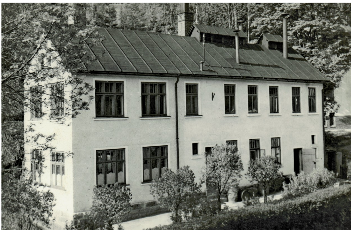
Fotografie bývalé mačkárny a brusírny skla ve Smržovce (č. p. 1106) ze 40. let 20. století. Sbírka Muzea místní historie ve Smržovce.