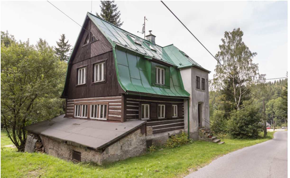
Bývalá brusírna skla na vodní pohon v Janově nad Nisou na Malém Semerinku (ev. č. 1213).