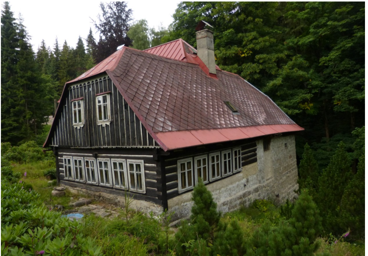
Bývalá brusírna skla na vodní pohon v Karlově (ev. č. 315).