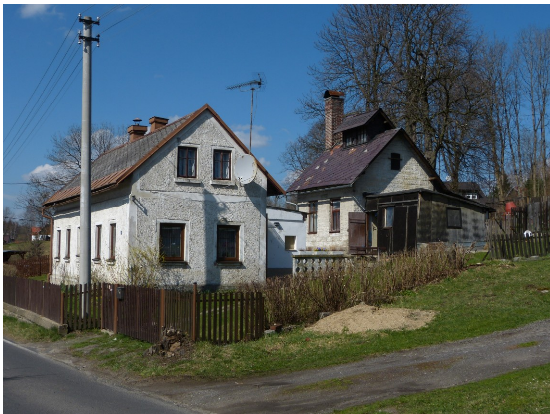
Mačkárna skla na Nové Vsi u domu č. p. 237.