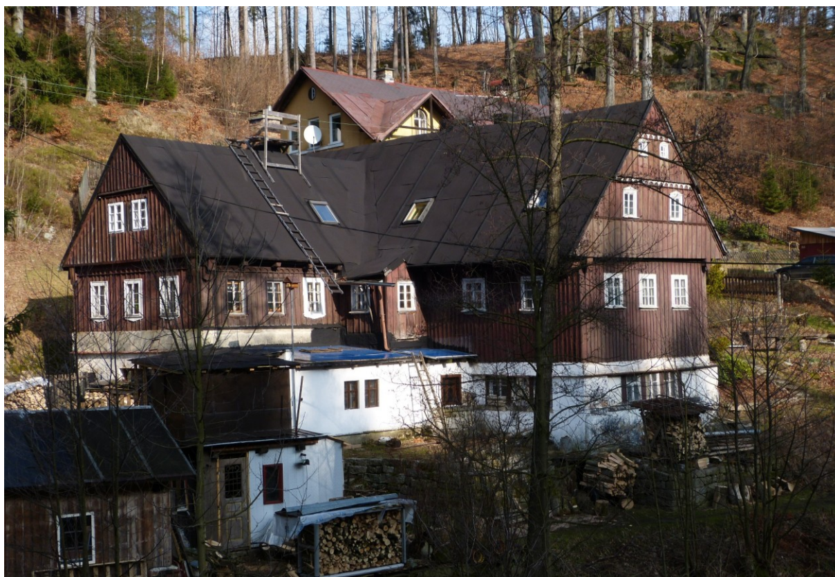
Bývalá brusírna skla na vodní pohon v Lučanech nad Nisou (č. p. 192).