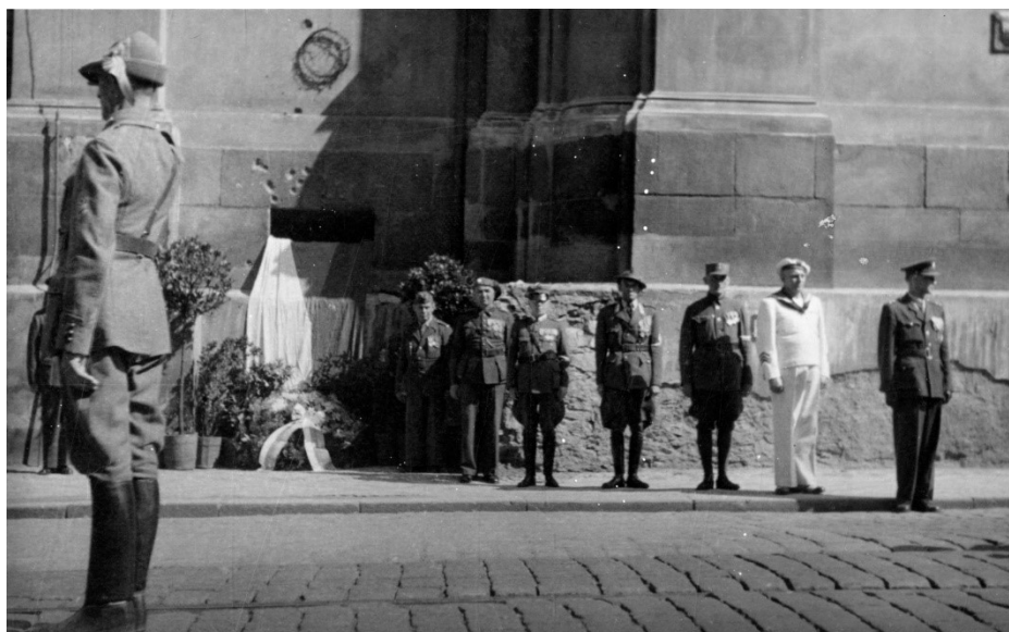
Příloha č. 9