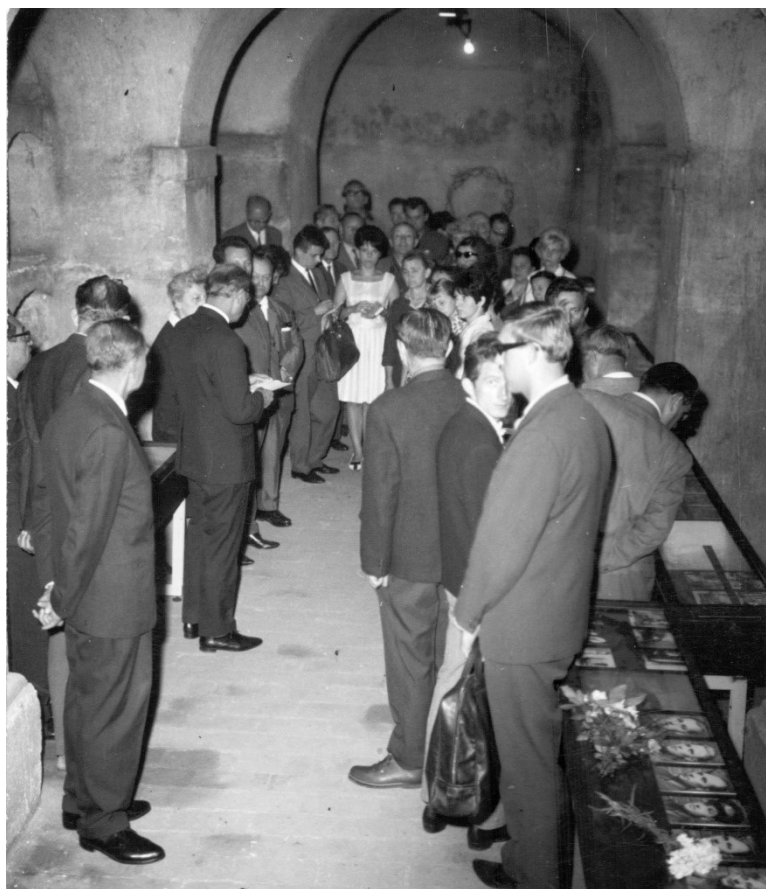
Příloha č. 12