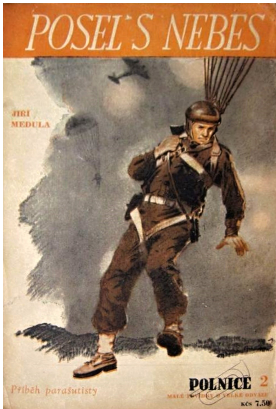
Příloha č. 1: