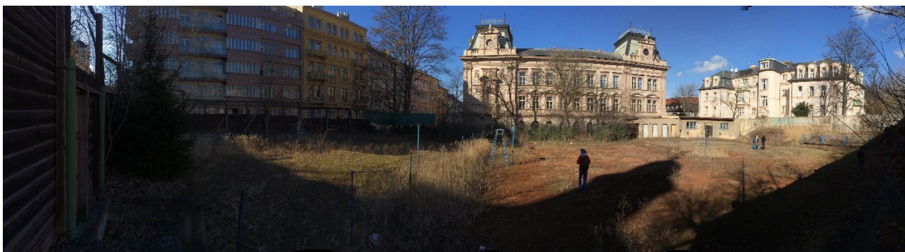
Obrázek 9: Stav prostoru 17. 2. 2014

Vizuálně se v prostoru opravdu nic úplně zásadního nestalo, pokud soudíme celek. Z fotografií je patrné, že přibyly truhlíky a část půdy se začala využívat k pěstování rostlin. Zrak a estetické preference umí být navíc ošidné. Fotky původního stavu mám pouze z doby vegetačního klidu, věřím že na konci jara mohl mít prostor svou poetiku městské divočiny v progresu. Vidím ale, že hlavní změnou je využití lidmi. Sociální rovina, o které je tahle kapitola, je patrná.