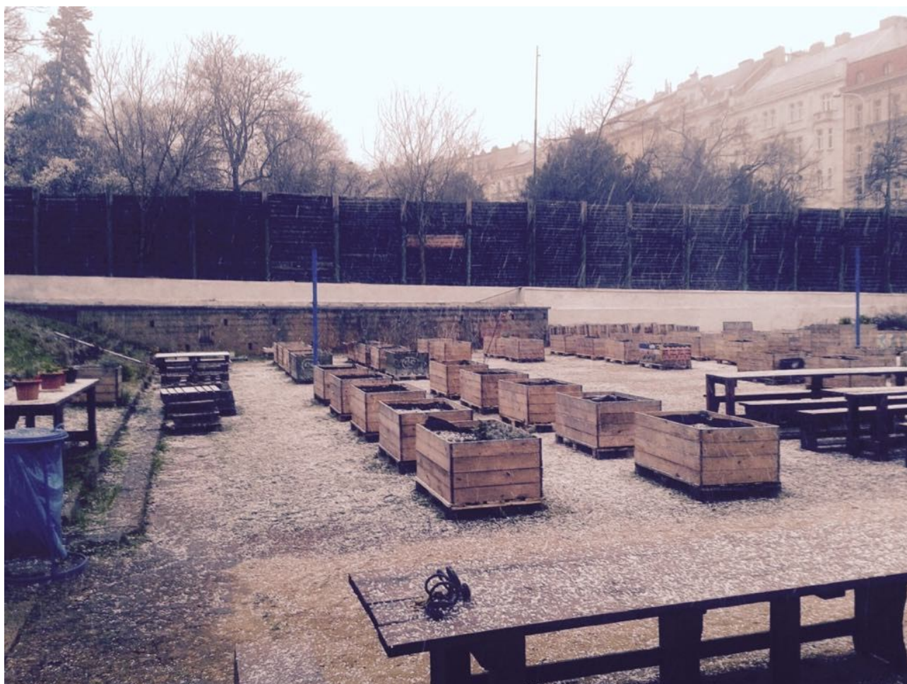
Obrázek 17: Sněží na zahradu, ilustrační foto méně atraktivní reality Smetanky