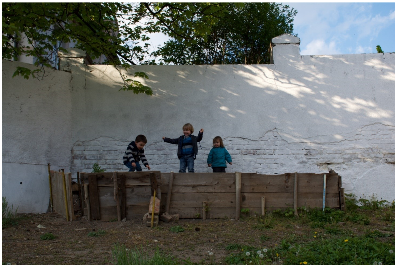
Obrázek 14: Dětská hra, duben 2015

A viděli jsme, že důvodem pro další existenci komunitní zahrady bylo pro zahradníky to, že ji považovali za zeleně , která bude těžko hledat své místo a že to byl pro ně prostor unikátní . Kde by si asi chtěl hrát malý Sam z teoretické části o přírodě? V dokonalé, žádné anebo úplně jiné přírodě?