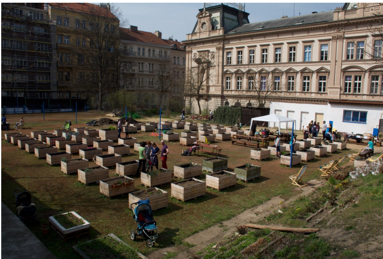
Obrázek 8: 11.4 2015