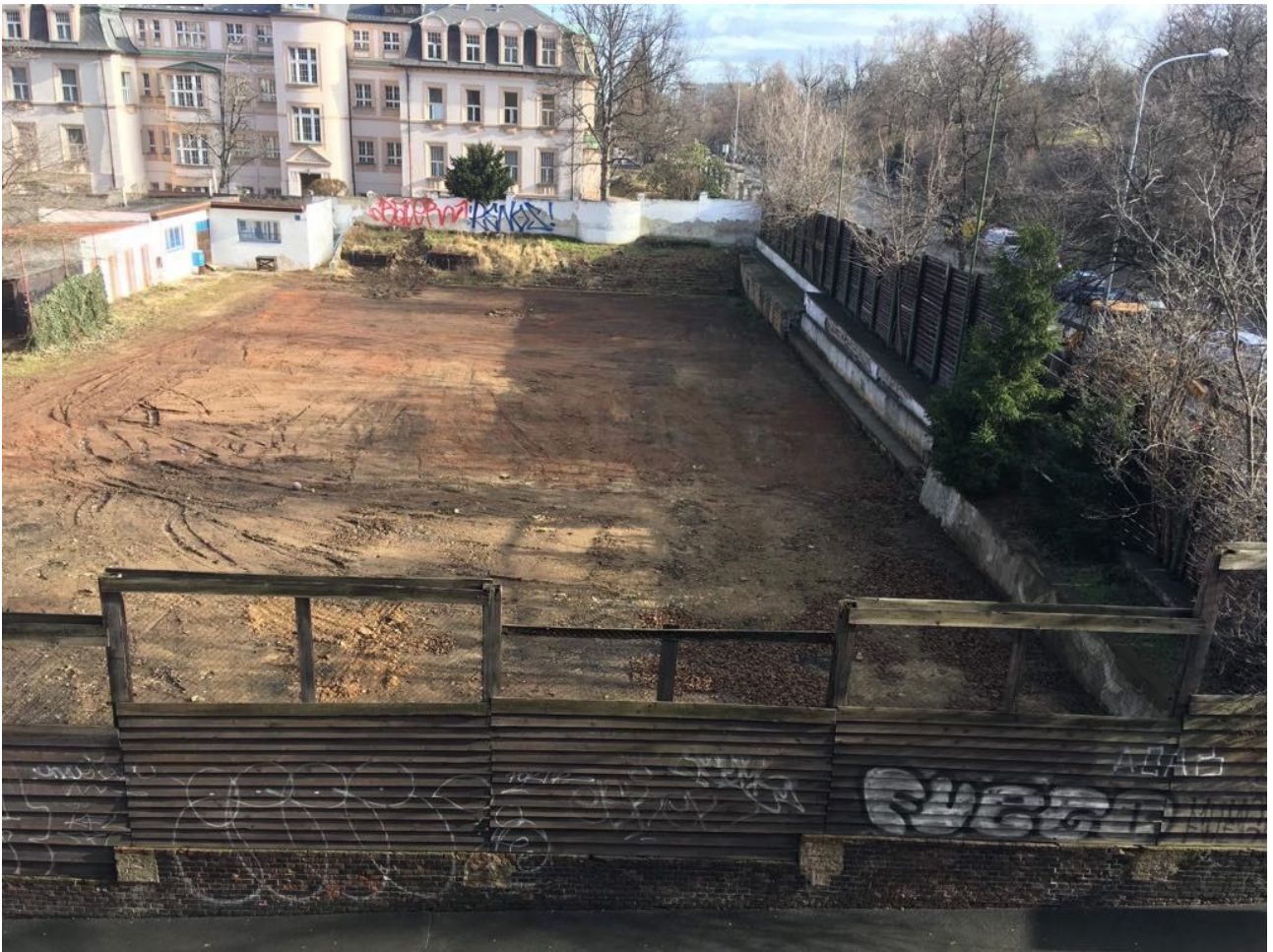
Obrázek 11: Celkový pohled: Zahrada rok po uzavření - opuštěná (Foto a titulek: archiv Kateřina Jechová, 2018)