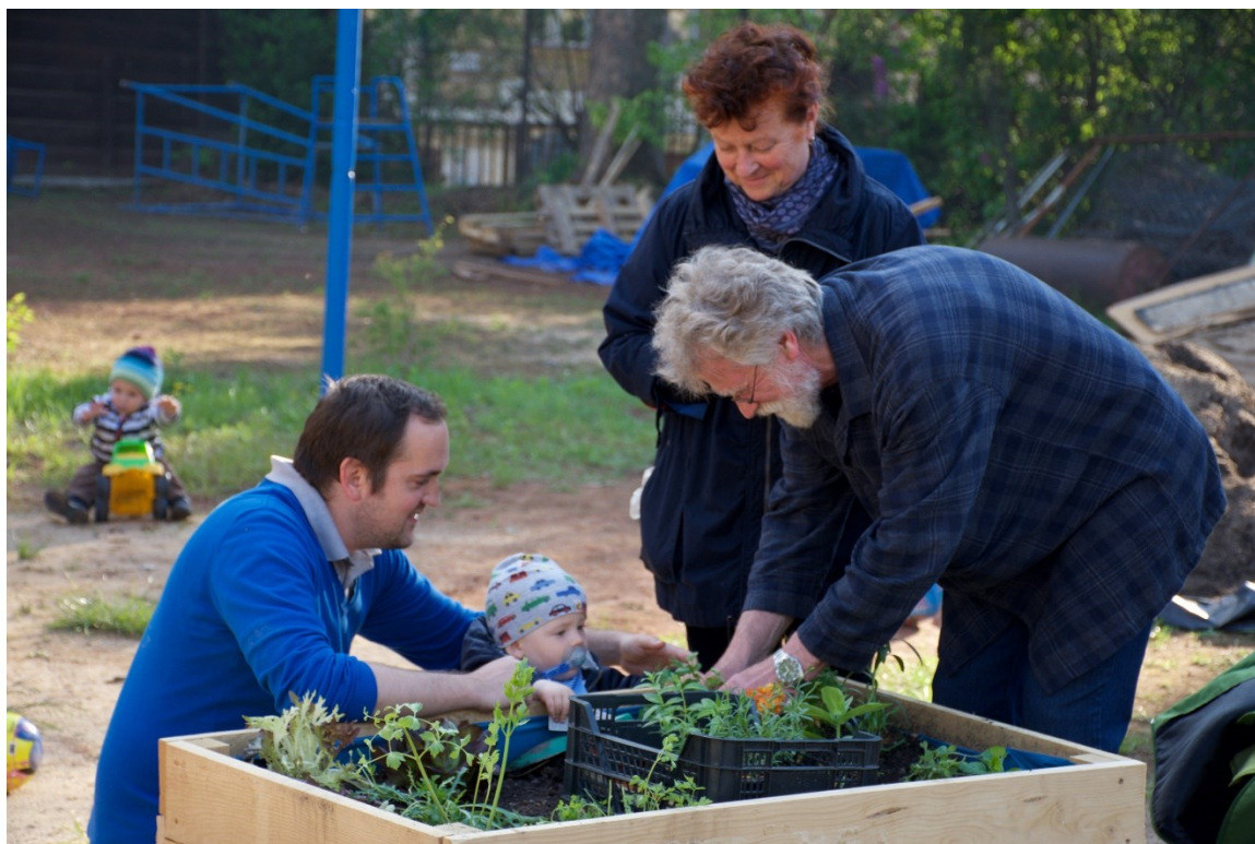
Obrázek 5: Ilustrační foto: "zahradníkem od útlého dětství"

Herní prvky na Smetance podle Hanky vycházely z představ dětí, které ho pomáhaly vymýšlet a projektovat. Františka pokračuje výčtem aktivit a naráží na hřiště, které se v průběhu času postupně vylepšovalo: „když bylo teplo, tak si tam děti prostě mohly hrát v nějaký vaně a pak vlastně tím, že tam ještě chodila Živé děti, školka, tak tam udělali nějaké zázemí jako trochu Montessori styl venkovní“ (Františka).