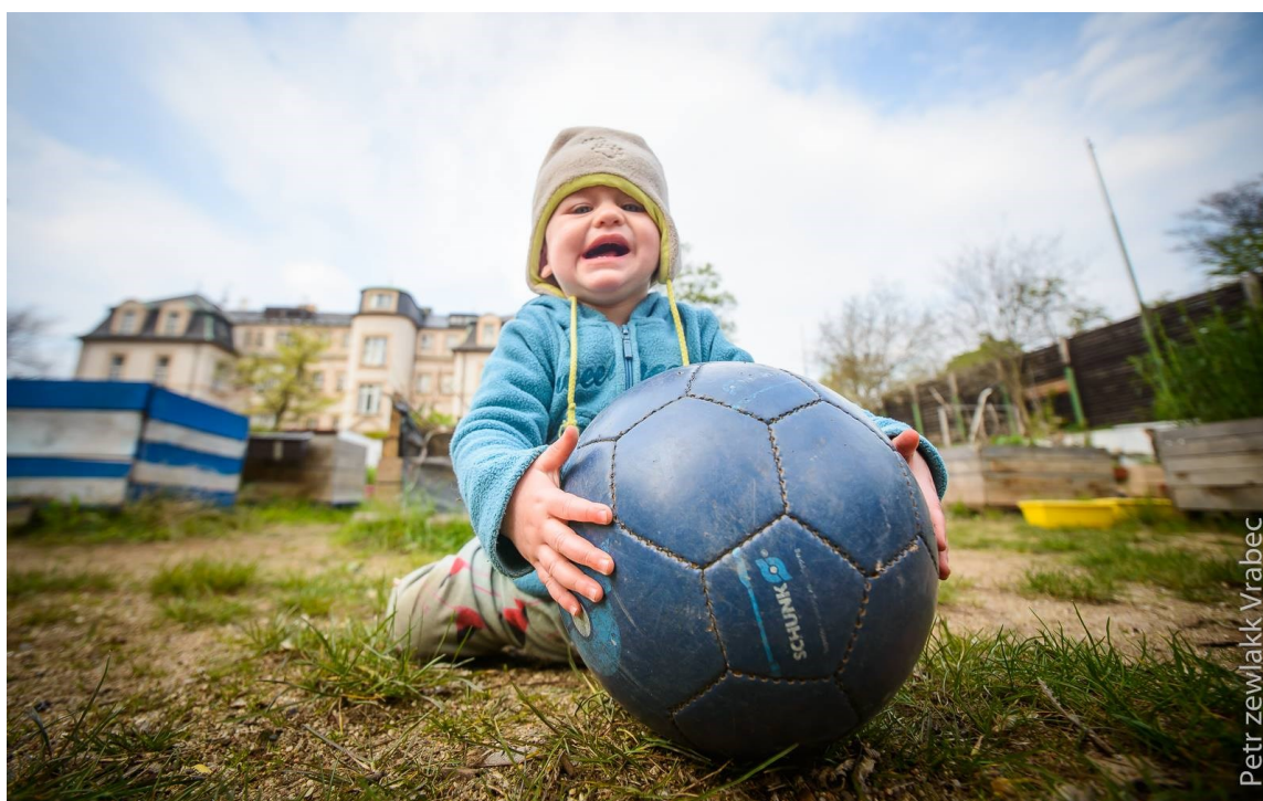
Obrázek 15: duben 2017