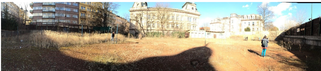
Obrázek 7: Stav prostoru 17. 2. 2014

Jelikož asi nemůžu rozsoudit tohle rozdílné vidění, nechám čtenáři na posouzení fotografické ilustrace proměny prostoru v čase.