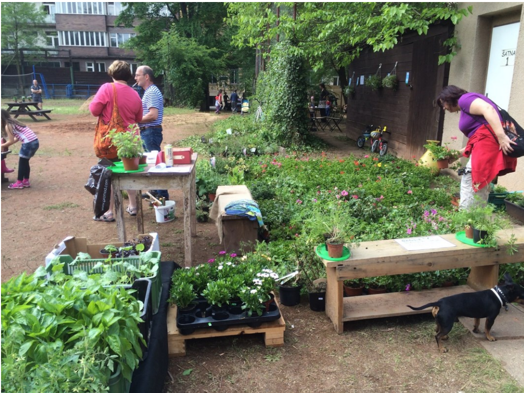
Obrázek 12: První den otevření