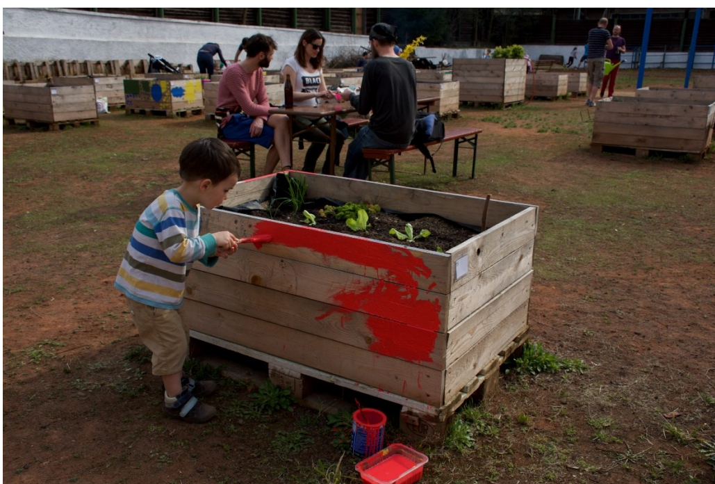
Obrázek 4: Dítě při tvorbě v rámci jeho možností