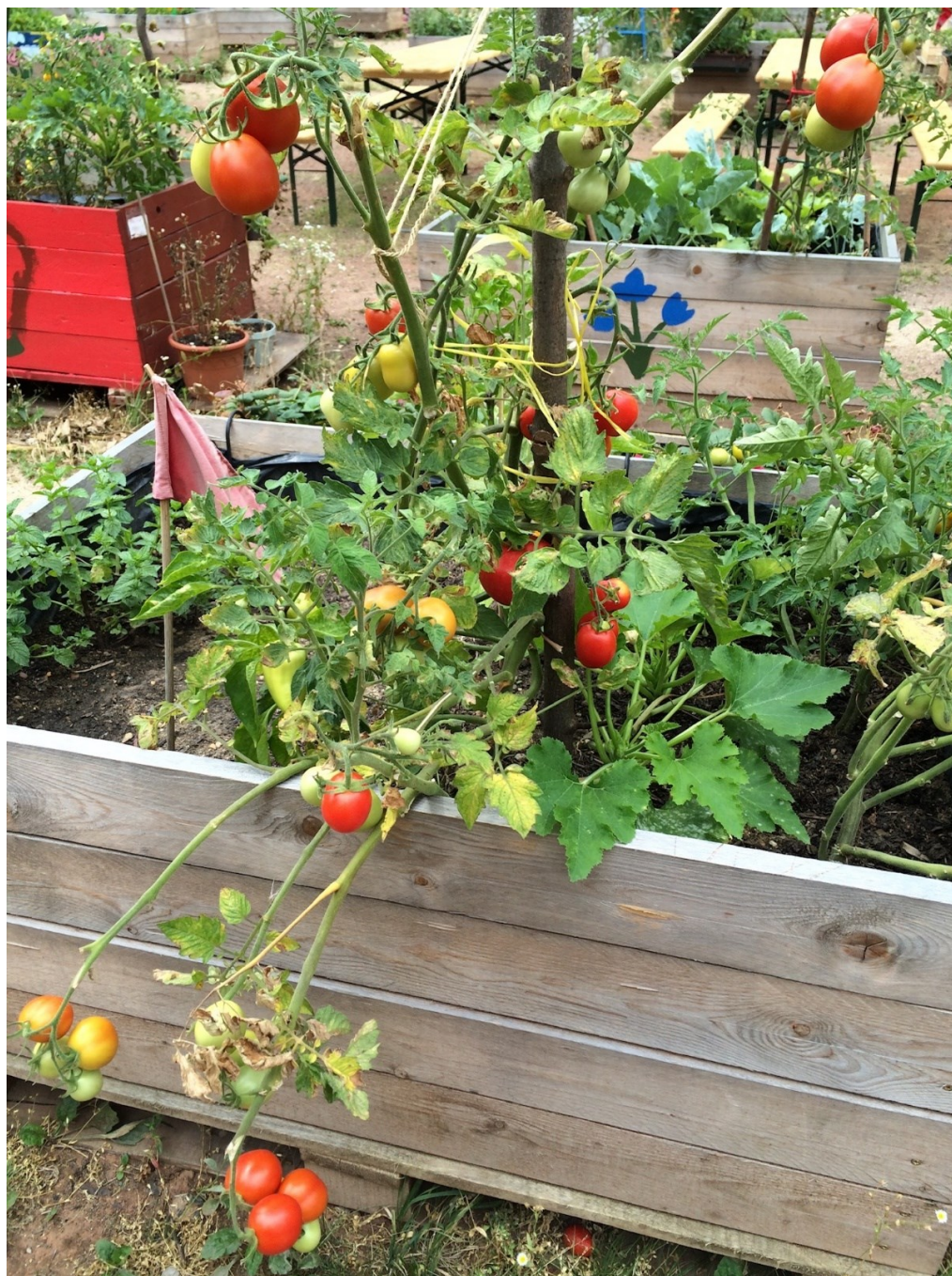
Obrázek 2: když se něco v truhlíku „začalo přemnožovat nebo hojně dozrávat“ - Ilustrační foto úrody