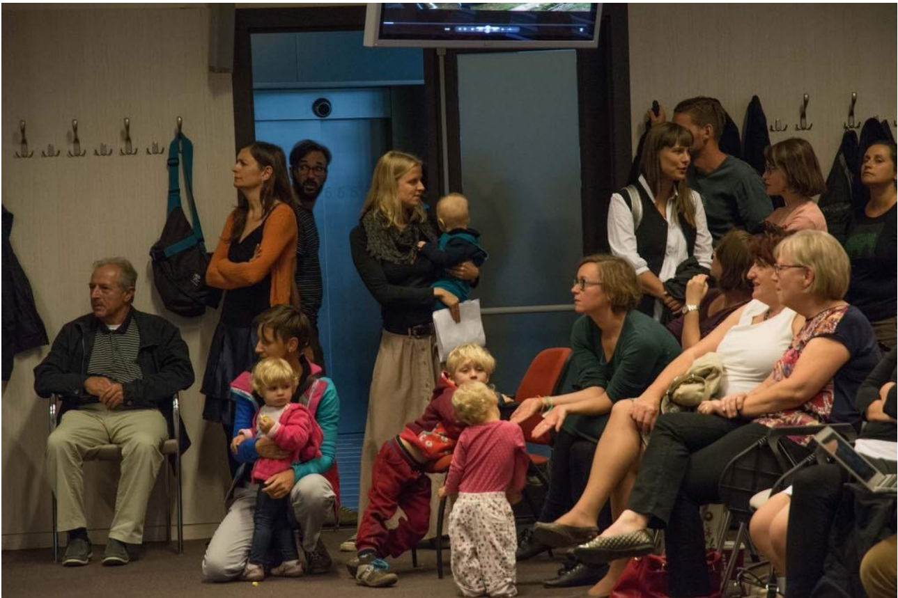
Obrázek 1: Interpelace 19. 9. 2016, pohled na součásti sociopřírody