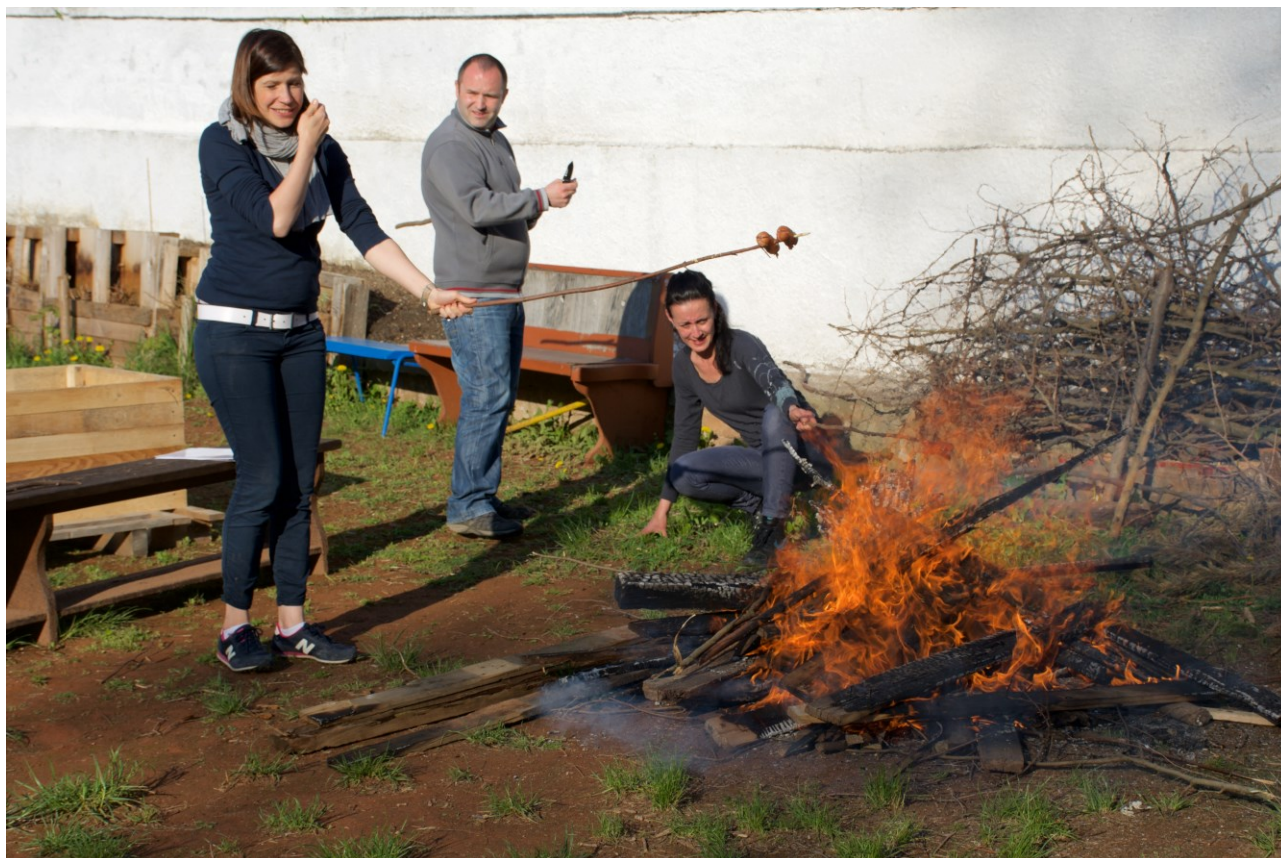
Obrázek 18-23: další ilustrační foto