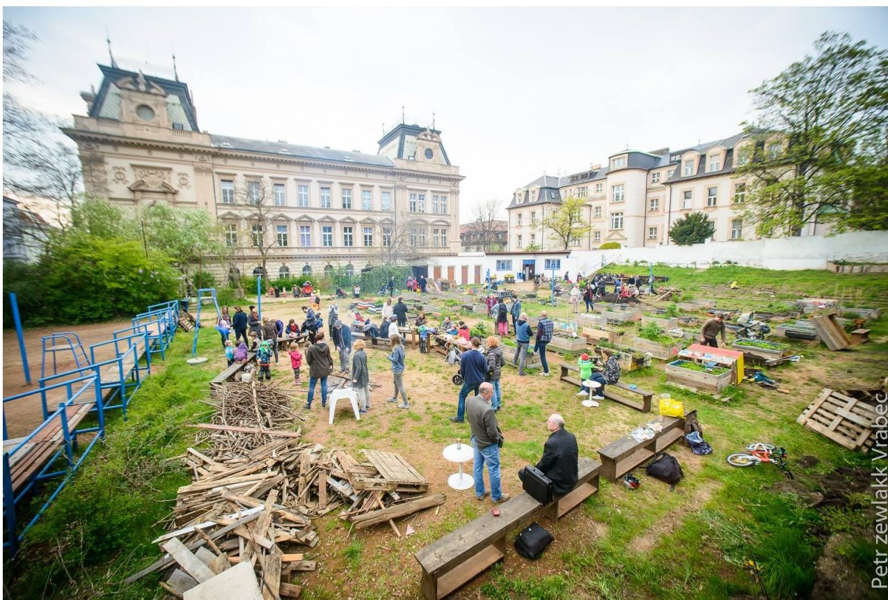
Obrázek 10: Loučení s komunitní zahradou, demontáž truhlíků (21.4. 2017)