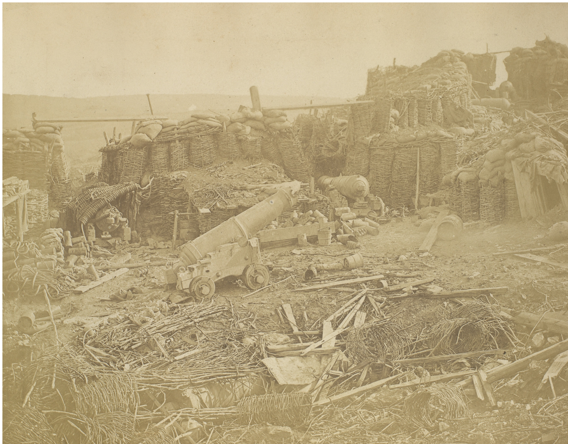
Dvě Robertsonovy fotografie, zachycující Velký redan po ústupu ruských jednotek po nezdařeném generálním útoku z 8. září 1855. James Robertson, „The Redan after the Assault 1855-56,“ RCIN 2502452 a James Robertson, „Interior of the Redan 1855,“ RCIN 2500697.