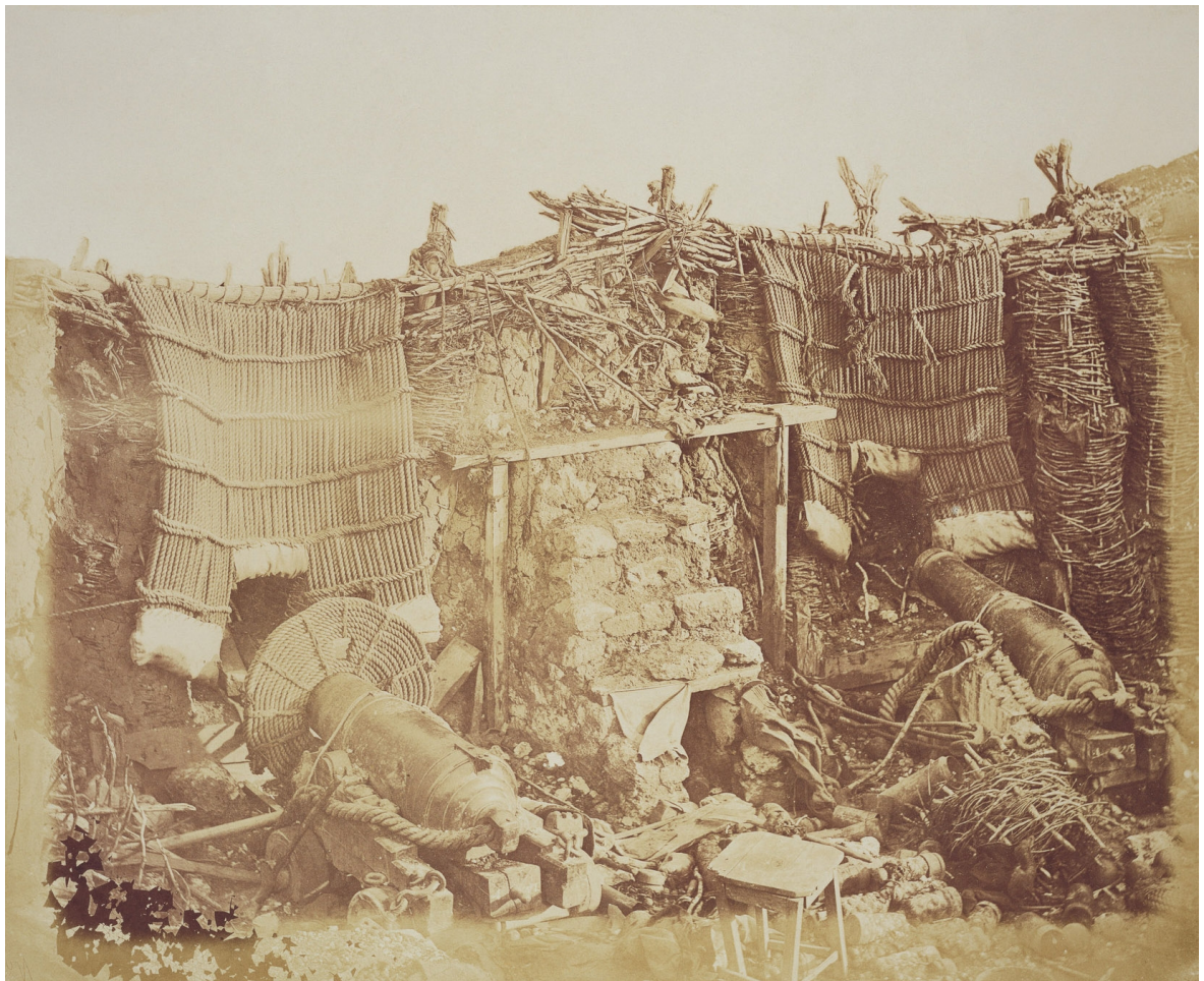
Robertsonova fotografie ruských pletených záštíť na dělech, které chránily obsluhu před palbou ručních zbraní. James Robertson, „Mantlets in the Barracks Battery 1855-1856,“ RCIN 2500706. Dole: vzácný záběr na (povinnou) nedělní bohoslužbu v britském táboře u gardového praporu. James Robertson, „Divine Service in the camp of the Guards 1855-1856,“ RCIN 2500658.