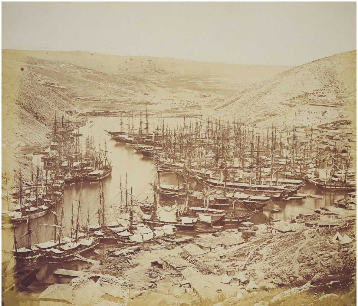
Pohled na balaklavský přístav od vjezdu.