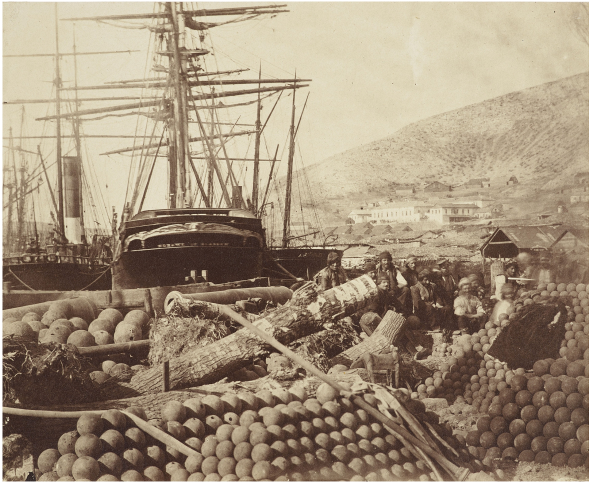
Nákladní molo v balaklavském přístavu v březnu 1855. Roger Fenton, „The Ordnance Wharf at Balaklava March 1855,“ RCIN 2500461.