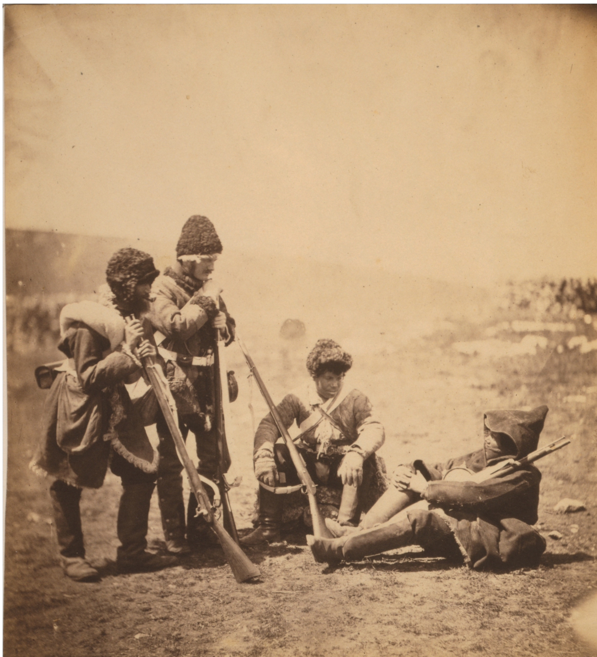
Skupina britských vojáků 77. pluku v improvizovaném teplém zimním oblečení, které na Krym dorazilo v rámci celonárodní humanitární sbírky. Roger Fenton, „Men of the 77th Regiment in winter costume,“ LC-USZC4-9160.