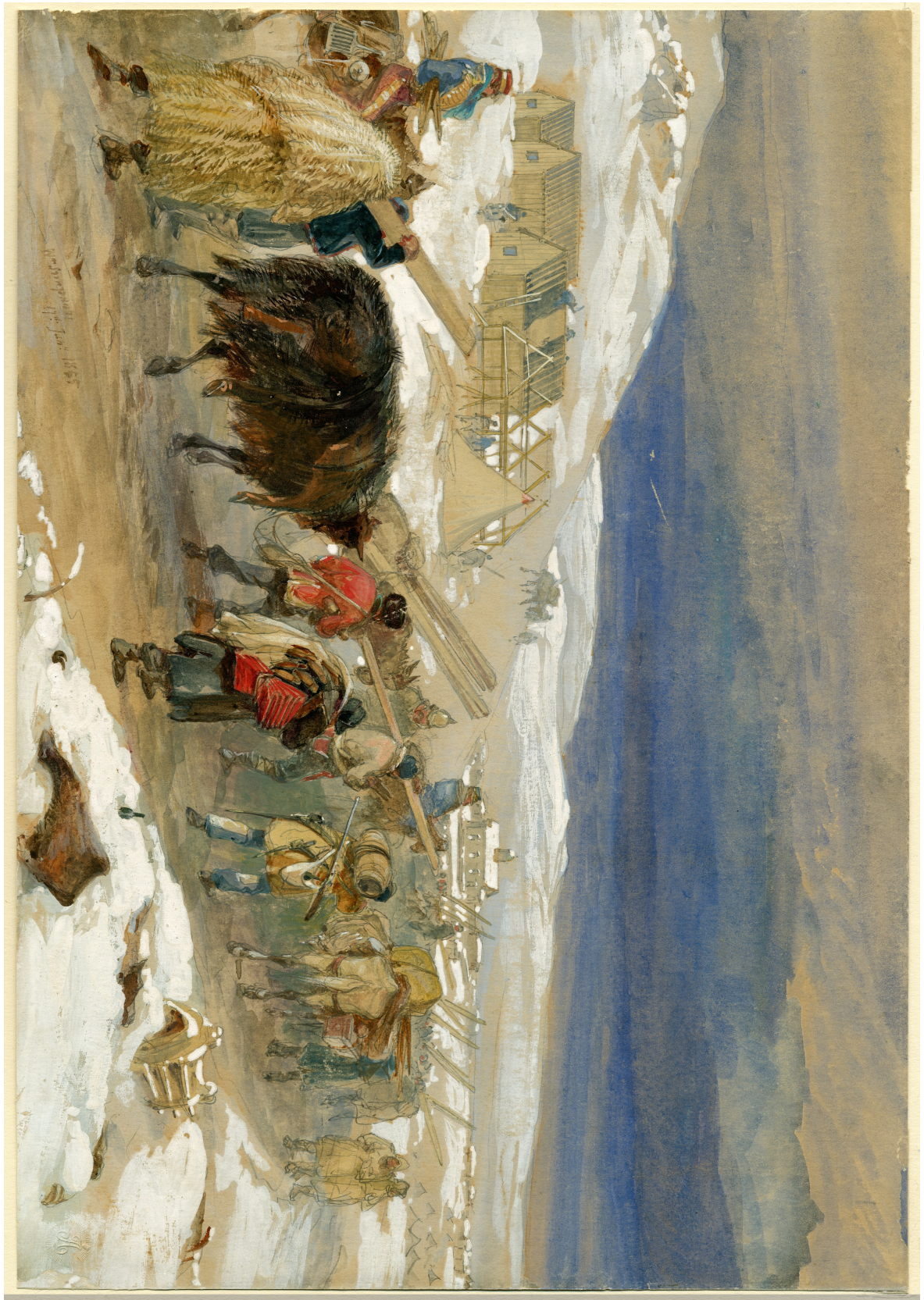
Akvarel Williama Simpsona, zachycující transport teplého zimního oblečení a montovaných chatek pro armádu, patrně únor/březen 1855. William Simpson, „Huts & warm clothing for the army,“ Brown University Library, Prints, Drawings and Watercolors from the Anne S.K. Brown Military Collection.