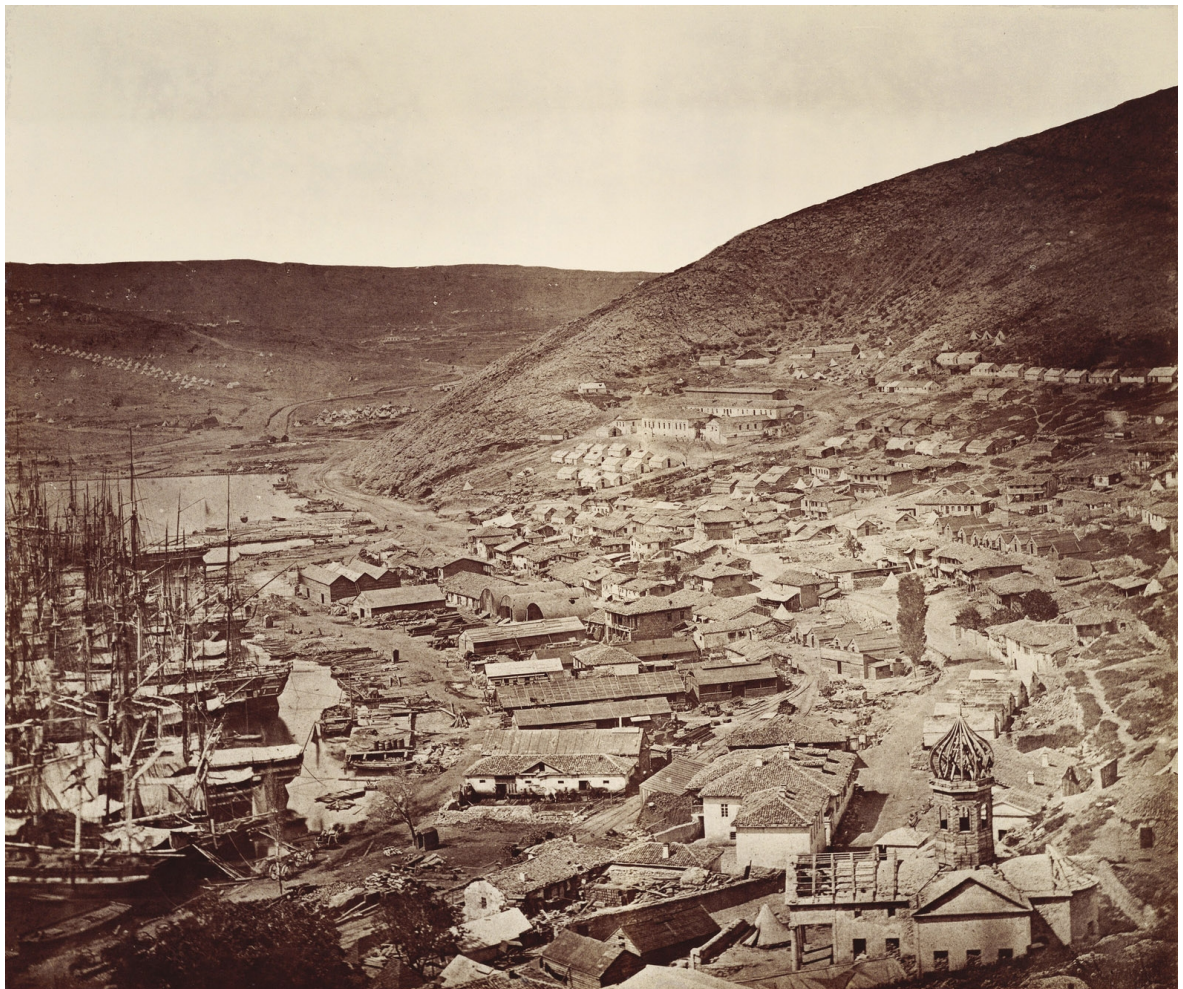
Pohled na východní část balaklavského přístavu.