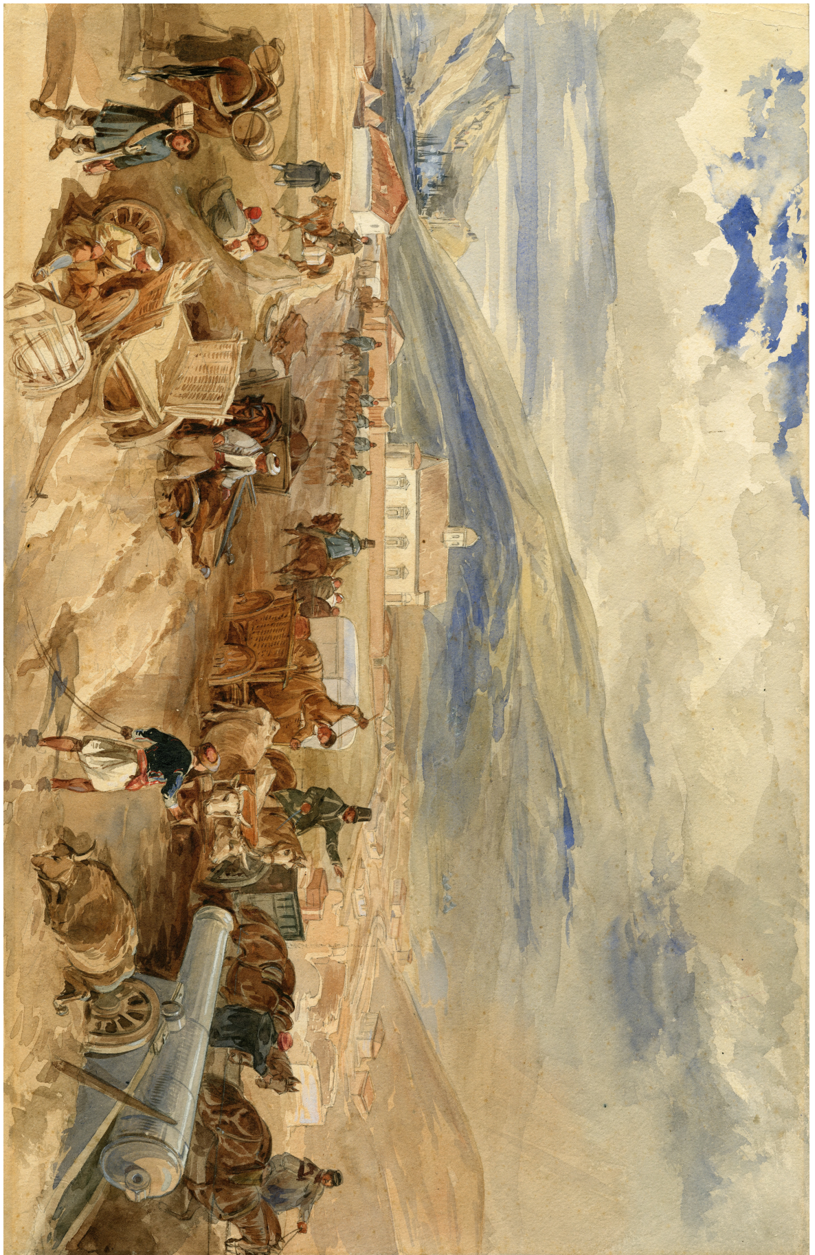
Akvarel Williama Simpsona, znázorňující neprůchodnou zásobovací cestu do britského vojenského tábora z balaklavského přístavu během zimy 1854/55. William Simpson, „Balaclava, 1854--Commissariat difficulties,“ Brown University Library, Prints, Drawings and Watercolors from the Anne S.K. Brown Military Collection.