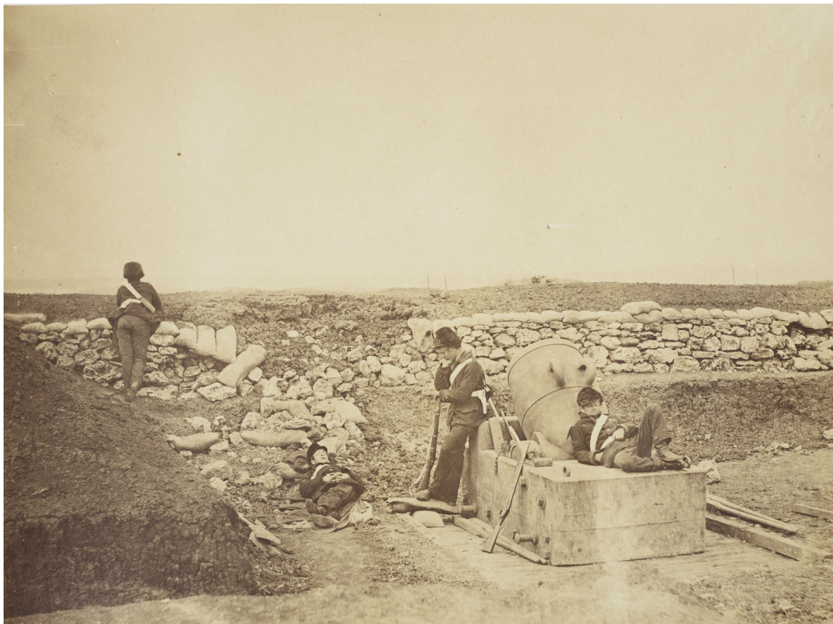
Fentonova fotografie zachytila britskou mozdířovou baterii během klidného období obléhání po konci druhého ostřelování. Roger Fenton, „Quiet day in the ‚Mortar Battery‘ 23 Apr 1855,“ RCIN 2500508. Dole: známá Fentonova fotografie Voronzovovy cesty s nahromaděnými dělovými koulemi. Roger Fenton, „The valley of the shadow of death,“ LC-USZC4-9217 DLC.