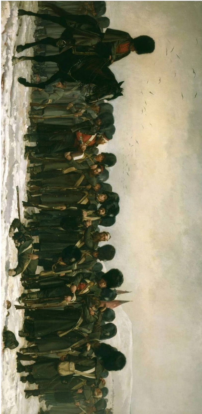
Známé plátno Elizabeth Thompson bylo vytvořeno v roce 1874. Thompson byla na Krymu přítomna od října 1854 a pořídila množství kreseb, podle nichž později vytvářela monumentální plátna. Toto má znázorňovat gardovou pěší jednotku během nástupu po bitvě u Inkermanu z listopadu 1854. Elizabeth Southerden Thompson, Lady Butler, „Calling the Roll After An Engagement, Crimea,“ 1874.