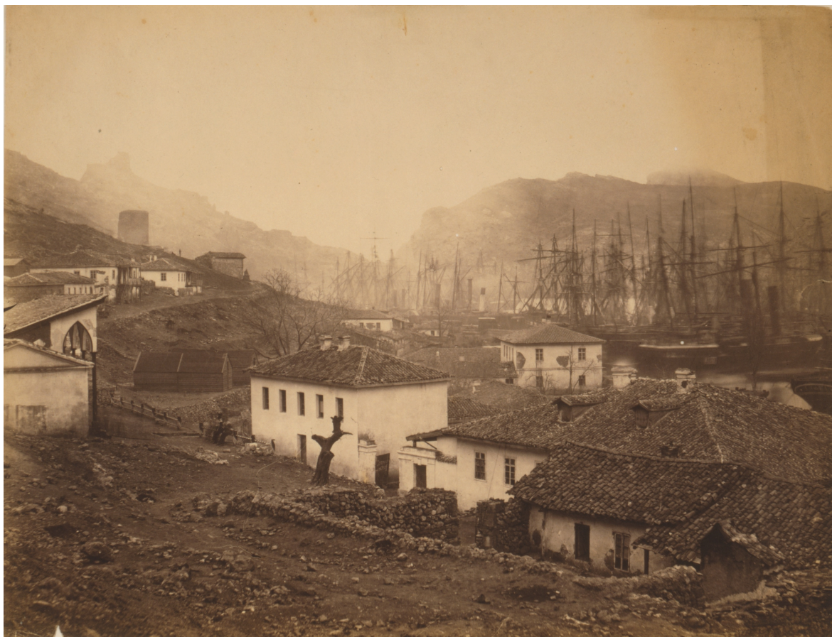
Pohled na balaklavský přístav směrem k otevřenému moři někdy na jaře 1855. Roger Fenton, „Balaklava looking seawards,“ LC-USZC4-9142.