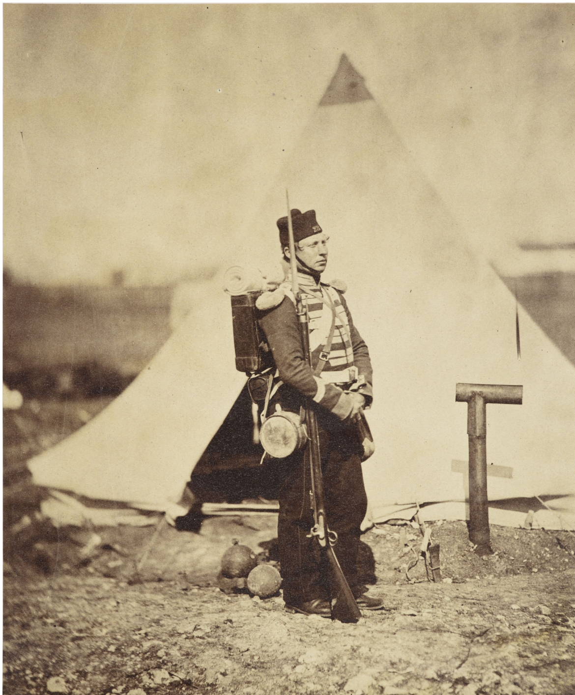
Fentonova fotografie plné polní britského pěšáka. Roger Fenton, „Private of the 23rd Regiment in full marching order 1855,“ RCIN 2500307.