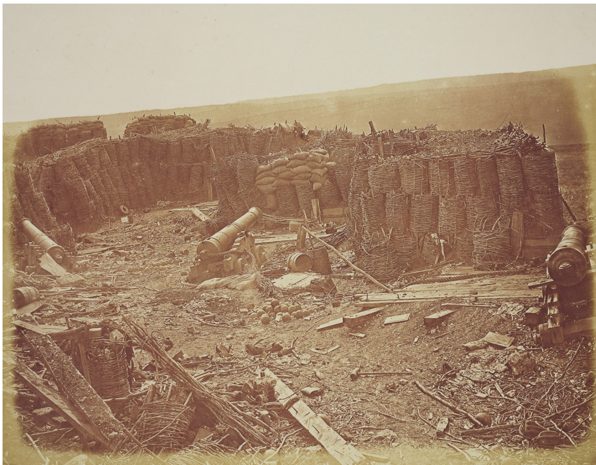
Dvě Robertsonovy fotografie interiéru Malachovského vrchu po generálním útoku z 8. září 1855. James Robertson, „Interior of the Malakoff 1855,“ RCIN 2500689 a James Robertson, „Interior of the Malakoff 1855,“ RCIN 2500690.