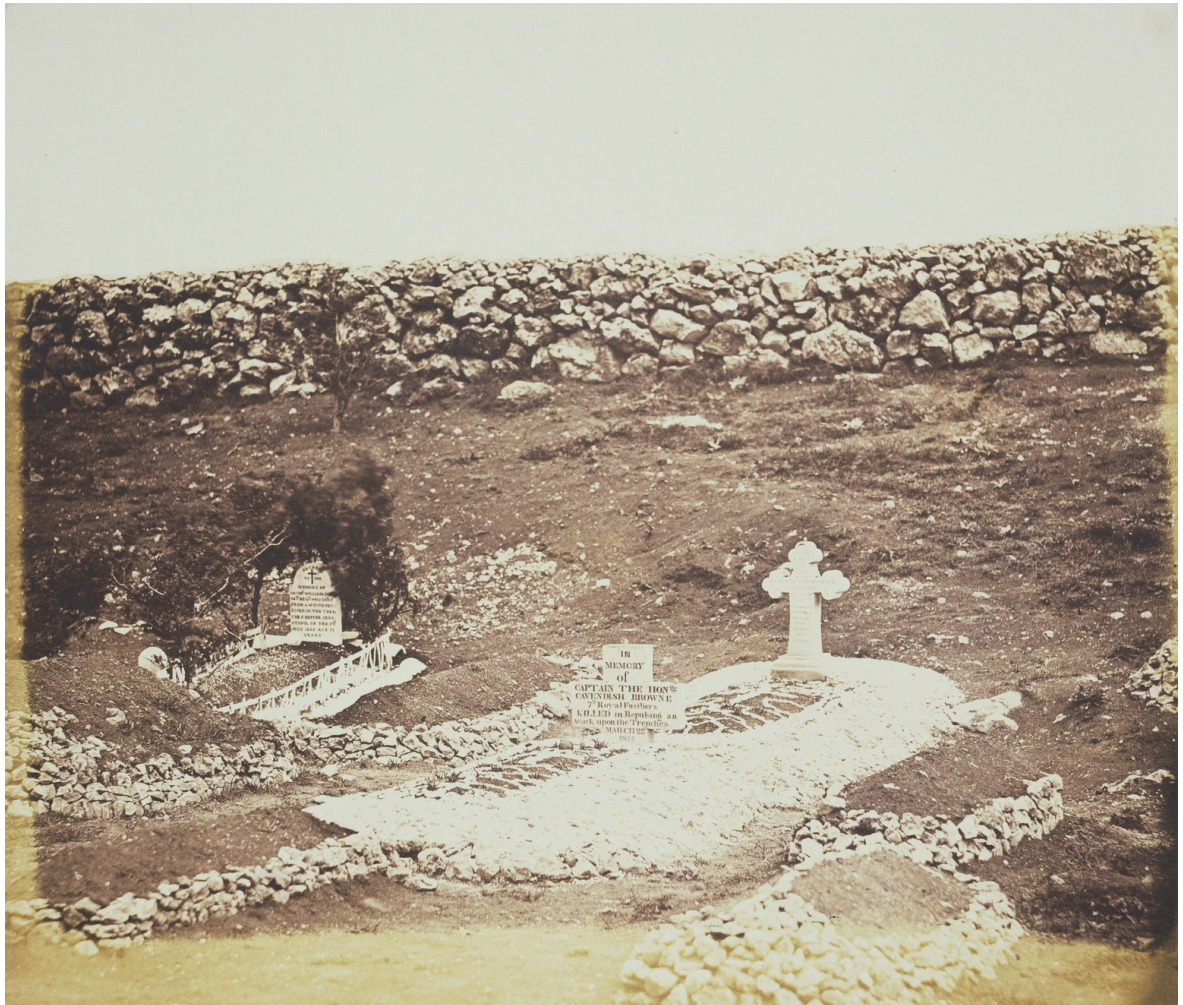
Robertsonova fotografie hrobu kapitána Cavendish Brownea, který padl během odrážení výpadu. James Robertson, „Grave of Captain the Hon Cavendish Browne, 7th Royal Fusiliers 1855-1856,“ RCIN 2500763. Dole: Fentonova fotografie dalšího britského hřbitova. Roger Fenton, „The cemetery Cathcart's Hill - the Picquet House, Victoria Redoubt and the Redoubt des Anglais in the distance,“ LC-USZC4-9280.