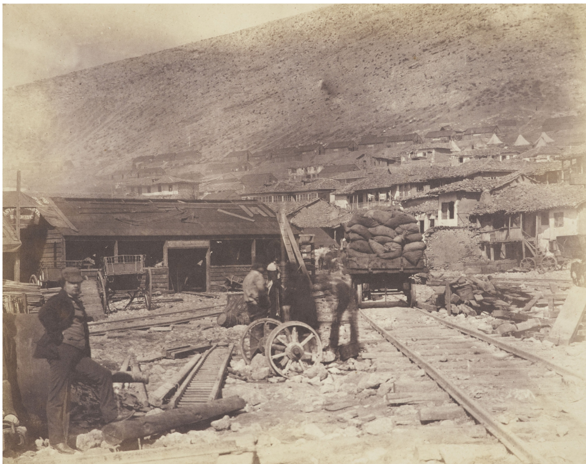
Železniční depo v balaklavském přístavu v březnu 1855. Roger Fenton. „Railway yard at Balaklava 15 March 1855“, RCIN 2500570.