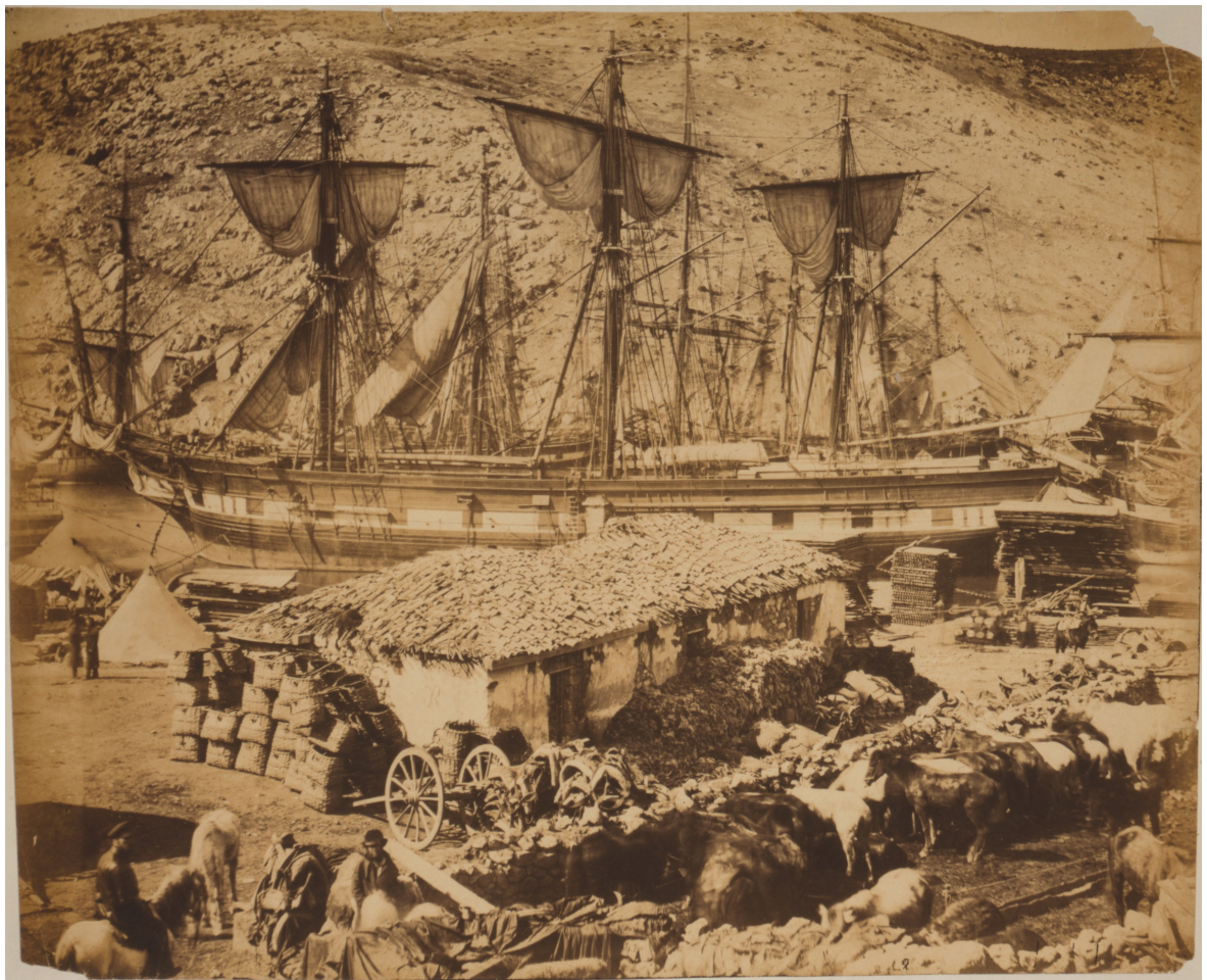
Balaklavský přístav, molo s jatkami. Roger Fenton, „Balaclava harbour, the cattle pier,“ LC-USZC4-9188.