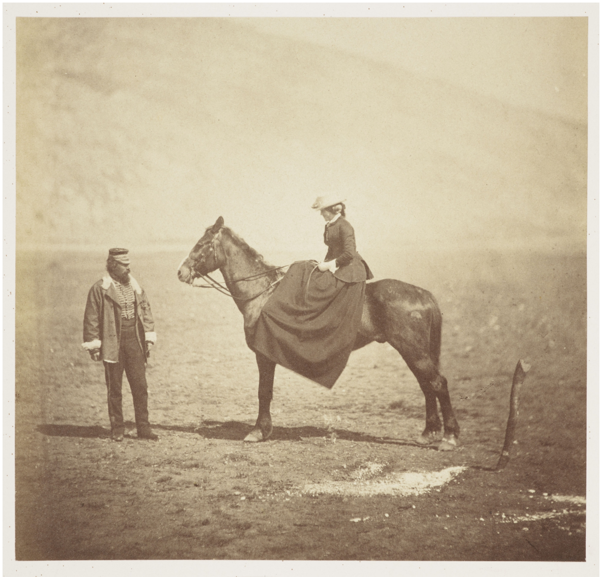
Jedna z nejznámějších civilních účastnic obležení Sevastopolu, Frances Isabella Duberly se svým manželem Henrym, zachycená v dubnu 1855.