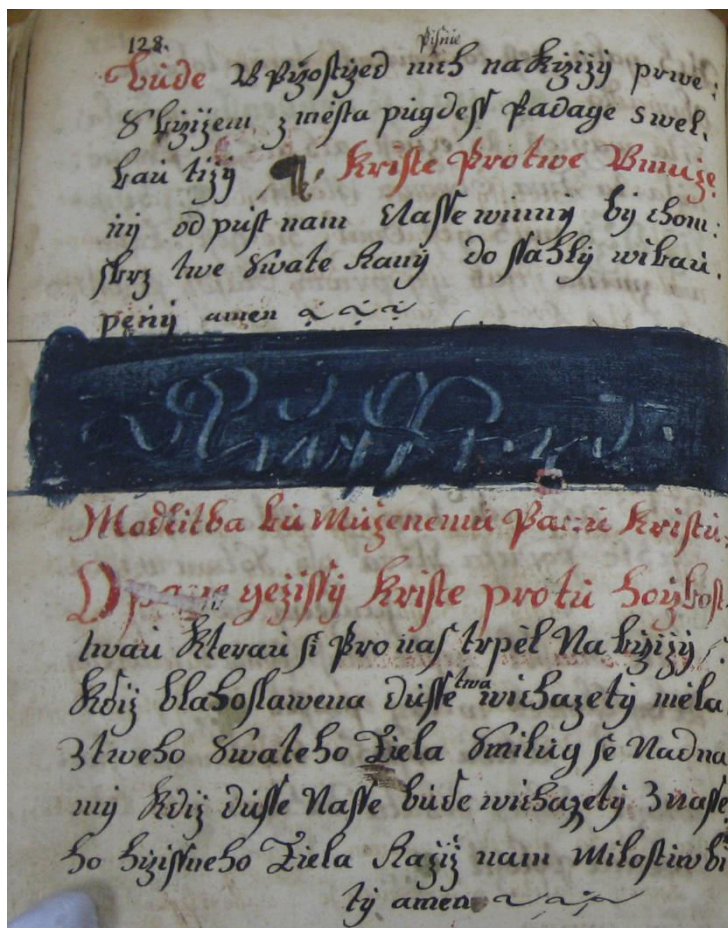
Obrázek 1: Zamalovaná část textu

který autor zpětně shledal nevhodným, tak pouhý omyl při prepisování, který vyřešil tímto způsobem. Chyby v prepisu jsme svědky i na jiných místech, kde se písař nerozpakoval škrtnout ani celý řádek (např. s. 371 či 538). Po zamalovaném textu následuje krátká modlitba uprostřed oddílu písní, což není pro tento kancionál zcela obvyklé, neboť modlitby běžně uzavírají tematické celky, není navíc ohraničena typickým červeným rámečkem. Podobně je