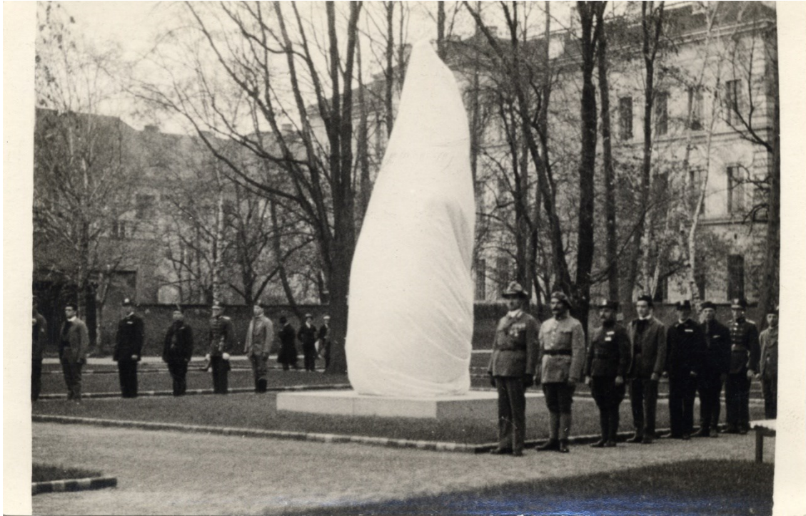
Odhalení pomníku T. G. Masaryka v roce 1930 v Rakovníku.