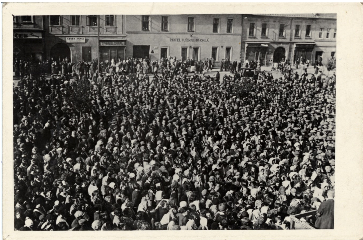
Tábor lidu 5. června 1935 v Rakovníku.