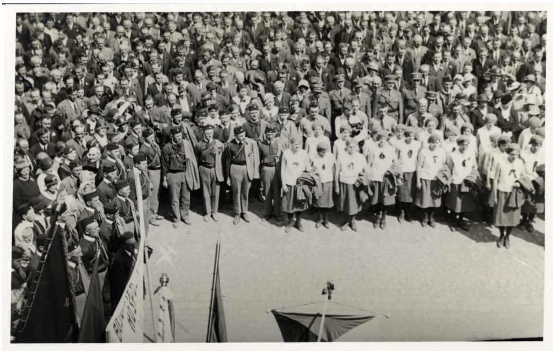
Oslavy 1. máje sociálních demokratů v roce 1934 v Rakovníku.