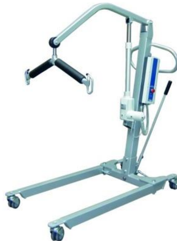
(1006 STANDARD, 2018)