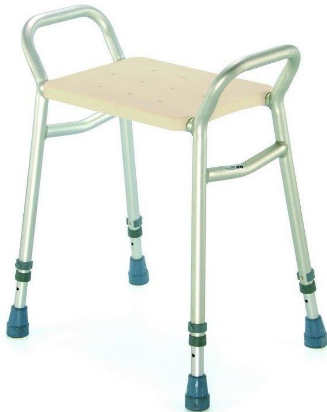
(539 A, 2018)