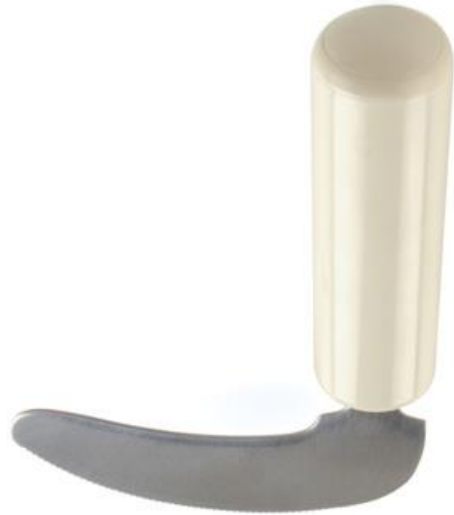
(ADL 10, 2018)