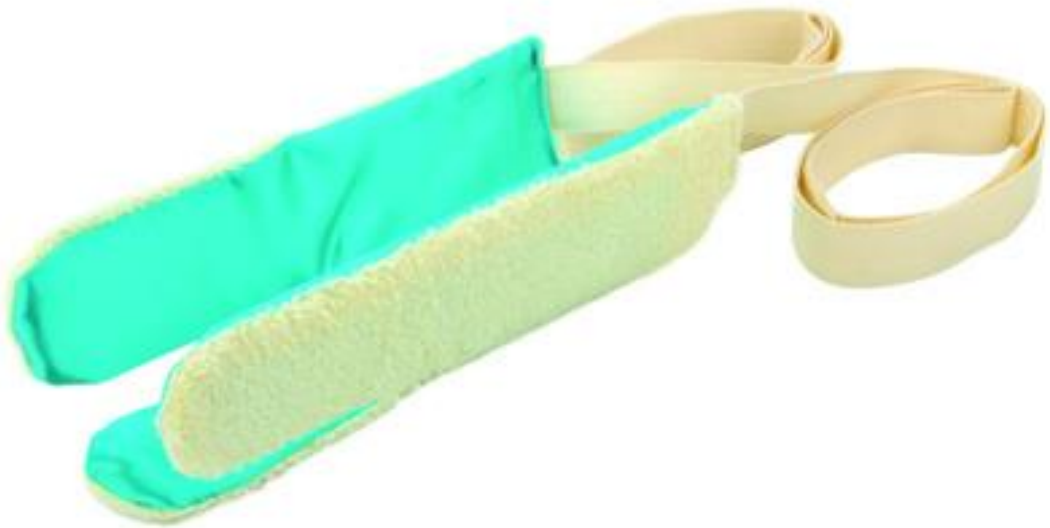
(ADL 39, 2018)