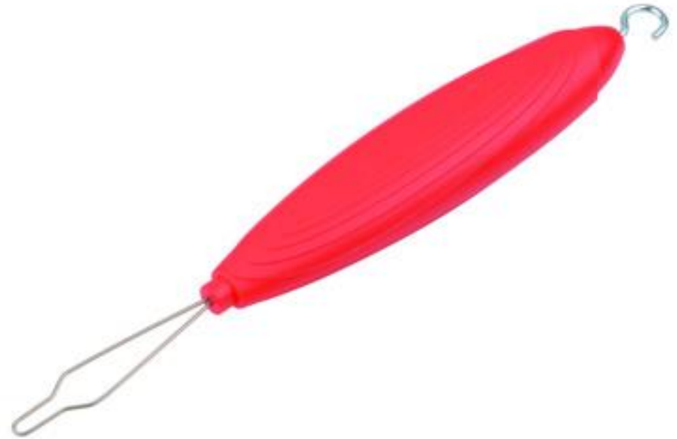
(ADL 70, 2018)