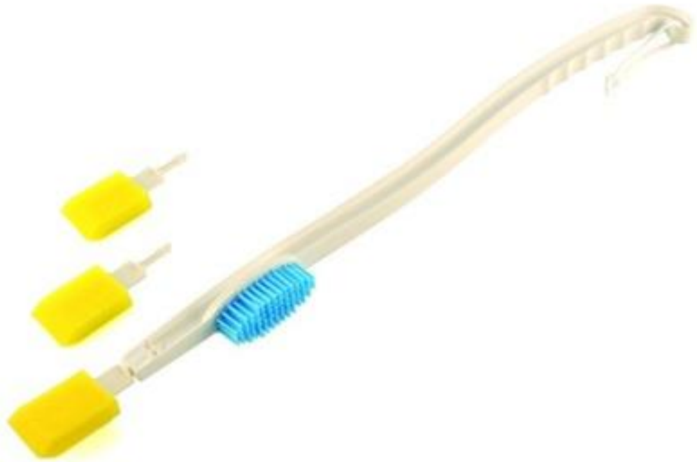
(ADL 38, 2018)