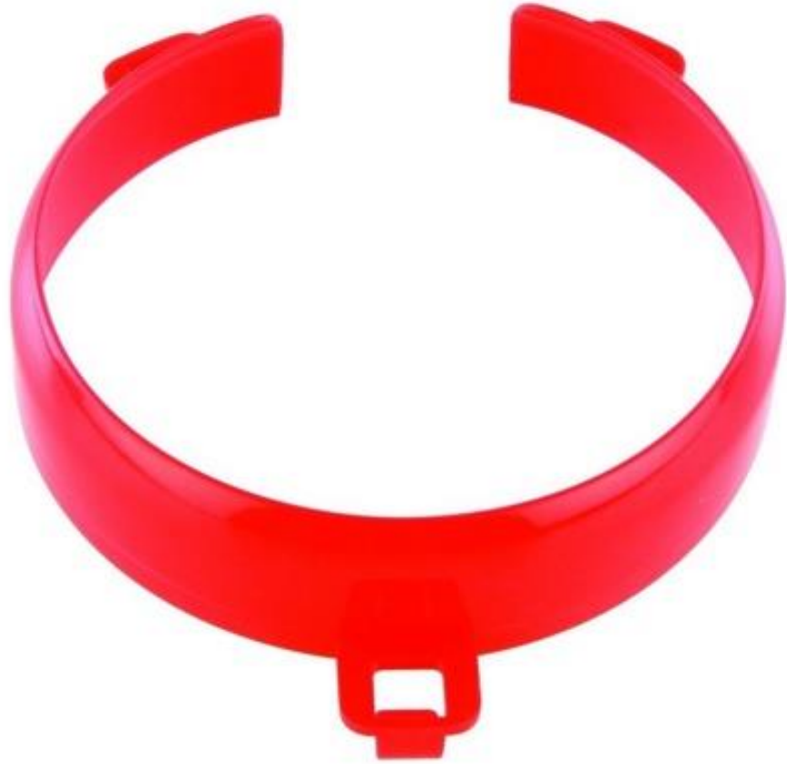
(ADL 2, 2018)