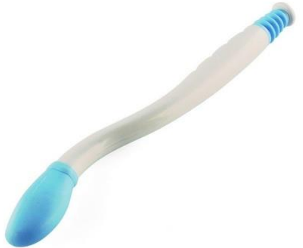
(ADL 39, 2018)