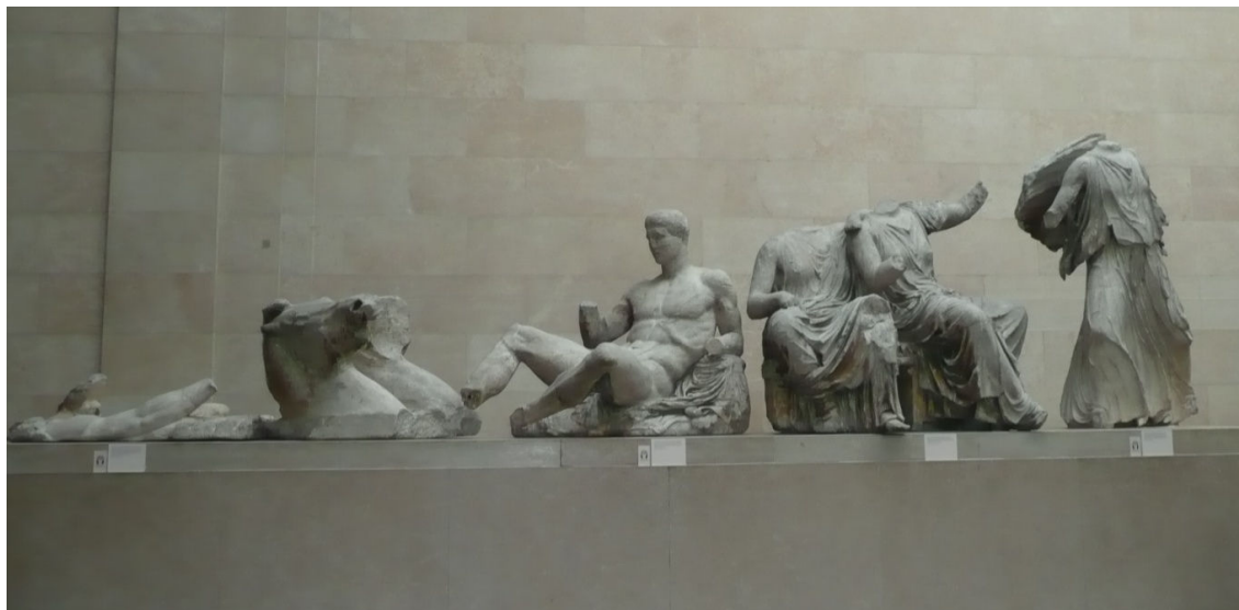
Příloha č. 5: Ukázka štítových soch