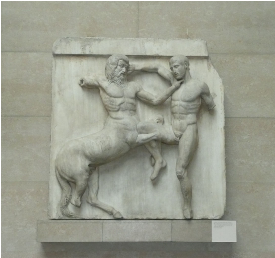
Příloha č. 4: Ukázka metopy