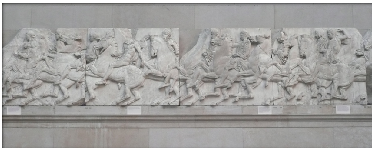
Příloha č. 3: Ukázka parthenónského vlysu