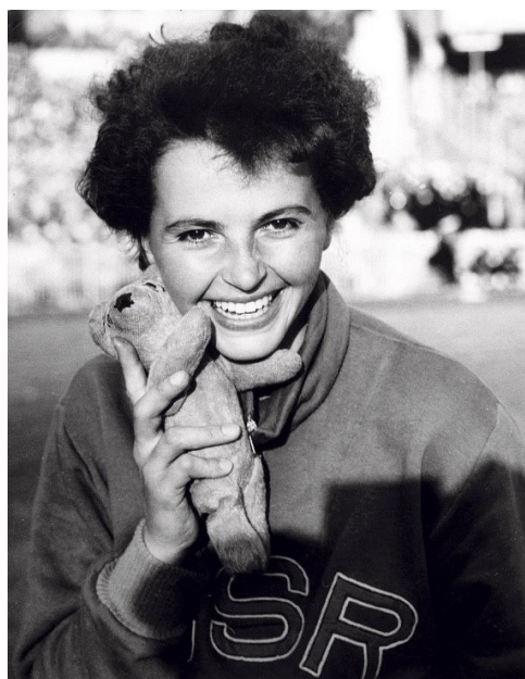
Olga Fikotová (Obr. 1)

Známa je také situace po skončení LOH v Melbourne, které se konaly na přelomu listopadu a prosince v roce 1956. Protisovětské povstání v Maďarsku na přelomu října a listopadu téhož roku vzbudilo obavy československých komunistických představitelů, aby odpor našich olympijských sportovců proti komunistické moci nevyústil v jejich hromadnou emigraci. Proto po skončení LOH nesměli olympionici odletět zpět do vlasti letecky, ale spolu se sovětskými reprezentanty se déle než měsíc plavili do Vladivostoku, a teprve odtud přes Moskvu do Prahy. Mezi těmito sportovci byla také naše jediná držitelka zlaté medaile z těchto her atletka Olga Fikotová, která nejcennější kov vybojovala v hodů diskem. Záhy se stala jednou z našich nejznámějších sportovkyň i díky tomu, že se v olympijské vesnici seznámila s americkým olympijským vítězem v hodů kladivem Heroldem Connollym a o rok později se za něj v Praze na Staroměstské radnici provdala. Nicméně jí bylo následně znemožněno reprezentovat Československo, byť o to velmi stála. Bylo jí opakovaně odmítáno udělení víza do vlastní země, ačkoli měla platný československý cestovní pas (Rokoský in: Kalous a Kolář 2015). Neúčastnila se tak ani ME ve Stockholmu (v roce 1958). Na LOH v Římě (v roce 1960) a dalších čtyřech olympijských hrách startovala již jako členka americké výpravy. V roce 1972 v Mnichově byla vůbec první ženou, která nesla vlajku americké výpravy na zahajovacím ceremoniálu OH.