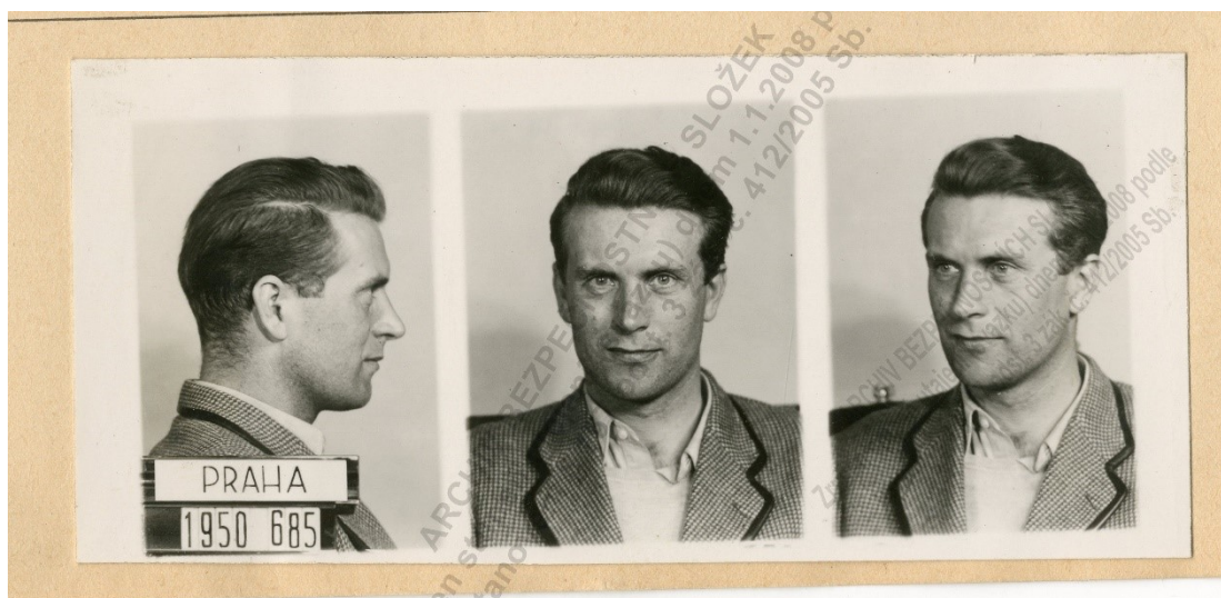
Bohumil Modrý, 24. září 1916 Praha – 21. července 1963 Praha (Obr. 2)

Jak už je v této práci mnohokrát řečeno, sport vždy částečně vstupoval do politického dění, obzvlášť pak v komunistické éře. Nicméně příklady z hokejového prostředí, které v této podkapitole budu popisovat, zle bez nadsázky zařadit do kategorie, kdy sport píše