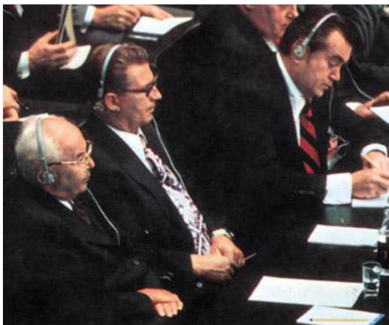
Československá delegace na Konferenci o bezpečnosti a spolupráci v Evropě (zleva: Gustáv Husák, Lubomír Štrougal, Bohuš Chřoupek)