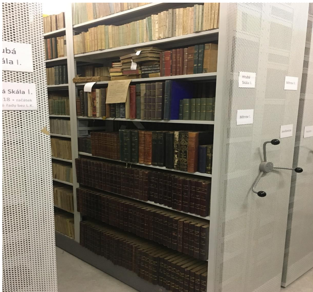
OBRÁZEK 1: MITROVSKÝ FOND