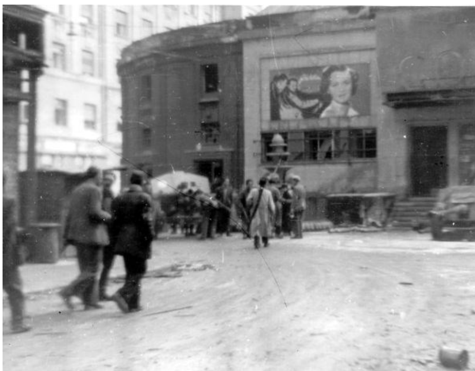
Ulice před kinem Corvin

( http://www.americanhungarianfederation.org/1956/photos.htm - 13. 7.2018)