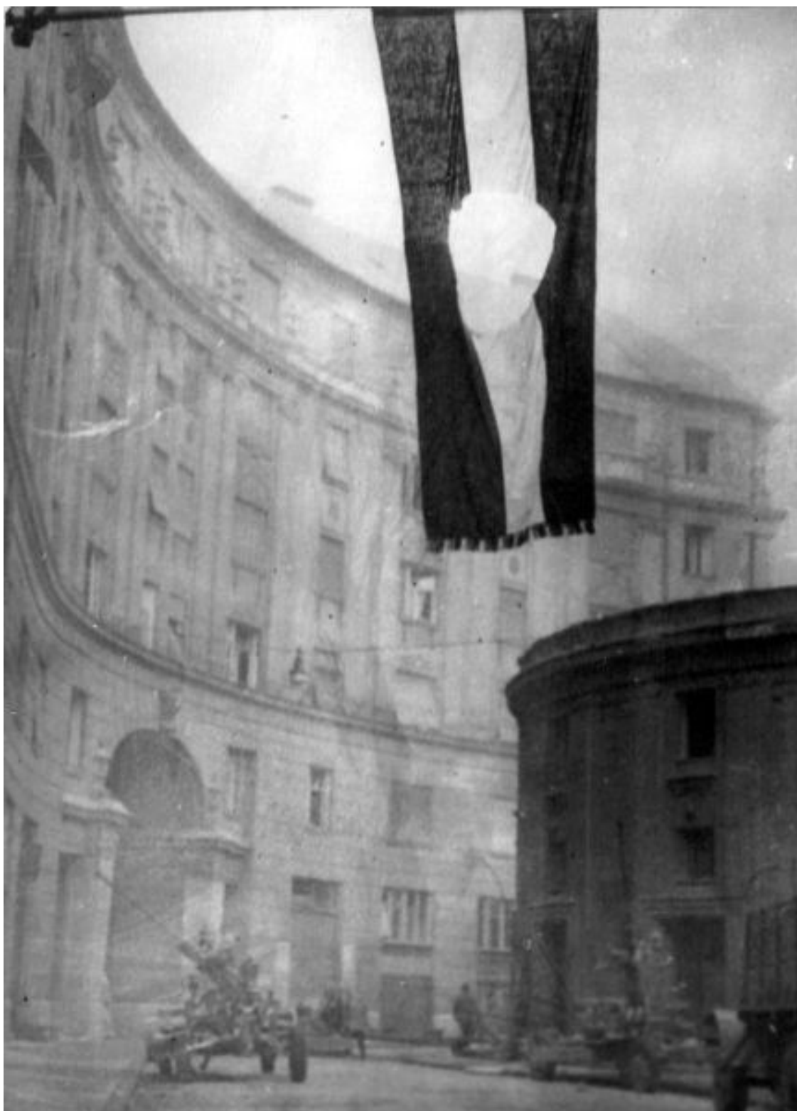
Budapešťská ulice s revoluční vlajkou

( http://www.americanhungarianfederation.org/1956/photos.htm - 13. 7.2018)