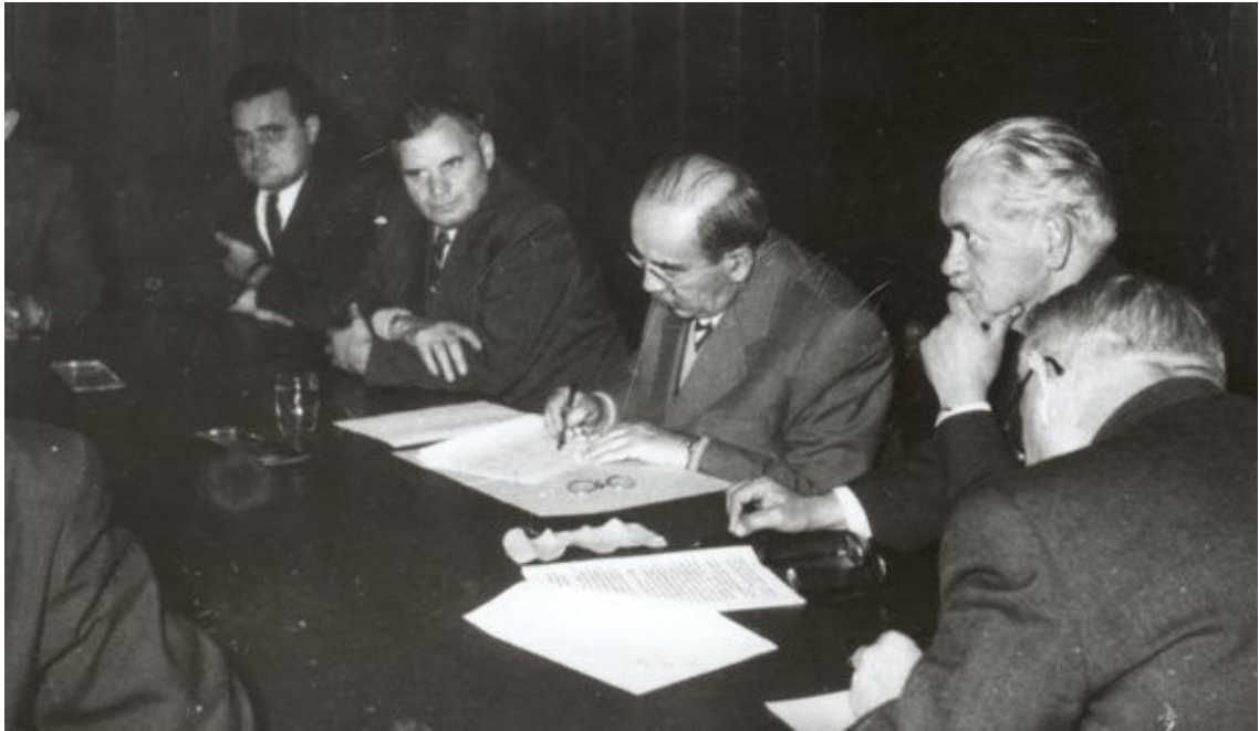
Imre Nagy s částí svého kabinetu

( http://www.americanhungarianfederation.org/1956/photos.htm - 13. 7.2018)