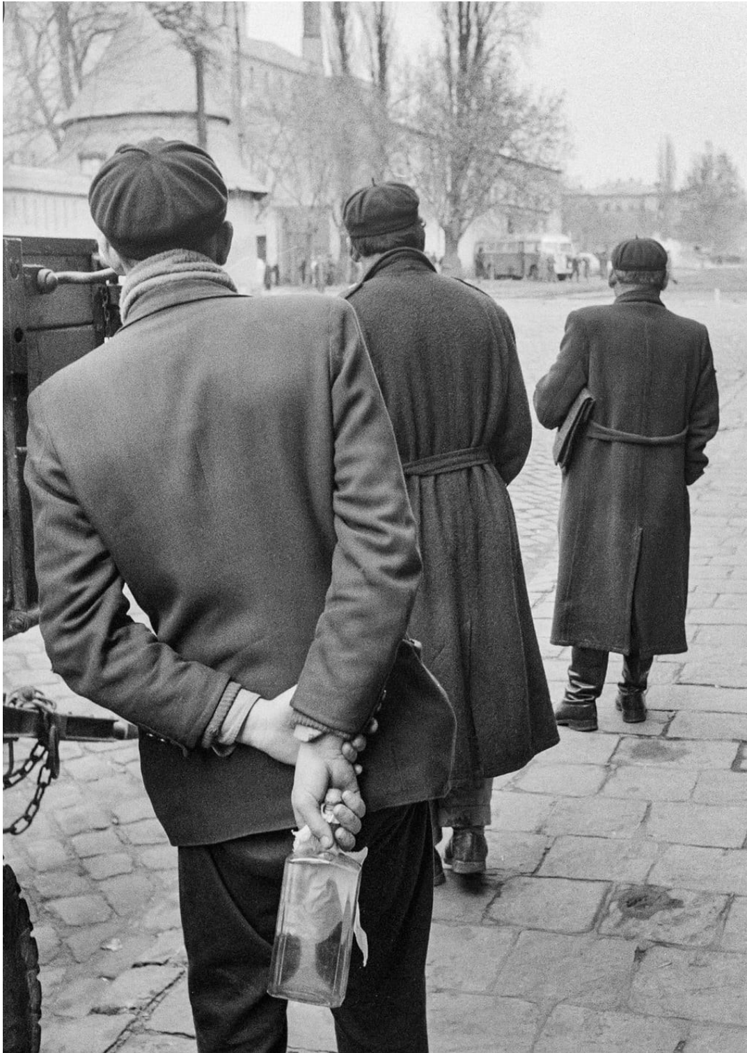
Povstalec se zápalnou lahví čekající na příležitost

( https://www.theguardian.com/world/gallery/2016/nov/10/1956-hungarian-revolution-in-pictures - 13. 7.2018)