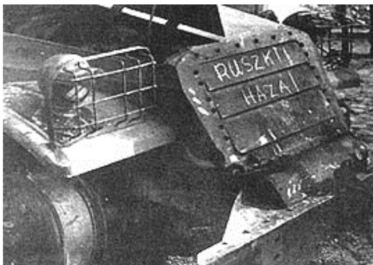
Rusové, běžte domů!

( http://www.americanhungarianfederation.org/1956/photos.htm - 13. 7.2018)