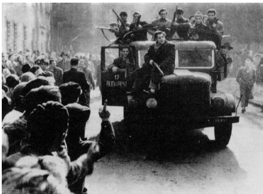
Povstalci na voze