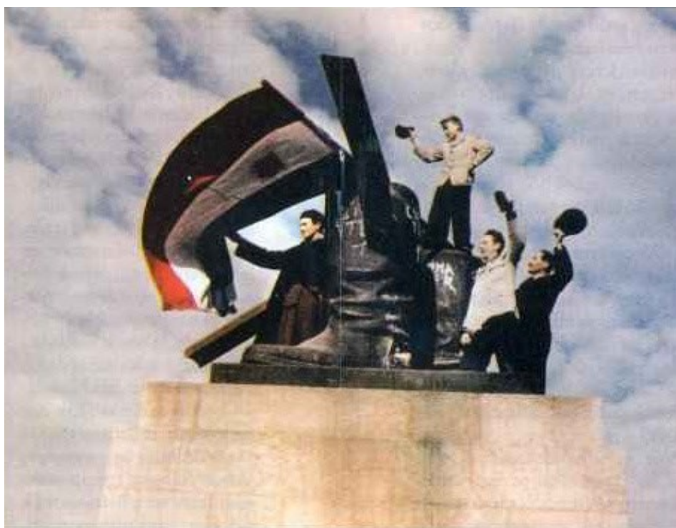
Povstalci u zbytků Stalinovy sochy

( http://www.americanhungarianfederation.org/1956/photos.htm - 13. 7.2018)