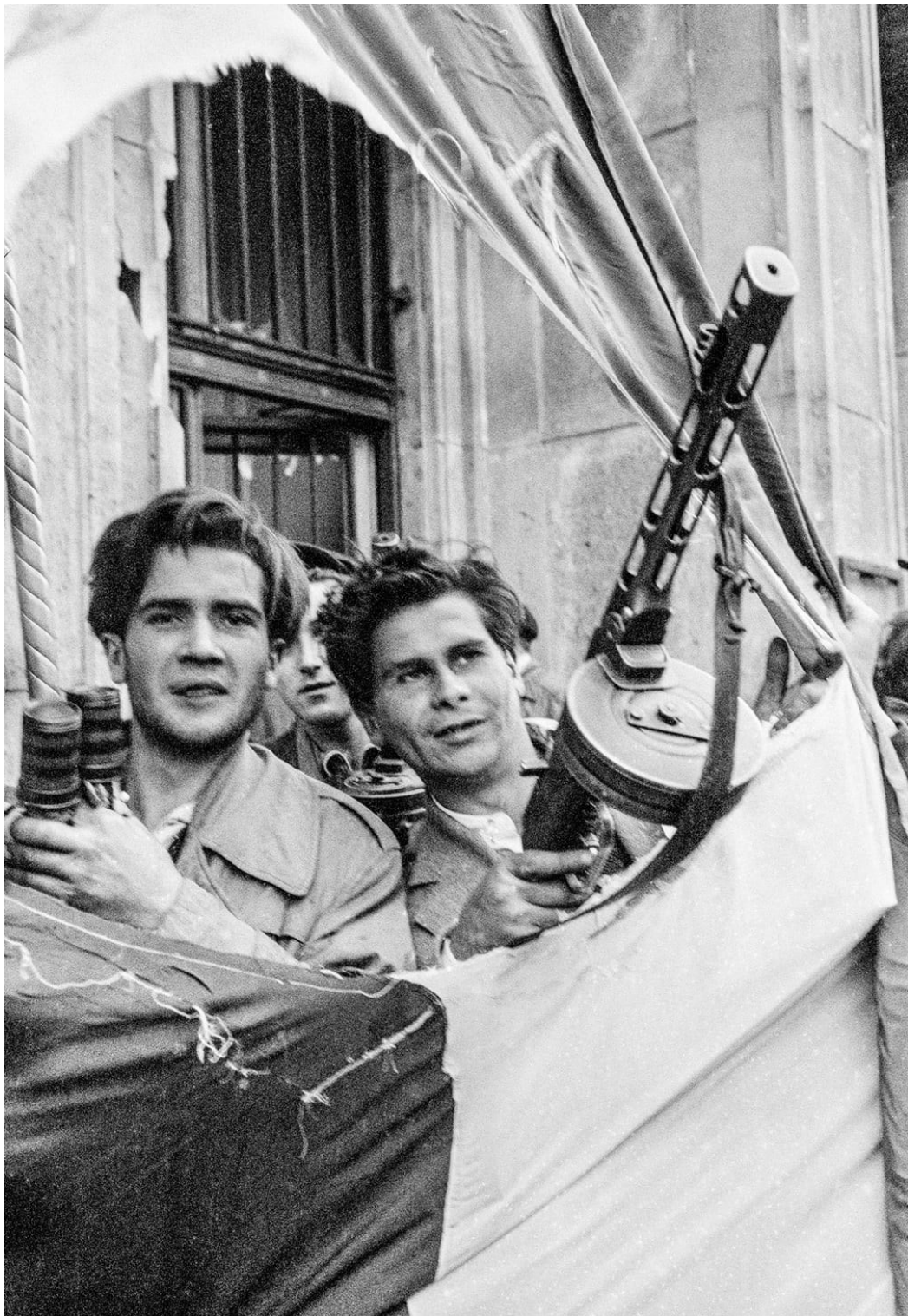
Povstalci stojící v maďarské revoluční vlajce

( https://www.theguardian.com/world/gallery/2016/nov/10/1956-hungarian-revolution-in-pictures - 13. 7.2018)