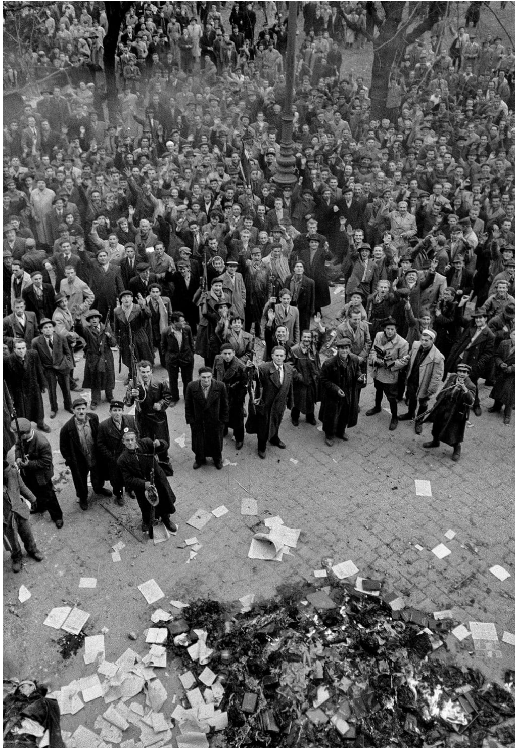
Pálení komunistických knih a fotografií

( https://www.theguardian.com/world/gallery/2016/nov/10/1956-hungarian-revolution-in-pictures - 13. 7.2018)