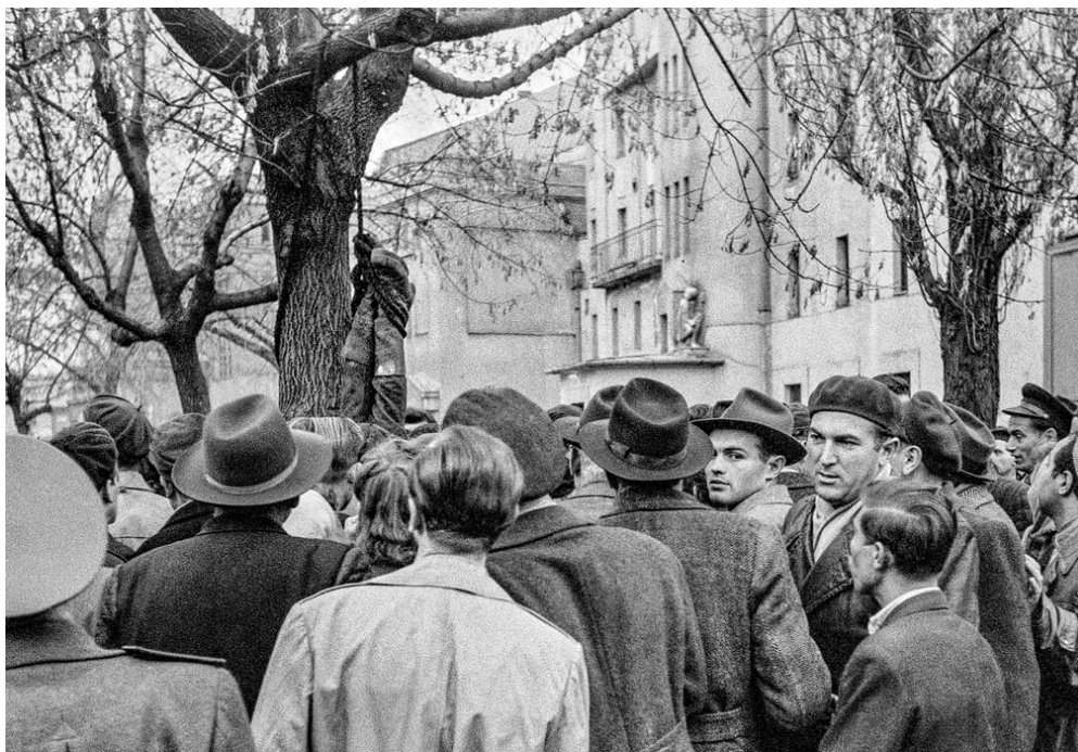
Skupina lidí kolem lynčovaného

https://www.theguardian.com/world/gallery/2016/nov/10/1956-hungarian-revolution-in-pictures - 13. 7.2018)