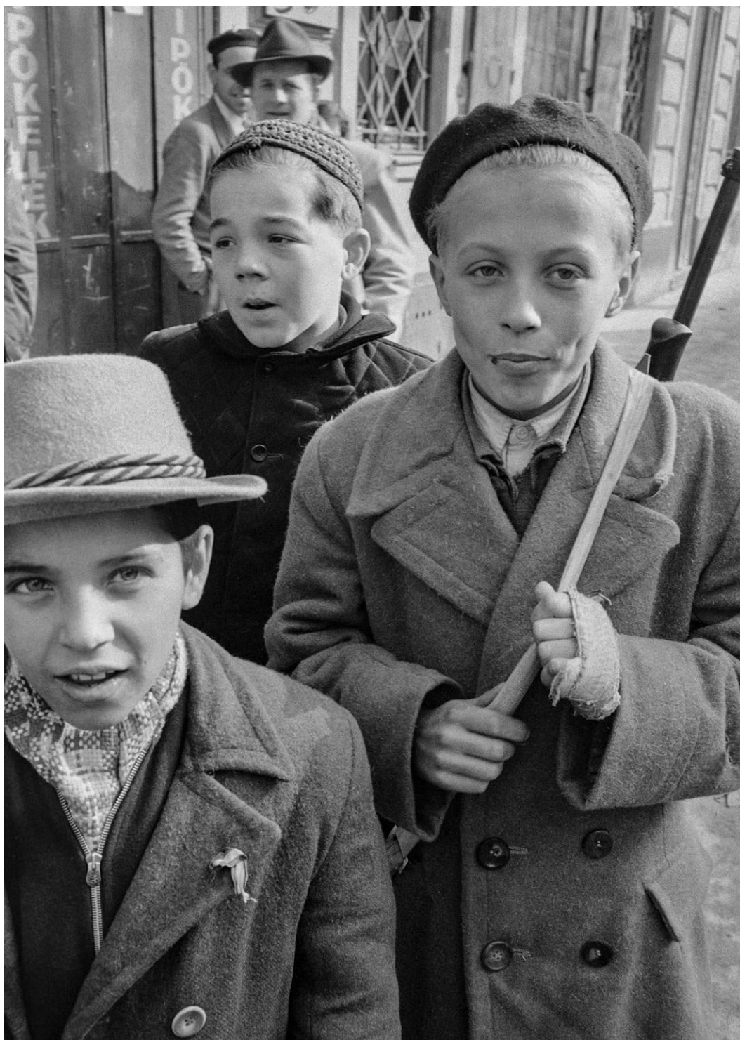
Děti se zbraněmi

( https://www.theguardian.com/world/gallery/2016/nov/10/1956-hungarian-revolution-in-pictures - 13. 7.2018)