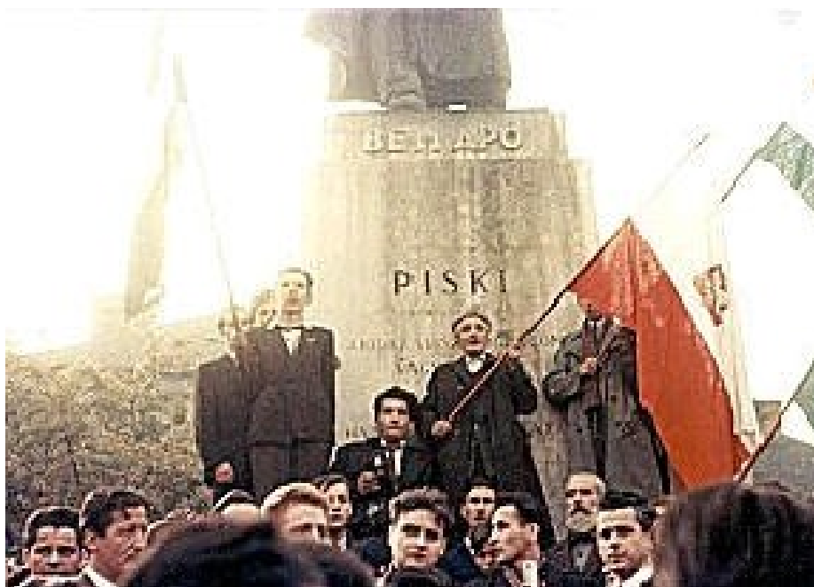
Studenti kolem sochy gen. Bema

( http://www.americanhungarianfederation.org/1956/photos.htm - 13. 7.2018)