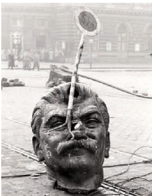
Hlava ze strhnuté Stalinovy sochy

( http://www.americanhungarianfederation.org/1956/photos.htm - 13. 7.2018)