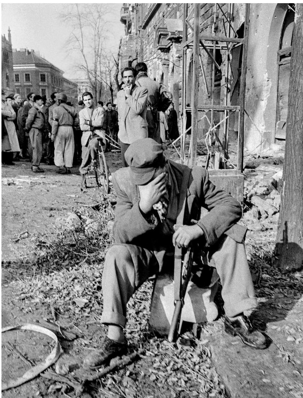
Jeden z povstalců v ulicích Budapešti