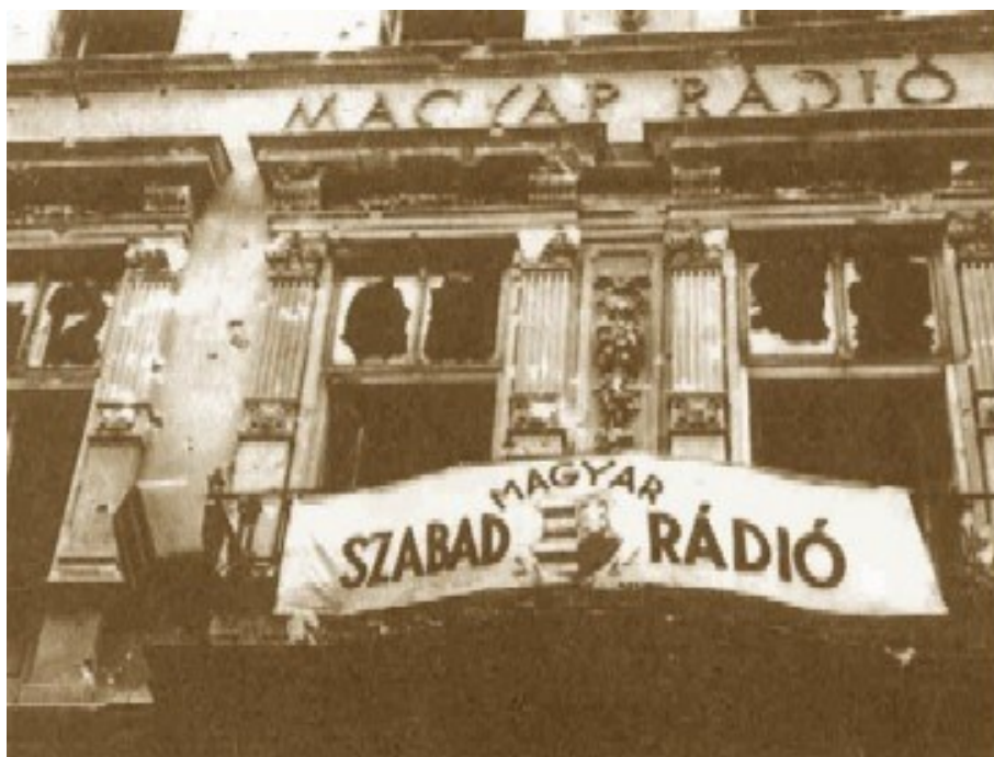
Svobodné maďarské rádio

( http://www.americanhungarianfederation.org/1956/photos.htm - 13. 7.2018)