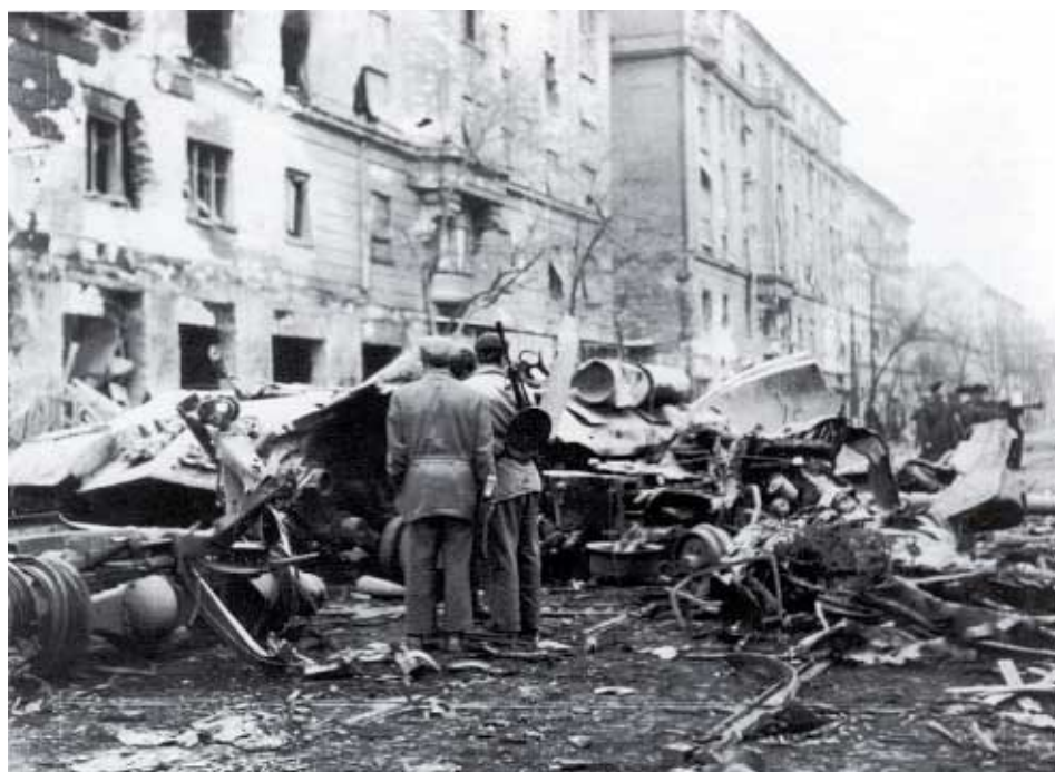
Barikády v Budapešti