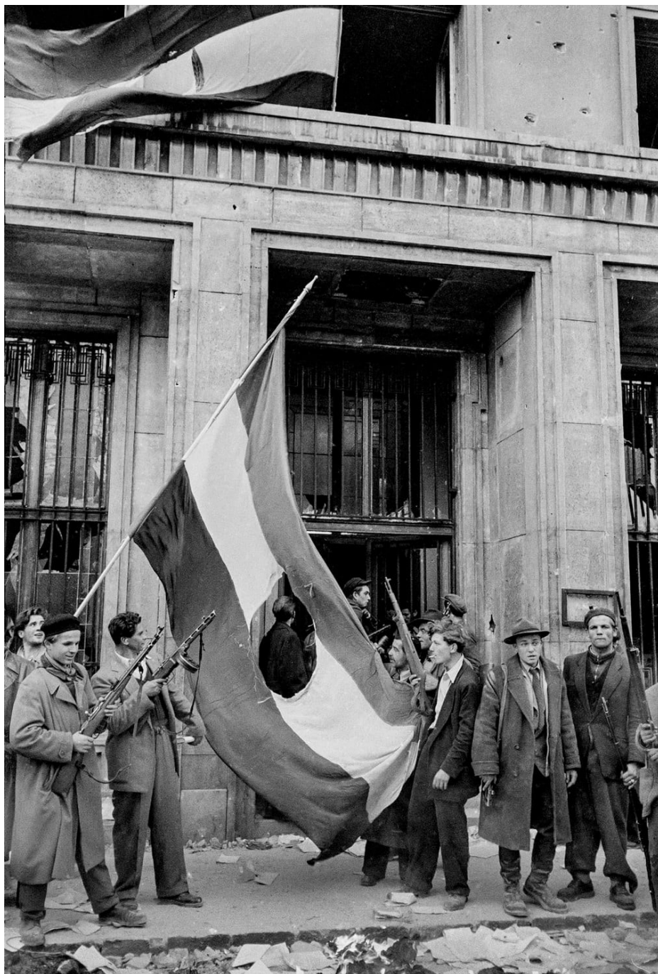
Povstalci s revoluční vlajkou