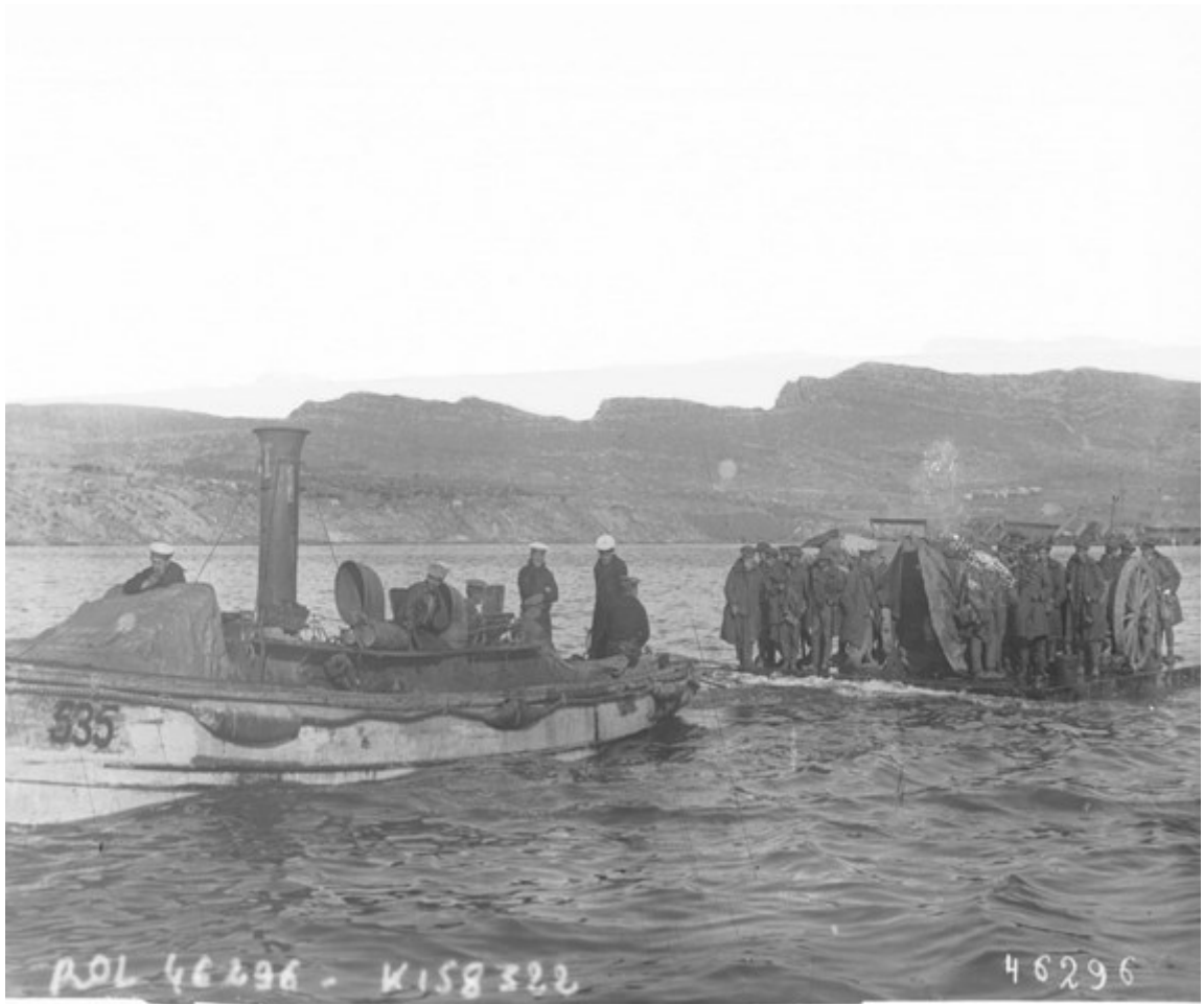
Příloha č. 5: Lednová evakuace jednotek z Gallipoli.