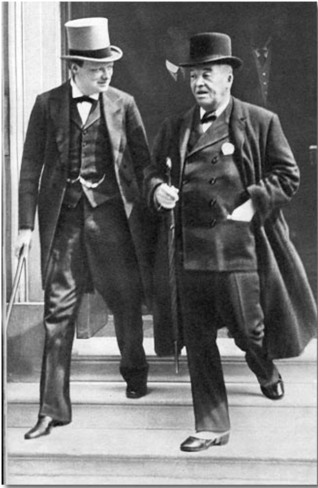
Příloha č. 1: Winston Churchill a admirál Fisher.