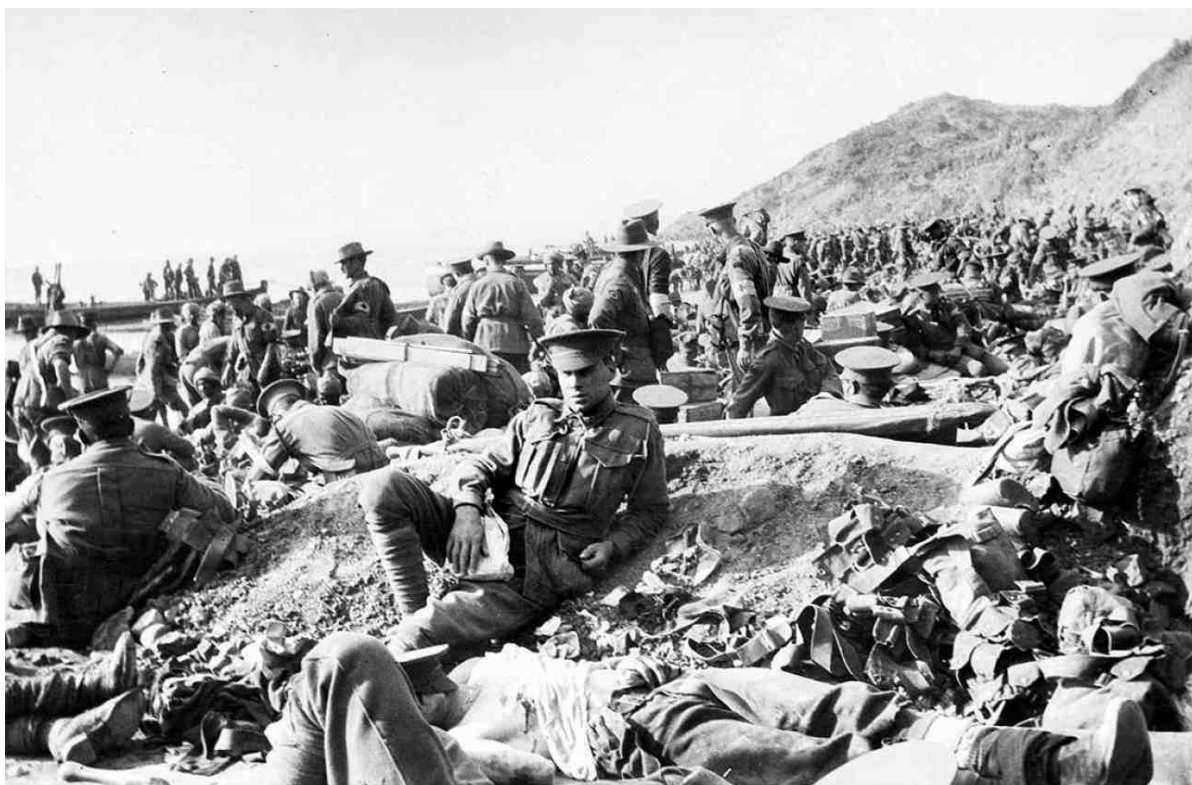
Příloha č. 4: ANZACS na jedné z vylodovacích pláží.