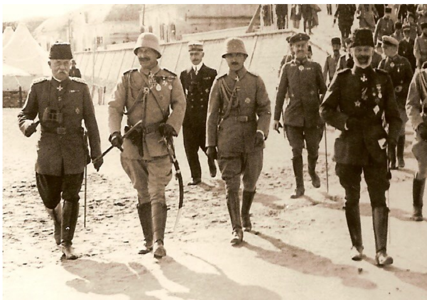
Příloha č. 3: Enver Paša a Vilém II. na Gallipoli.

Zdroj: https://en.wikipedia.org/wiki/Enver_Pasha [17. 07. 2019].