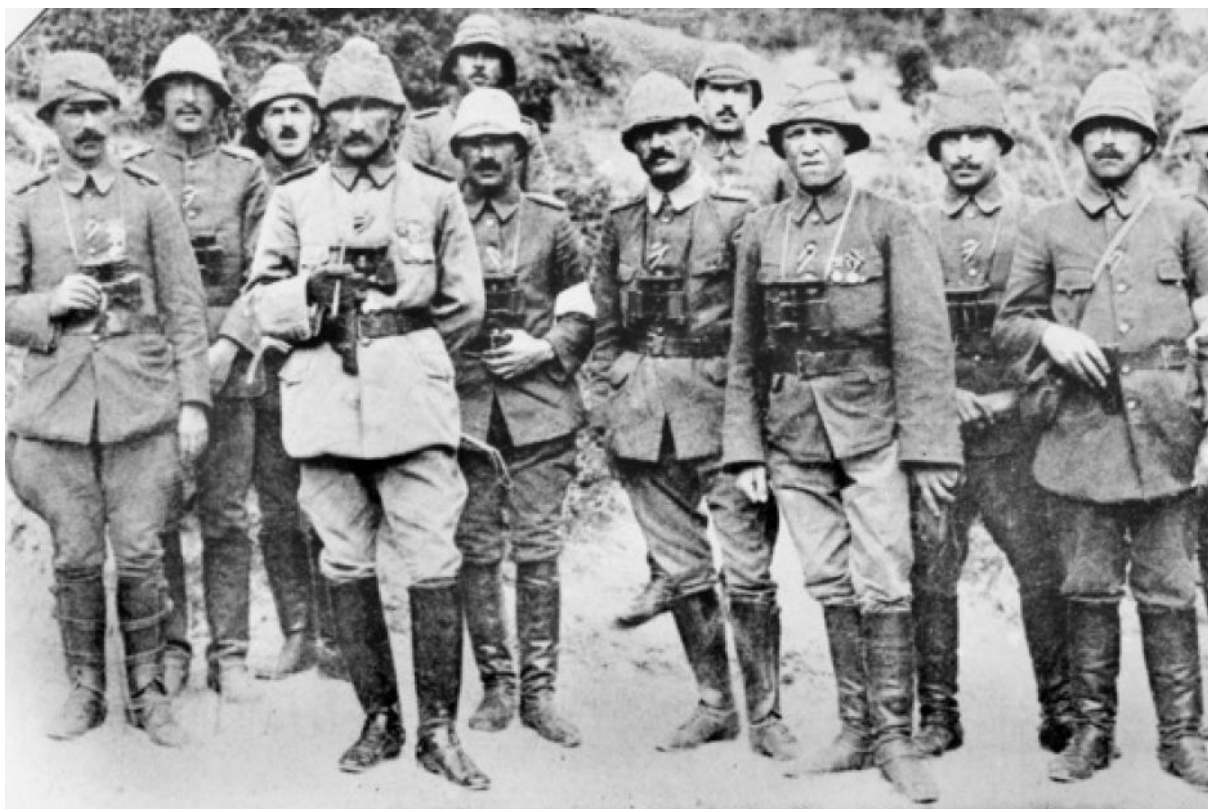
Příloha č. 6: Mustafa Kemal na Gallipoli.