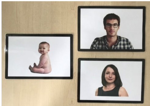
Obrázky osob použité k hodnocení aktivní a pasivní slovní zásoby