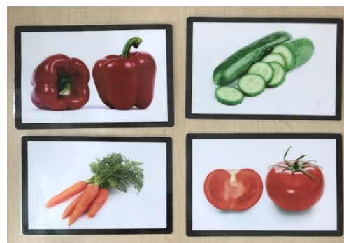
Obrázky ovoce a zeleniny použité k hodnocení aktivní a pasivní slovní zásoby