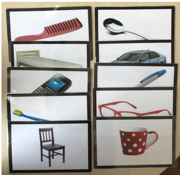
Obrázky použité k hodnocení schopnosti určit obrázek podle jeho použití