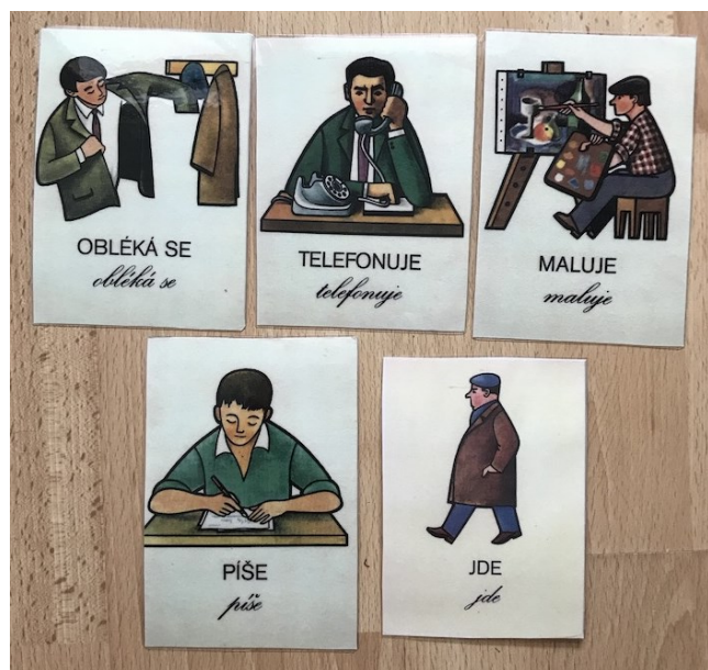
Obrázky z Obrázkového slovníku pro afatiky (Truhlářová M. 1973) použité k hodnocení schopnosti časování sloves