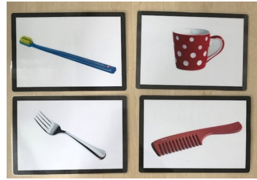
Obrázky nábytku a věcí denní potřeby použité k hodnocení aktivní a pasivní slovní zásoby