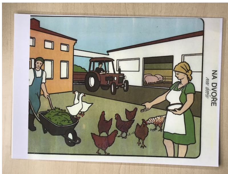
Obrázek z Obrázkového slovníku pro afatiky (Truhlářová M. 1984) použití k hodnocení schopnosti popsat obrázek