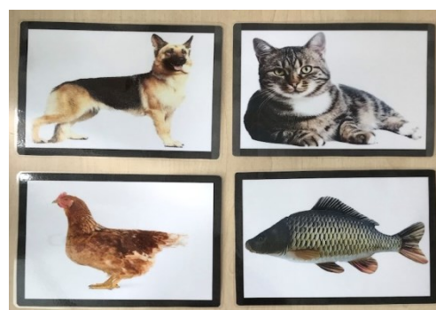
Obrázky jídla a zvířat použité k hodnocení aktivní a pasivní slovní zásoby