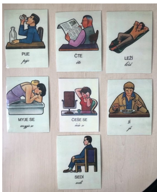
Obrázky z Obrázkového slovníku pro afatiky (Truhlářová M. 1973) použité k hodnocení schopnosti určit činnost na obrázku