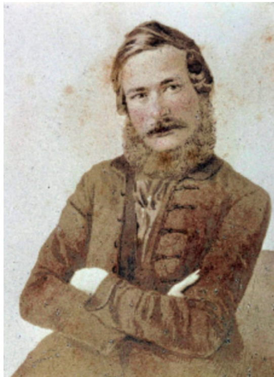
3. Bližšie nedatovaná daguerrotypická snímka L. Štúra z pozostalosti Jána Štúra.

https://www.noveslovo.sk/c/Dielo_pocta_a_portret_Ludovit_Stur_v_slovenskom_vytvarnom_umeni [cit. 2019-08-11]