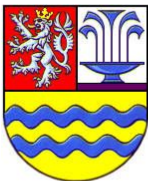
Příloha č. 1 Heraldický znak Toušeně