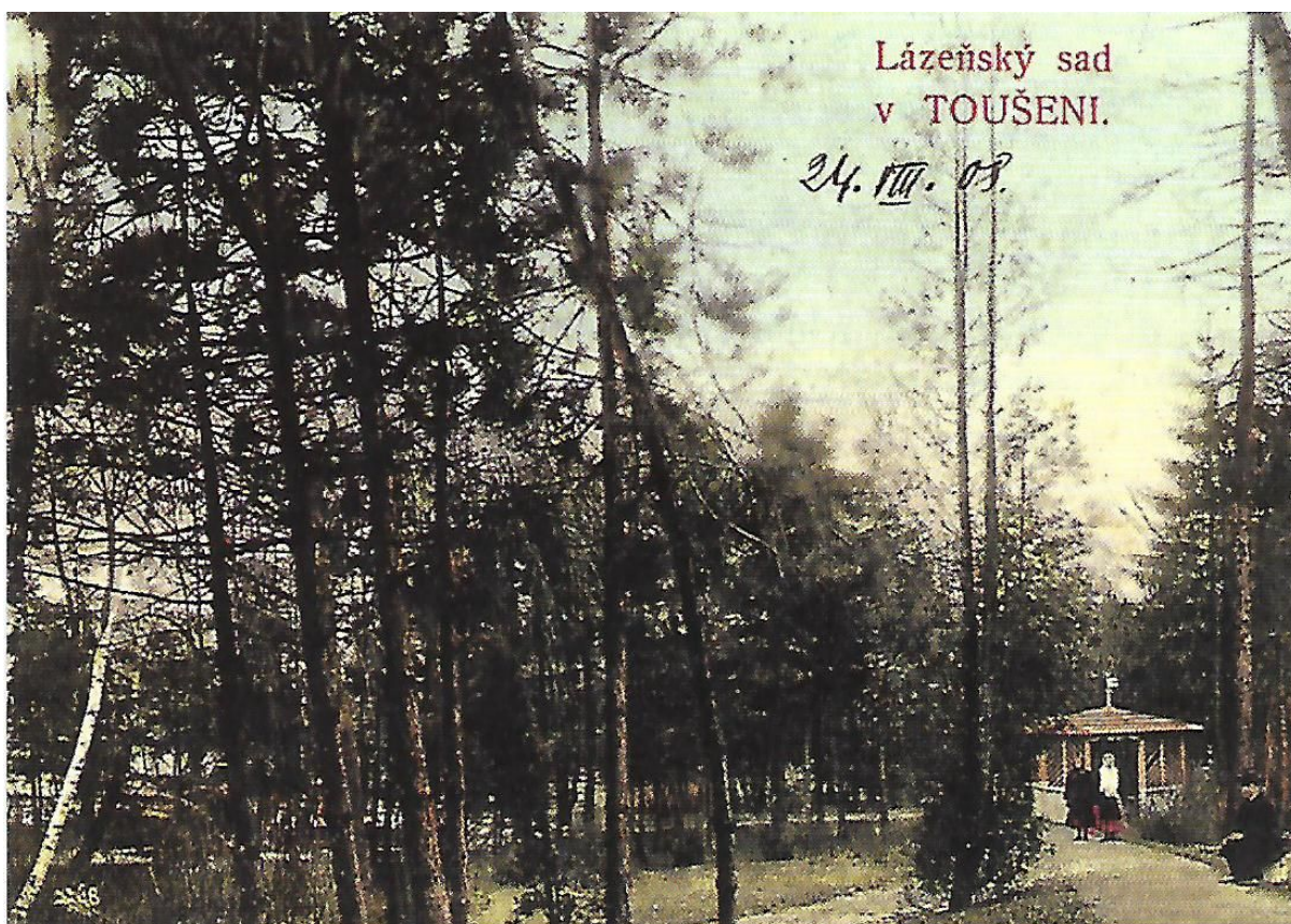
Příloha č. 4 Lázeňský park v roce 1908 (kolorovaná dobová pohlednice)