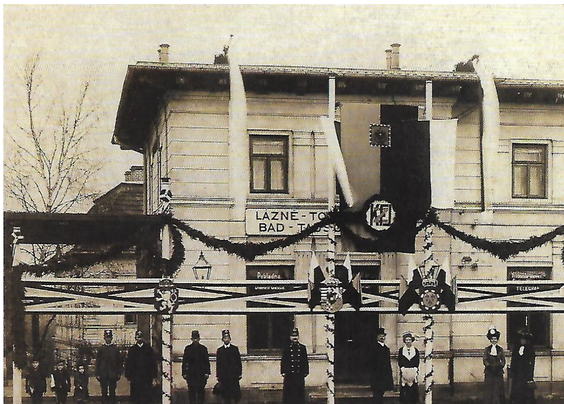
Příloha č. 9 Nádraží vyzdobené ku příležitosti příjezdu Karla I. a Zity (dobová pohlednice)