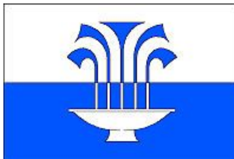
Příloha č. 2 Vlajka Toušeně