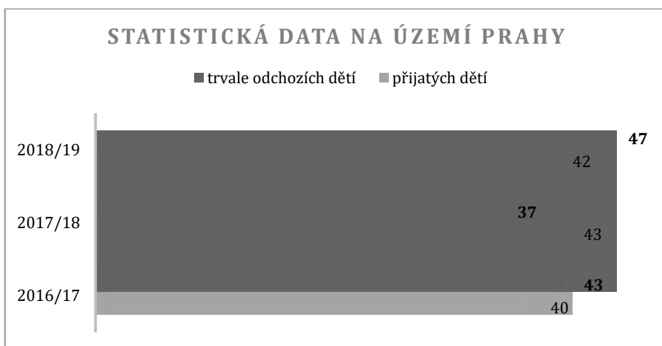
Obrázek 3: Graf statistických dat na území Prahy (Statistické ročenky, 2019)