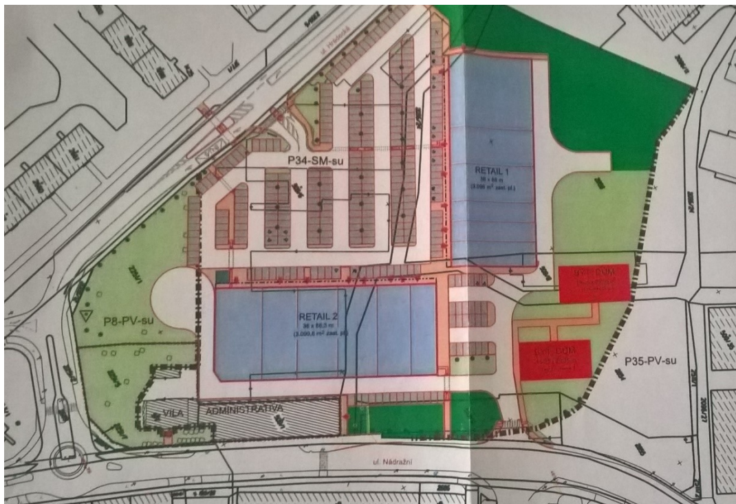
Příloha č. 7: Nový návrh OC (bez Kauflandu)