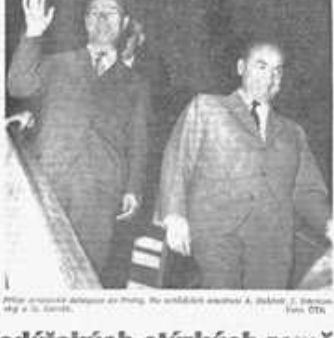
Delegace komunistů z Bělehradu v Praze...