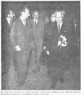
Na společných jednáních byra ÚV KSSS a předsednictva ÚV KSČ...