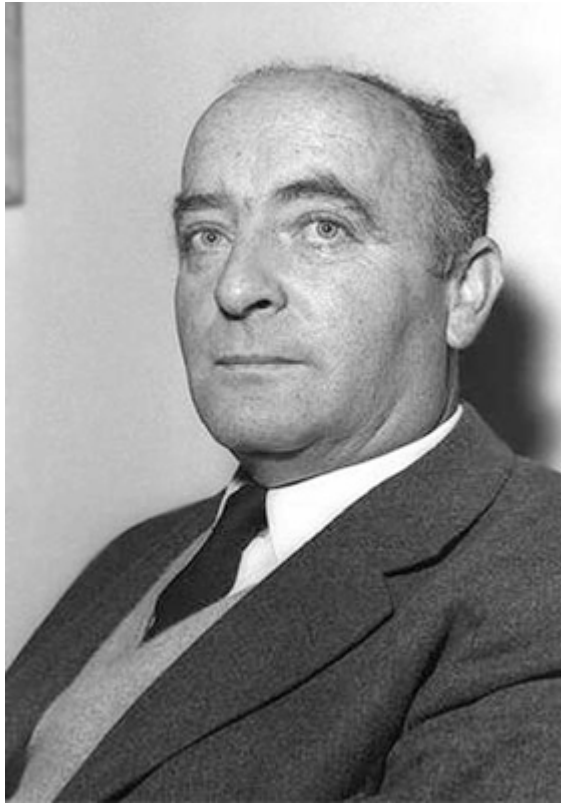
Ehud Avriel-Überall, izraelský vyslanec v Československu