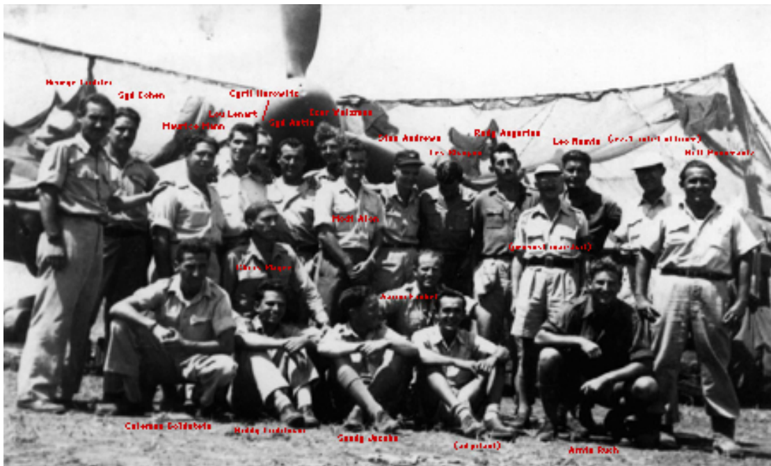
101. squadrona IAF (izraelského letectva)