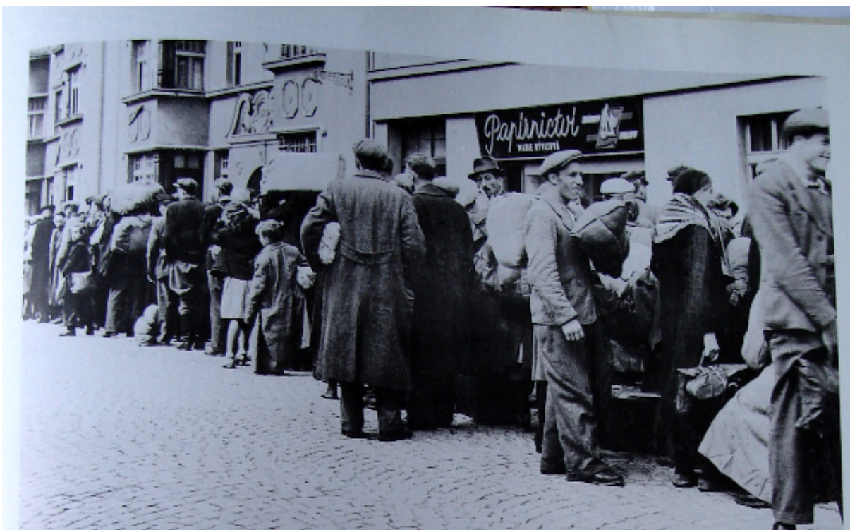
213 Čekání na vystěhovačské doklady u palestinského úřadu, 1946 214 Nastup do vlaku na cestu do Palestiny, 1946