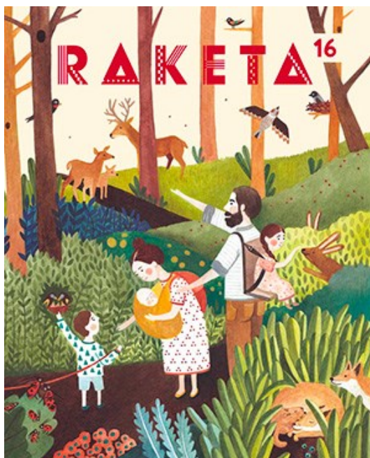
Obr. č. 3: Obálka časopisu Raketa, č. 16