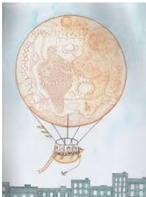
Obr. č. 10: Ilustrace z knihy Robinson