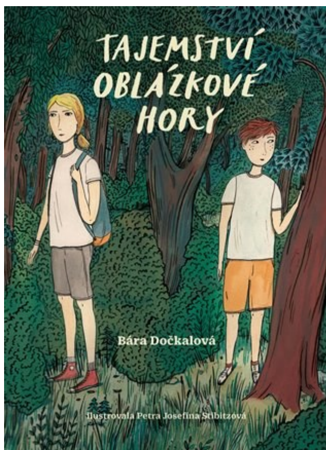
Obr. č. 8: Úvodní dvoustrana, Tajemství oblázkové hory