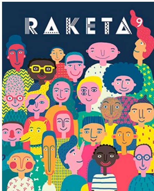
Obr. č. 2: Obálka časopisu Raketa, č. 9