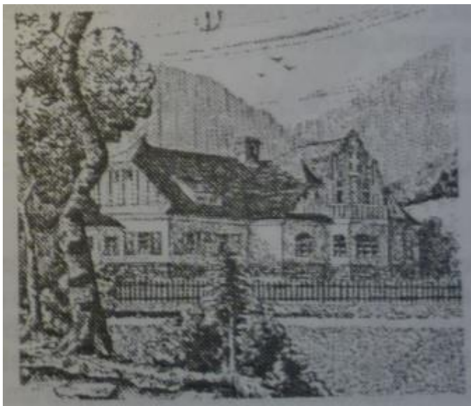
Obrázek 3: Léčebna Křížového spolku Velké Kunčice pod Radhoštěm (Folprecht, 1993)