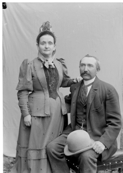
Z fotografie tohoto staršího manželského páru, z níž je navzdory pozici patrné dominantní postavení muže, nedat., patrně závěr 19. století