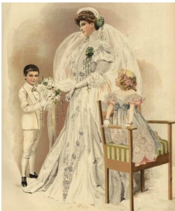
Svatební róba podle časopisu Nové pařížské módy , roč. 11, č. 4, 15. 2. 1905, barevná příloha, zdroj: http://kramerius4.nkp.cz .