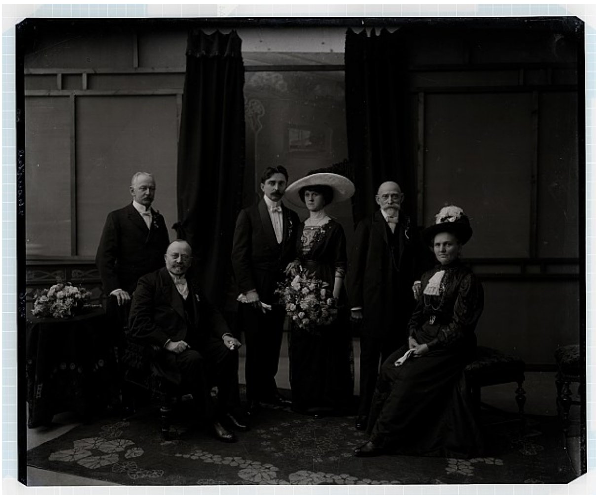
Skupinové svatební foto, 1912