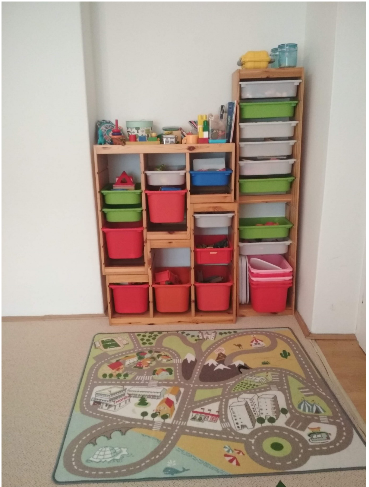
Příloha 5 Fotografie místnosti, ve které byl realizován sběr dat.