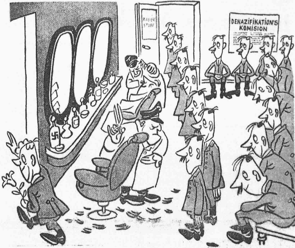
— Další pán na holení