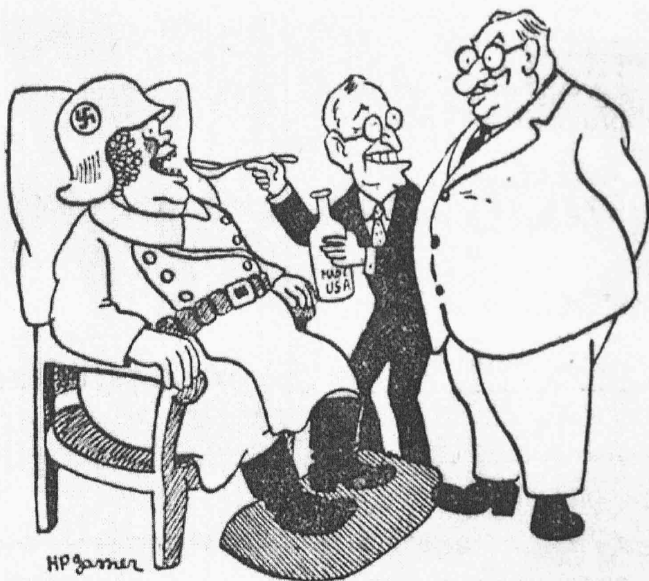
— Drahoušek, už zase dostává barvu Lettres françaises