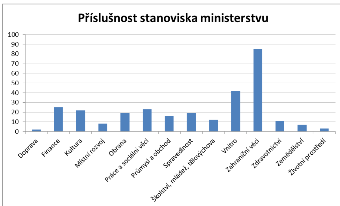
Graf 1 Tématická příslušnost stanovisek hnutí SPD k ministerstvům.

Jak lze vyčíst z grafu 1, nejvíce se témata řešená hnutím SPD dotýkala problematiky v gesci Ministerstva vnitra nebo Ministerstva zahraničních věcí. Důvod, proč řešená témata SPD přísluší zejména těmto ministerstvům, lze vyvodit z grafu 2. Mezi tři nejdominantnější témata řešená ve stanoviscích SPD totiž patří Evropská unie, migrace a zahraniční politika. Součástí plánů zahraniční politiky SPD je také větší spolupráce států na úrovni Visegrádské čtyřky.