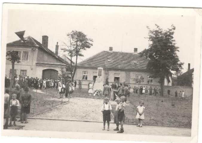
Obr. 3.3 Pietní akt padlým d'áblickým bojovníkům v roce 1946

Dne 3. září 1948 umírá prezident Edvard Beneš. Na d'áblické škole se ale žádná smuteční slavnost nekonala, v kronice je tato událost pouze zmíněna. Ve dnech 5. a 14. března umírá nejprve J.V. Stalin a po devíti dnech také prezident Klement Gottwald. Na škole byla uspořádána smuteční tryzna a také tisíce Pražanů se shromáždilo na Václavském náměstí. V novinách Rudé právo dne 10. března byla napsáno: „ V hlavním městě republiky Praze, v krajských a okresních městech, v halách továren, v jednotných, v jednotných zemědělských družstvech, na státních statcích, v státních traktorových stanicích, na školách a v kasárnách shromáždily se nepřehledné davy našich občanů, spjatých nejvroucnějšími city lásky a oddanosti k našemu osvoboditeli, velkému učiteli a věrnému příteli národů. “ 211 V době smrti Antonína Zápotockého 13. listopadu 1957 byl provoz školy nepřerušeno, pouze řídící učitel přednesl proslov v rozhlase. 212