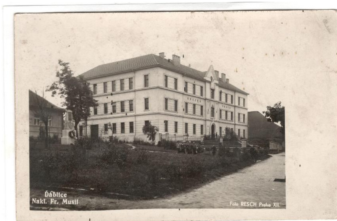
Obr. 3.2 Obecná škola v Ďáblicích

O letních prázdninách v roce 1947 byla ve škole zřízena tělocvična, která také sloužila jako přednáškový sál a v něm bylo také vytvořeno školní jeviště, které bylo v této době ve školách ojediněným vybavením. 70 V roce 1952 byla uvedena do provozu školní kuchyň a jídelna, ve které se mohlo stravovat sto dětí. 71 V roce 1956 byla provedena poslední úprava budovy na dřevěné škole a sice přístavba dvou dalších tříd, které pomáhali stavět samotní žáci. 72