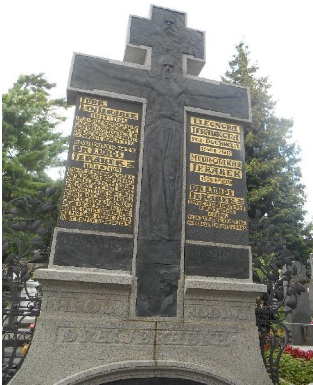
Příloha 9: Rodinná hrobka. Hřbitov sv. Matěje, Praha – Dejvice, autor: Helena Poche