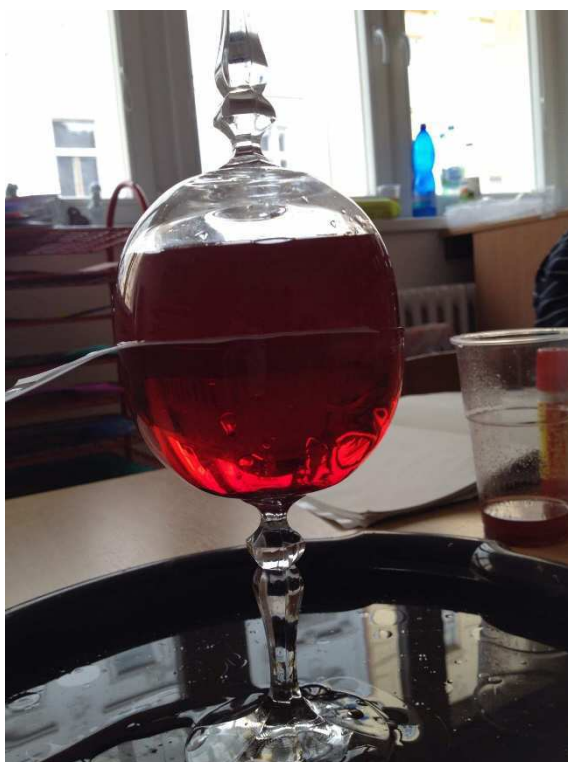
Obrázek 11 pokus č. 2 Výměna oleje a vody - hustota látek