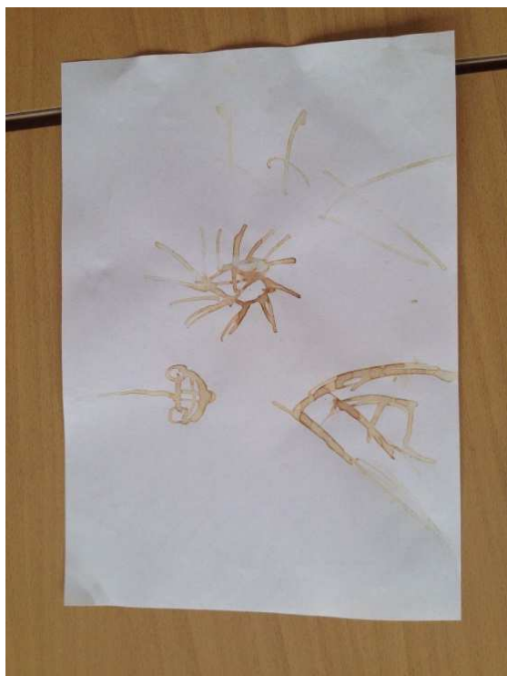
Obrázek 7 výsledek pokusu č. 4 Tajné písmo