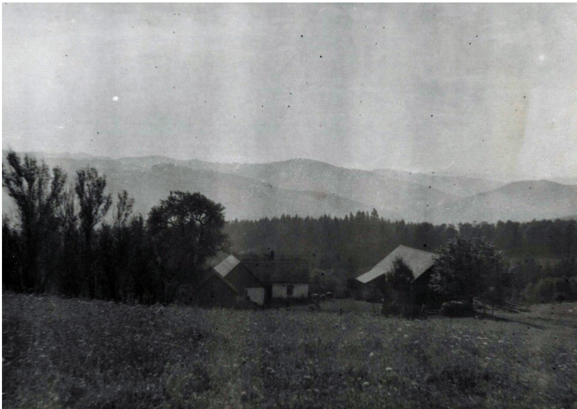
Obrázek 2: Paseka U Malinů na rozhraní katastrů obcí Pržno a Ratiboř, kde Jerry často pobýval.

jsme jednotlivé organizováni pro celý náš kraj. Jerison bydlel u Malinů 131 na pasekách. Tam jsem kolikrát v noci docházel na porady. Dával jsem s praporčíkem 132 informace Jerimu kde je třeba co dělat, hlavně jsme ho informovali o lidech udavačích a kolaborantech. Tyto, Jeri vyhledával a čistil kraj od škůdců. 133