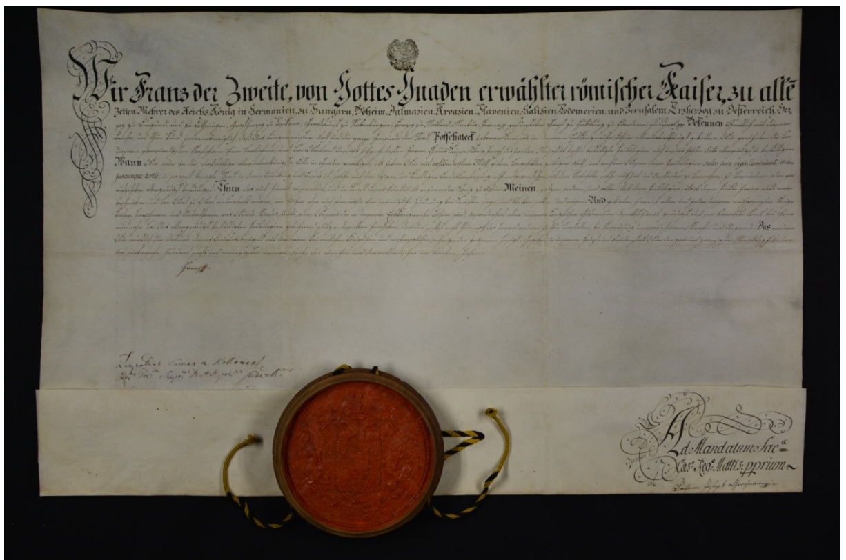
Obrázek 5 – Ukázka listiny 20