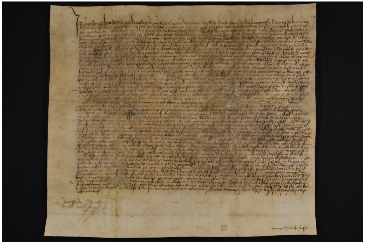
Obrázek 3 – Ukázka listiny 7