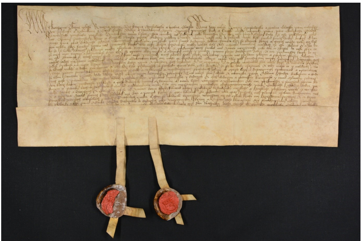
Obrazek 2 – Ukázka listiny 2