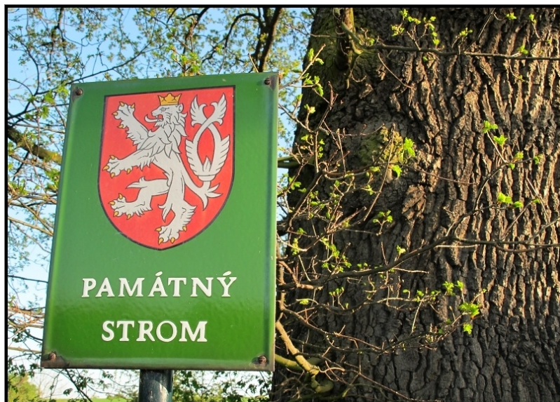
Obrázek č. 6