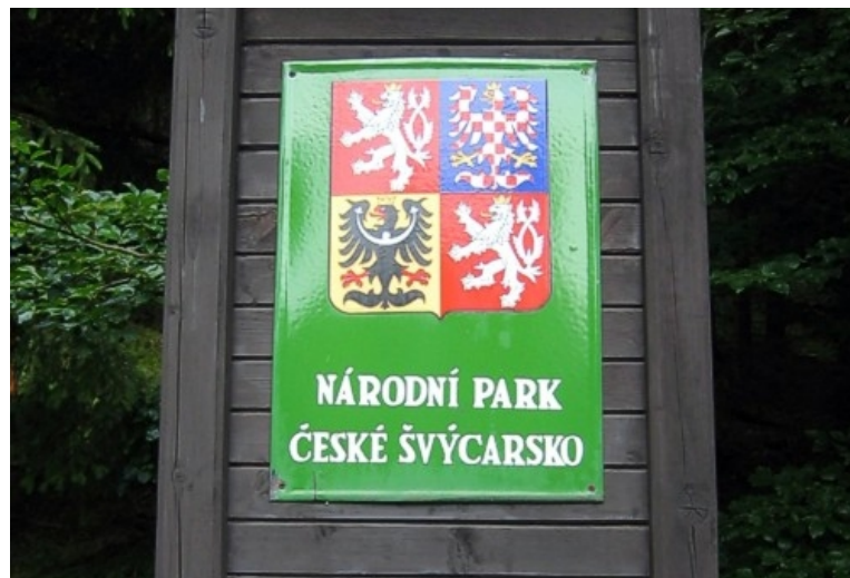
Obrázek č. 5

Tabule národního parku používaná u vstupů do něj na cestách.