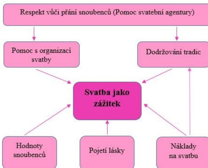
Obrázek 2: Schéma nově vytvořené teorie

Byť bývá časté užití „jevu“ z paradigmatického modelu za centrální kategorii v selektivním kódování, jak je z obrázku II zřejmé, zvolila jsem vlastnost „Svatba jako zážitek“ za tuto centrální kategorii, neboť právě zážitek byl v souvislosti se svatbou páry nejčastěji akcentován.