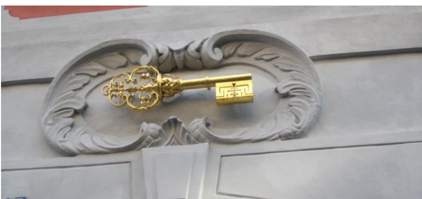
Obrázek 12 – Dům U zlatého klíče - Nerudova ulice 27/243, Malá Strana