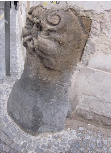
Obrázek 5 – Pražský maskaron