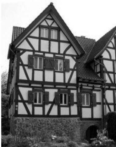
Obrázek 7 – Hrázděný dům