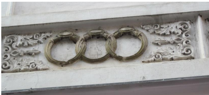
Obrázek 13 – Dům U tří zlatých prstenů - Mostecká ulice 20/45, Malá Strana