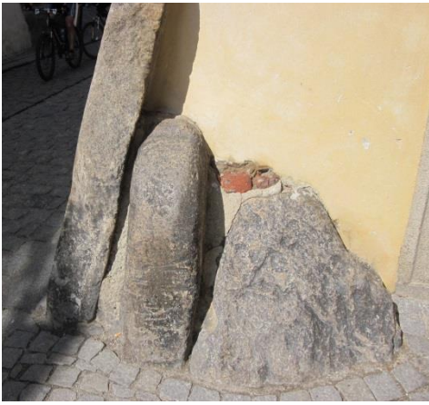
Obrázek 4 – Sdružené patníky v Českém Krumlově, zdroj: archiv autorky