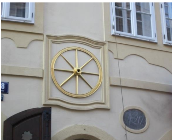
Obrázek 10 – Dům U zlatého kola - Nerudova ulice 28/217, Malá Strana, zdroj: archiv autorky