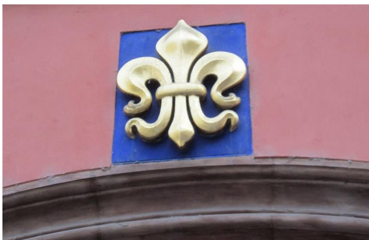
Obrázek 14 – Dům U zlaté lilie - Malé náměstí 12/458, Staré Město