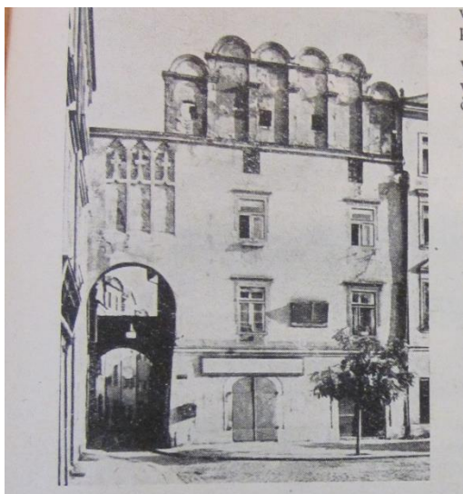
Obrázek 8 – Atika, Pardubice – dům čp. 116 zvaný Wernerův, zdroj: HAAS, Felix. Český měšťanský dům pozdní gotiky a renesance . In: Sborník Vysokého učení technického v Brně, 1964, č. 2-3, s. 109.