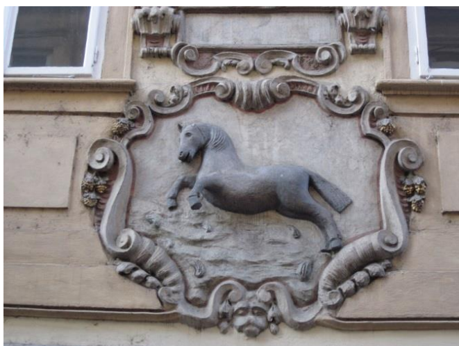
Obrázek 16 – Dům U černého koníčka – Prokopská 10/297, Malá Strana, zdroj: archiv autorky