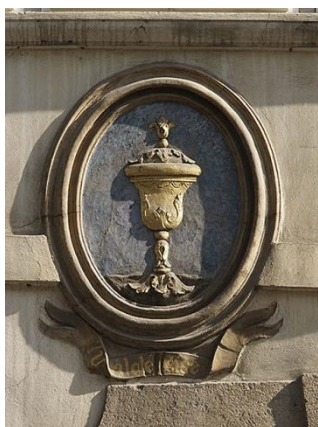
Obrázek 9 – Dům U zlaté číše - Nerudova ulice 16/212, Malá Strana, zdroj: archiv autorky