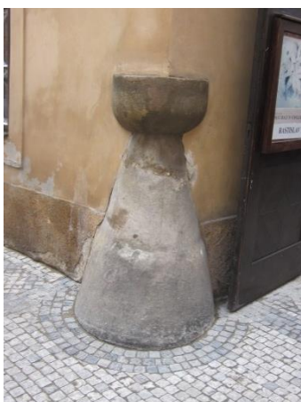
Obrázek 6 – Patník ve tvaru kalichu