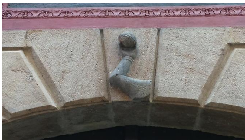
Obrázek 15 – Dům U Vořechovských – Liliová ulice 219, Staré Město