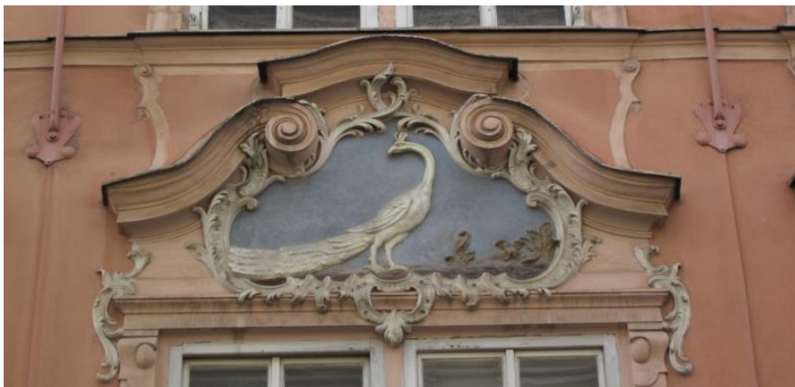
Obrázek 11 – Dům U bílého páva - Celetná ulice 10/557, Staré Město