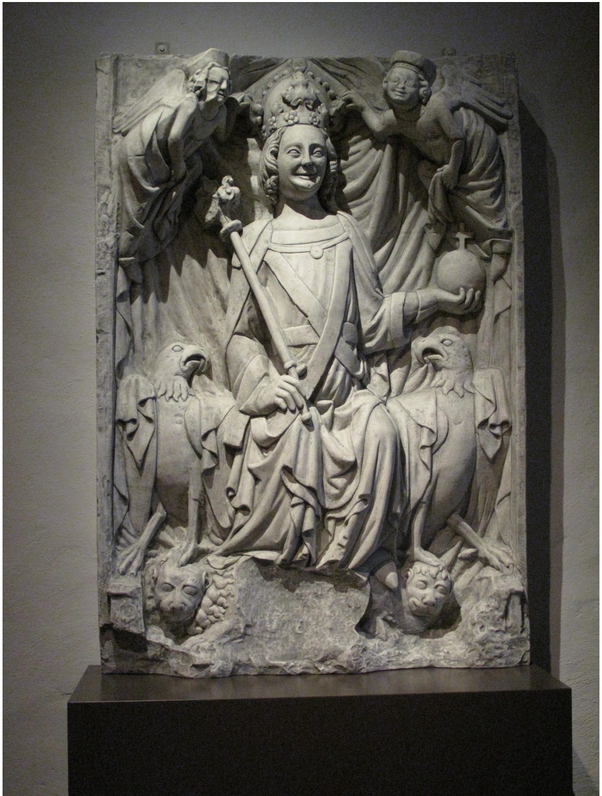
Reliéf zobrazující Ludvíka Bavora