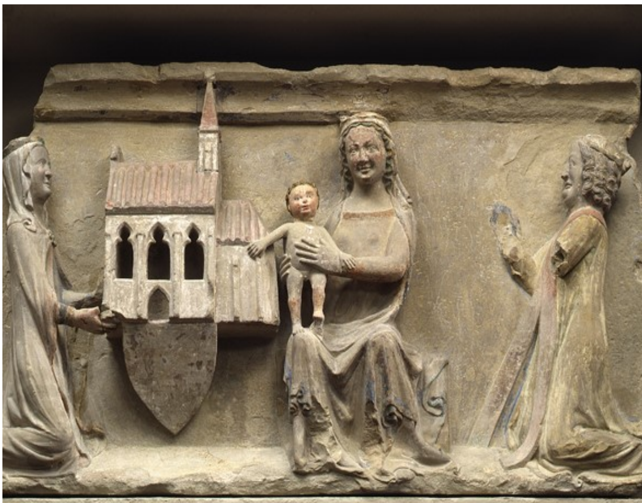
Klečící Ludvík Bavor jako donátor, Laurentiuskapelle München