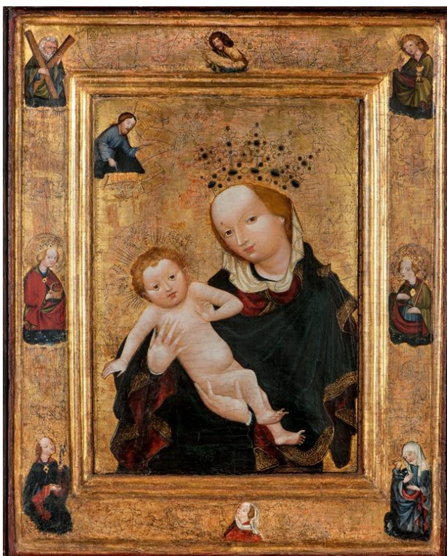
[I. 2.] Madona / Veraikon od sv. Tomáše v Brně, neznámý mistr, kolem 1420. Brno, Moravská galerie v Brně, inv. č. A 1721