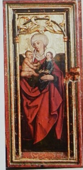
Oltář z Blanska (vnitřek skříně), Alšova jihočeská galerie, Hluboká nad Vltavou