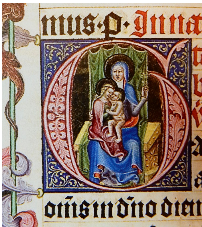
[III. 3.] Olomoucký misál Jana ze Středy, sv. Anna Samotřetí (fol. 165v), Čechy, 1355-1365. Praha, Archiv Pražského hradu, fond Metropolitní kapitula u Sv. Víta, Kapitulní knihovna, cim. 6