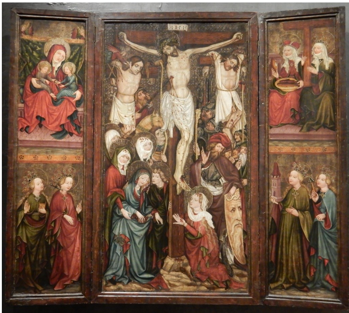
[I. 3.] Oltář Reininghausův, český mistr, kolem 1430. Praha, Národní galerie v Praze, inv. č.: O 1570, O 1571, O 1572