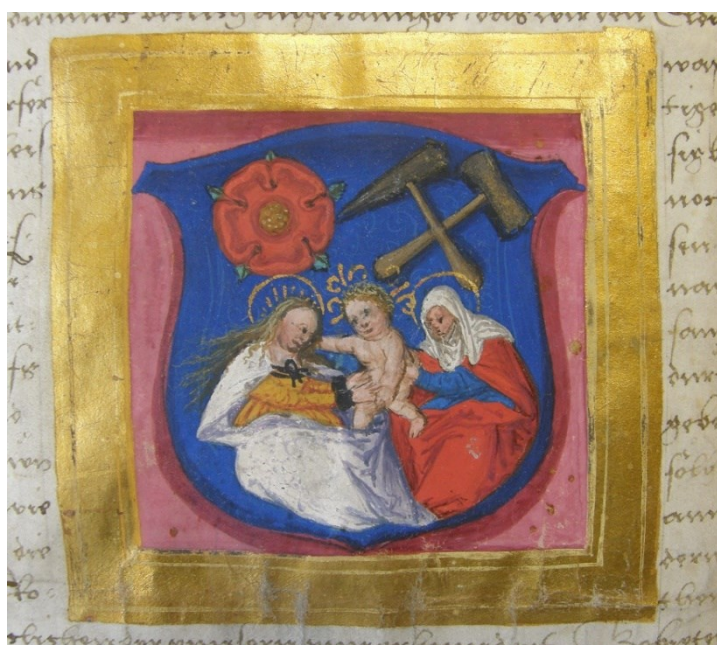
[III. 9. a] Detail: Horní privilegium Ludvíka Jagellonského ze dne 20. 1. 1526 pro město Český Krumlov, sv. Anna Samotřetí, Čechy, 1526. Český Krumlov, Státní okresní archiv Český Krumlov, K - 1, Listina - horní privilegium Ludvíka Jagellonského pro město Český Krumlov ze dne 20. 1. 1526, vystavena v Budíně, i. č. 109