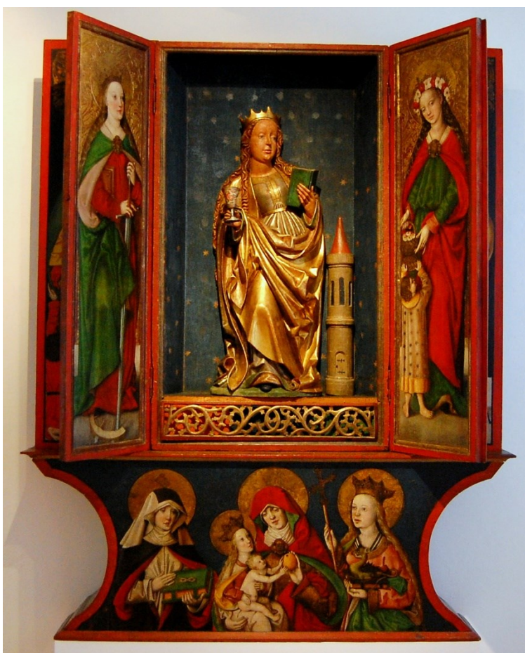
[I. 16.] Oltář sv. Barbory ze Želiny, Hans Hesse a dílna, sochy Freiberk, po 1524. Chomutov, Oblastní muzeum v Chomutově, inv. č.: O 996-1002, Plk 121