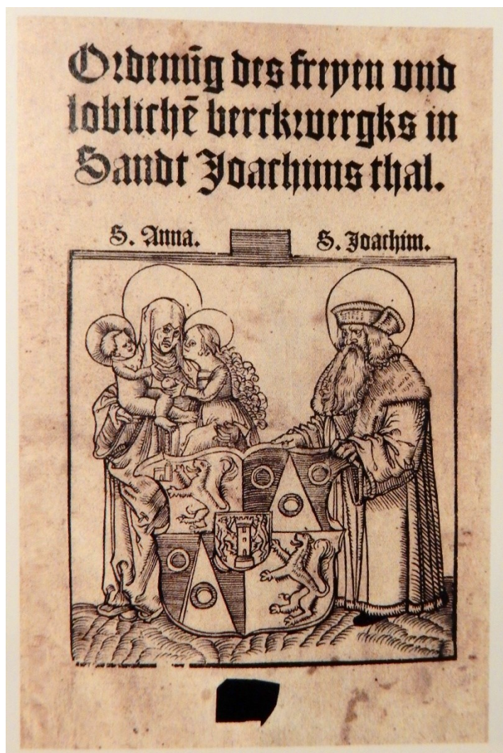
[III. 10.] Jáchymovský horní řád, sv. Anna Samotřetí, Lipsko, tiskař Valentin Schuman, 1518. Zámrsk, Státní oblastní archiv v Zámrsku, fond Rodinný archiv Šliků, inv. č. 679