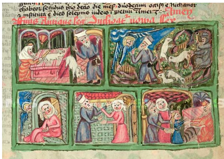
[III. 8.] Bible husitská, příběh sv. Jáchyma a sv. Anny: Obětování Jáchyma v chrámu, Zvěstování Jáchymovi, Zvěstování Anně, Setkání sv. Jáchyma a sv. Anny u Zlaté brány, Obětování Panny Marie (fol. 543r); Čechy (Praha ?), 1441. Praha, Národní muzeum v Praze, Knihovna národního muzea v Praze, XVIII B 18