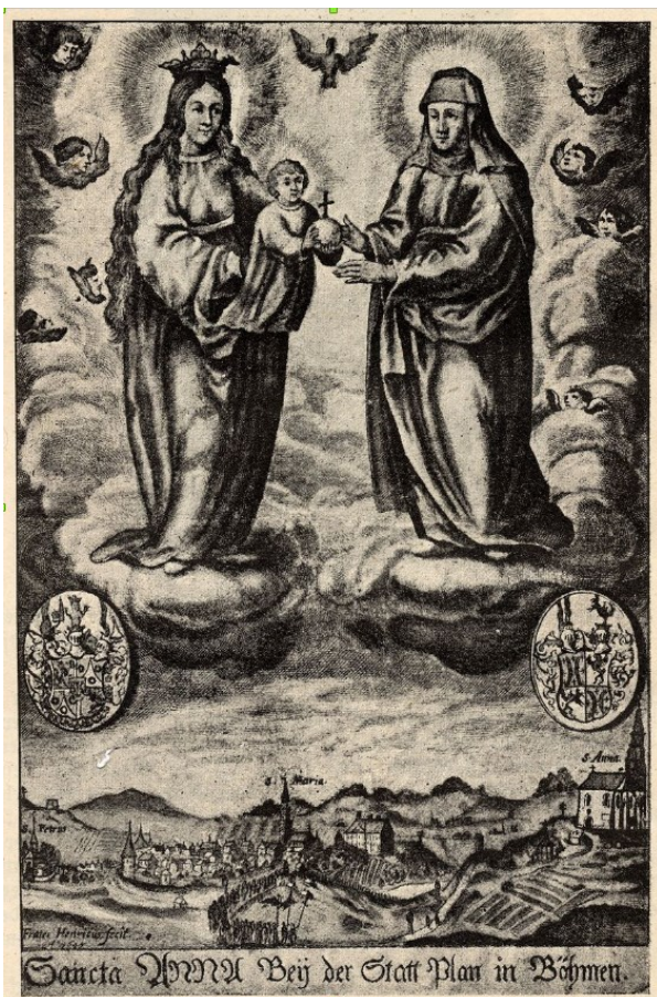
[18] Rytina se sv. Annou Samotřetí a Planou, neznámý rytec, 1645. Místo uložení nedohledáno