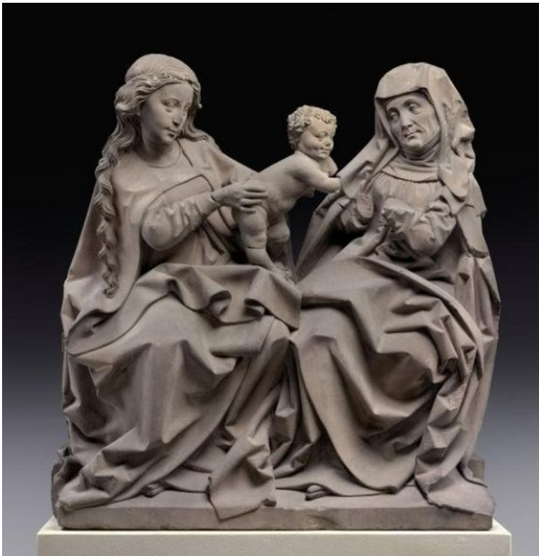
[14] Sv. Anna Samotřetí, Nicolaus Gerhaert z Leydenu – okruh, 1460-1465. Berlí, Dahlem, Staatliche Museen.