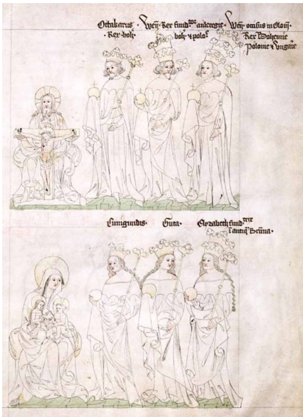
[III. 6.] Zbraslavská kronika z Jihlavy (Chronicon Aulae Regiae), sv. Anna Samotřetí s českými královnami Kunhutou, Gutou a Eliškou Rejčkou (fol. 6v), Čechy, 1393. Jihlava, SOkA Jihlava, Archiv města Jihlava, oddělení Úřední knihy a rukopisy 1359-1850 (1894), inv. č. 692, archivní kulturní památka č. 129