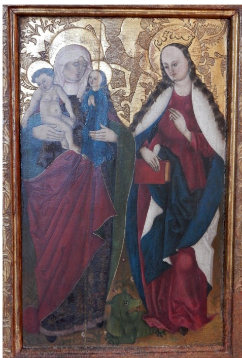
[I. 8. a] Detail: Oltář z Klapého u Libochovic, Mistr Štěpán z Ústí (dříve Mistr oltáře z Klapého), kolem 1493. Litoměřice, Oblastní muzeum v Litoměřicích, zapůjčeno do Severočeské galerie výtvarného umění v Litoměřicích, inv. č.: Dop-13