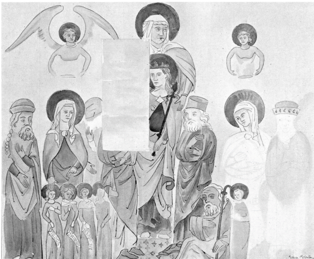
[II. 1.] Příbuzenstvo Kristovo, neznámý mistr, před 1380. Praha (okres Hlavní město Praha), katedrála sv. Víta, Václava a Vojtěcha, kaple sv. Anny