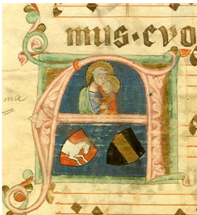
[III. 4.] Antifonář Arnošta z Pardubic, Sv. Anna s Pannou Marií (P VI/2, fol. 455v), Čechy, kolem 1360. Praha, Archiv Pražského hradu, fond Metropolitní kapitula u Sv. Víta, Kapitulní knihovna, P VI/1, 2, 3