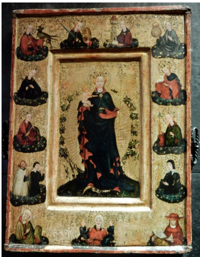
[I. 5.] Assumpta v květnici zv. Assumpta Lannova, český mistr, kolem 1450. Praha, Národní galerie v Praze, inv. č.: O 494