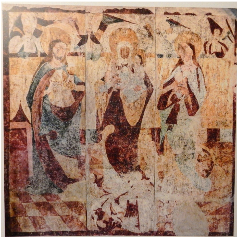
[II. 4.] Votivní scéna se Sv. Annou Samotřetí mezi sv. Kateřinou a sv. Barborou, neznámý mistr, po 1513. Doupov (okres Karlovy Vary), kostel sv. Wolfganga (po zboření transfery uloženy na státním hradě Švihov)