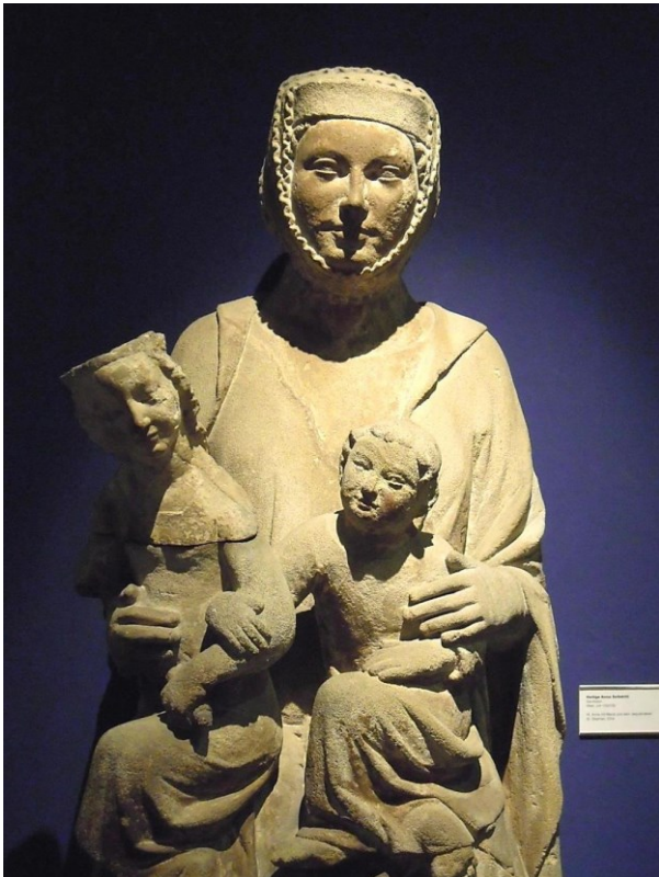
[12] Sv. Anna Samotřetí z kostela v. Štěpána ve Vídni, neznámý mistr, 1320-1330. Vídeň Historisches Museum, inv. č. 593