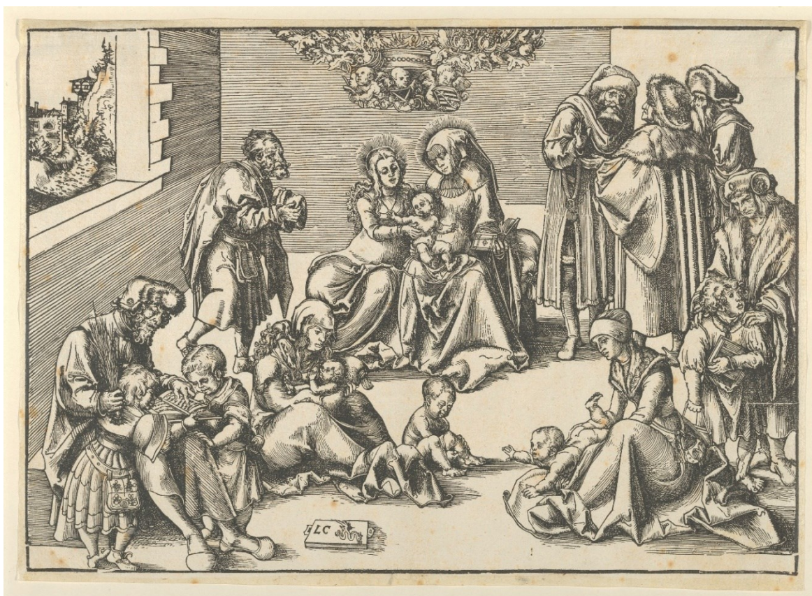
[6] Příbuzenstvo Kristovo, Lucas Cranach st., 1510, dřevorez. Metropolitní muzeum New York, Rogers Fund, inv. č. 21.35.2