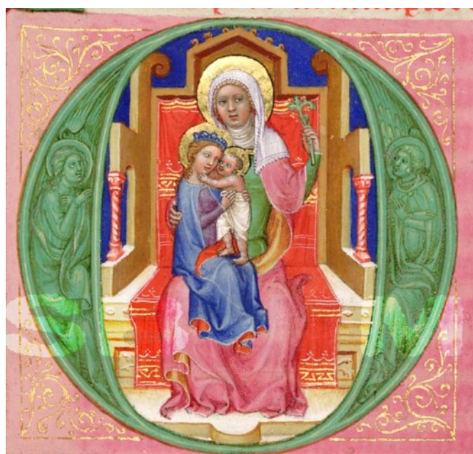
[III. 2.] Liber viaticus Jana ze Středy, setkání sv. Jáchyma a sv. Anny u Zlaté brány (fol. 201r), Sv. Anna Samotřetí (fol 261v), Čechy, kolem 1355. Praha, Národní muzeum v Praze, Knihovna Národního muzea v Praze, XIII A 12