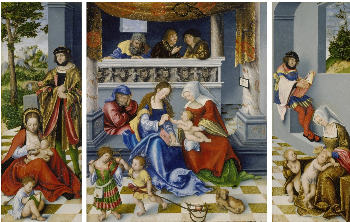
[7] Oltářní archa Příbuzenstva Kristova, Lucas Cranach st., 1509. Städels Museum Frankfurt a. M., inv. č. DE SMF 1398A