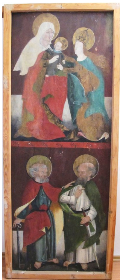
[I. 6.] Oltářní křídla z Plané u Mariánských Lázní, neznámý mistr, kolem 1490. Tachov, Okresní muzeum v Tachově, inv. č.: U 194, U 195