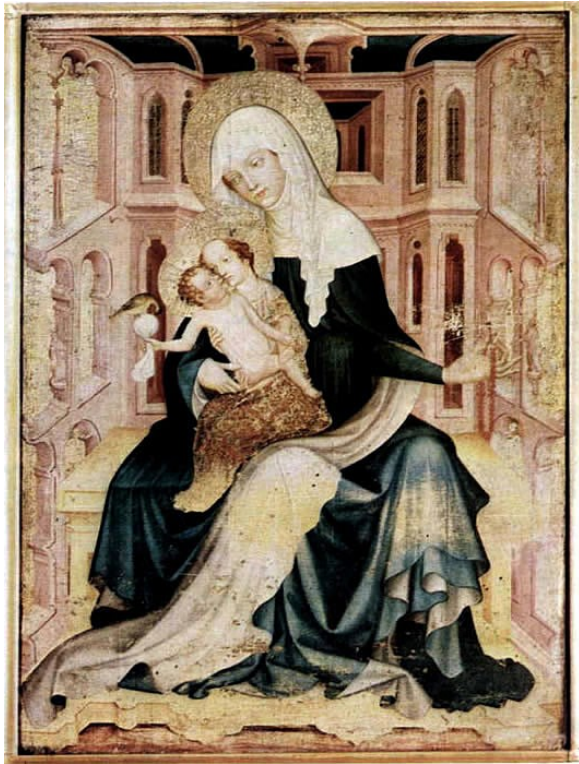
[I. 18.] Sv. Anna Samotřetí ze Střehomi, český mistr, kolem 1420. Vratislav, Muzeum Narodowe we Wrocławiu, inv. č.: XI - 221