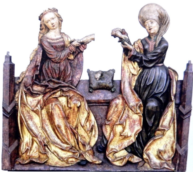
[15] Sv. Anna Samotřetí, neznámý mistr, 1515-1520. Hluboká nad Vltavou, Alšova jihočeská galerie.