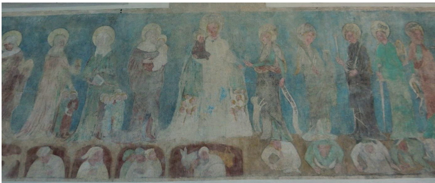
[II. 2.] Příbuzenstvo Kristovo, neznámý mistr, před 1390. Praha (okres Hlavní město Praha), Kostel sv. Apolináře