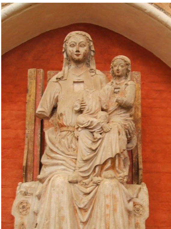
[8] Sv. Anna Samotřetí, neznámý mistr, po 1260. Stralsund, kostel sv. Mikuláše.