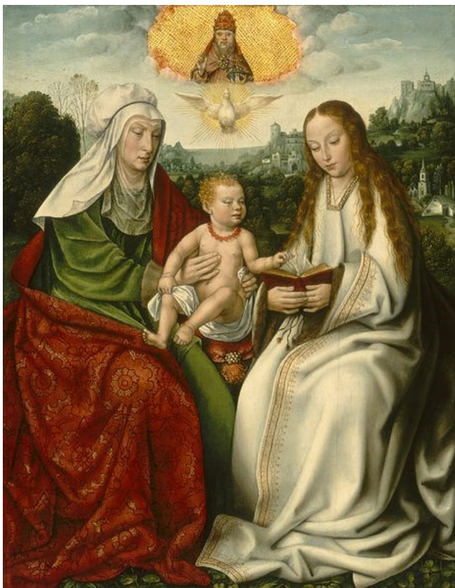
[9] Sv. Anna Samotřetí, Mistr Frankfurtského oltáře, cca 1511-1515. Washington, National Gallery of Art, inv. č.: 1976.67.1