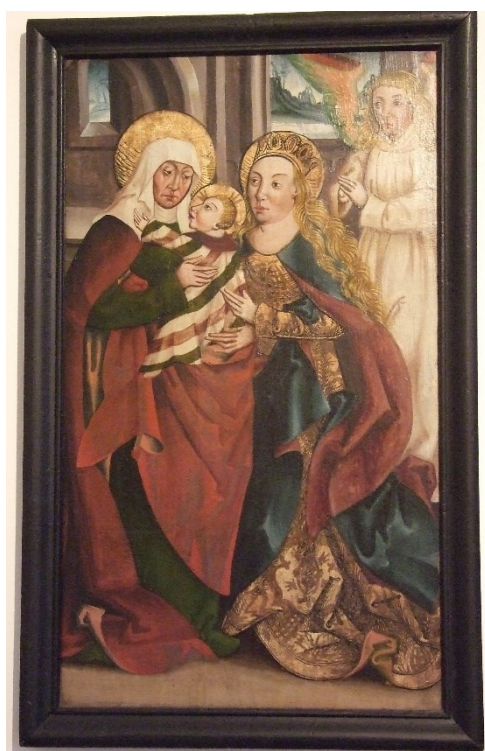
[I. 10.] Oltářní křídlo ze Srbice, neznámý mistr, kolem 1500. Plzeň, Biskupství plzeňské; zapůjčeno do Muzea Chodska v Domažlicích, inv. č.: H 10.647