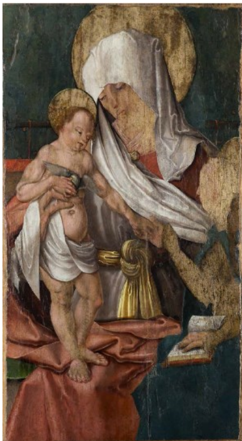
[I. 13.] Svatá Anna Samotřetí, Mistr Litoměřického oltáře, kolem 1510-1515. Praha, Národní galerie v Praze, inv. č.: DP 4102