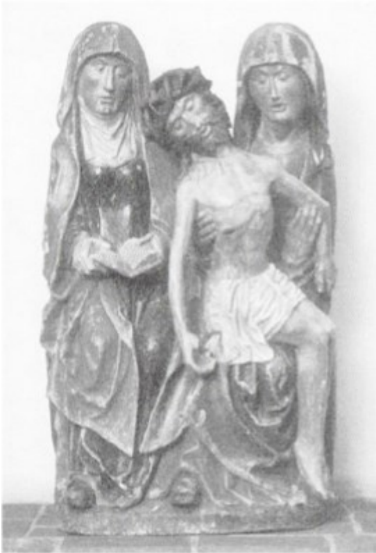
[11] Pieta se sv. Annou Samotřetí, neznámý mistr, kolem 1500 . Waldniel, kostel sv. Michaela