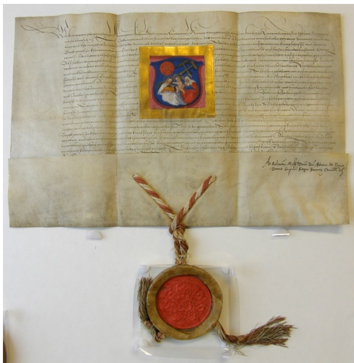
[III. 9.] Horní privilegium Ludvíka Jagellonského ze dne 20. 1. 1526 pro město Český Krumlov, sv. Anna Samotřetí, Čechy, 1526. Český Krumlov, Státní okresní archiv Český Krumlov, K - 1, Listina - horní privilegium Ludvíka Jagellonského pro město Český Krumlov ze dne 20. 1. 1526, vystavena v Budíně, i. č. 109