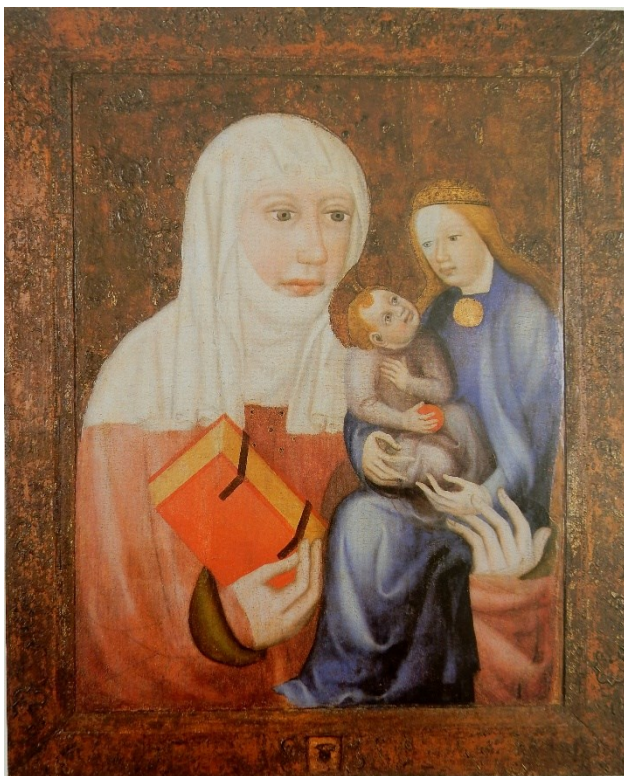
[I. 1.] Sv. Anna Samotřetí z kaple sv. Kříže na Karlštejně, Mistr Theodorik, před 1365. Karlštejn, kaple sv. Kříže, inv.č. KA 3687