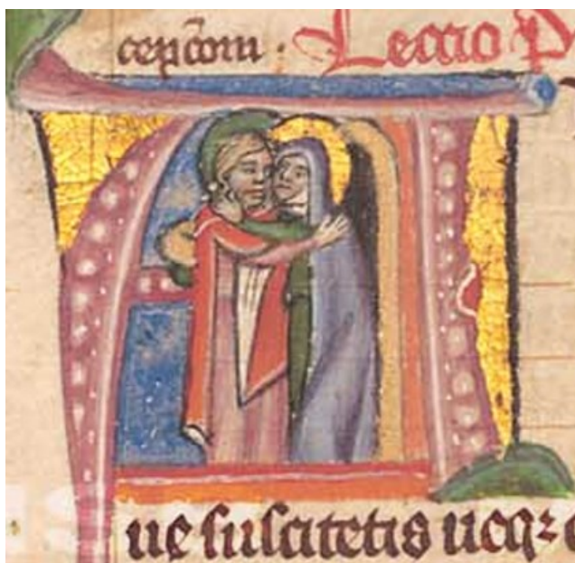
[III. 1.] Breviář probošta Vítka, setkání sv. Jáchyma a sv. Anny u Zlaté Brány (fol. 397r), Čechy, 1342. Rajhrad, Benediktinské opatství Rajhrad, Knihovna benediktinů v Rajhradě, Sběrka rukopisů knihovny benediktinů v Rajhradě, R 394