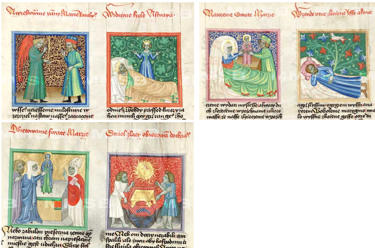
[III. 7.] Sborník krumlovský, Příběh sv. Jáchyma a sv. Anny: Zvěstování Jáchymovi (fol. 4r), Narození Panny Marie (fol. 5r), Uvedení Panny Marie do chrámu (fol. 6r), Čechy, kolem 1420. Praha, Národní muzeum v Praze, Knihovna Národního muzea v Praze, III B 10