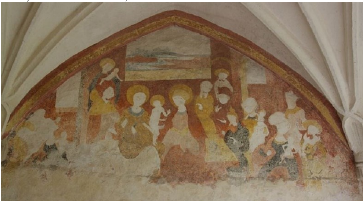
[II. 5.] Příbuzenstvo Kristovo, neznámý mistr, kolem 1520. Horní Stropnice (okres České Budějovice), kostel sv. Mikuláše