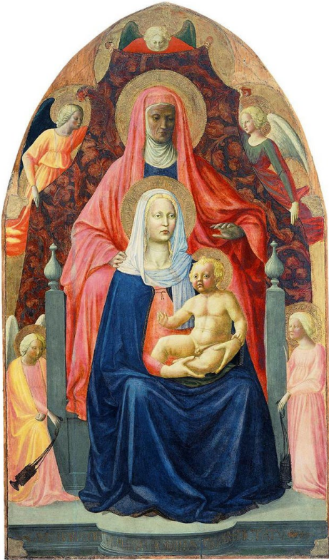
[13] Sv. Anna Samotřetí, Massaccio (Masolino da Panicale), dok 1423. Florencie, Galleria degli Uffizi, inv. č. 8386