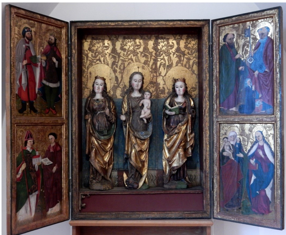
[I. 8.] Oltář z Klapého u Libochovic, Mistr Štěpán z Ústí (dříve Mistr oltáře z Klapého), kolem 1493. Litoměřice, Oblastní muzeum v Litoměřicích, zapůjčeno do Severočeské galerie výtvarného umění v Litoměřicích, inv. č.: Dop-13