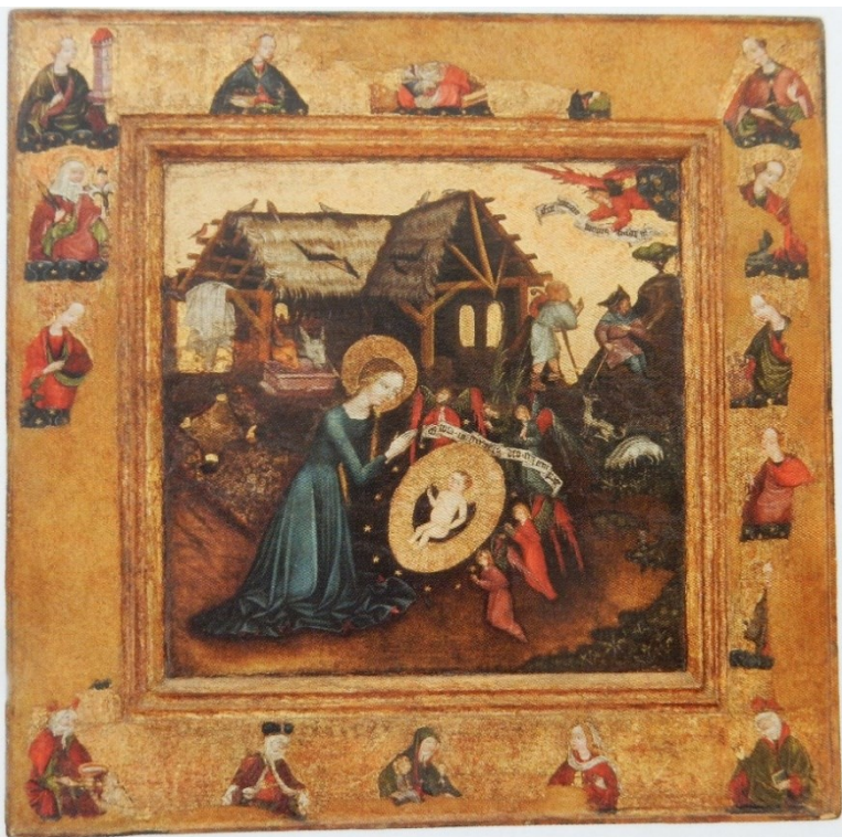
[I. 4.] Adorace Páně / Kristus na hoře Olivetské z Českých Budějovic, český mistr, kolem 1440. Hluboká nad Vltavou, Alšova jihočeská galerie, inv. č.: O – 4