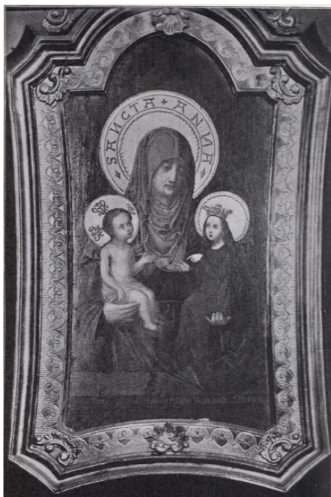
[I. 12.] Sv. Anna Samotřetí z Mýta u Rokycan. Mýto u Rokycan, neznámý mistr, počátek 16. stol. Plzeň, depozitář Biskupství plzeňského