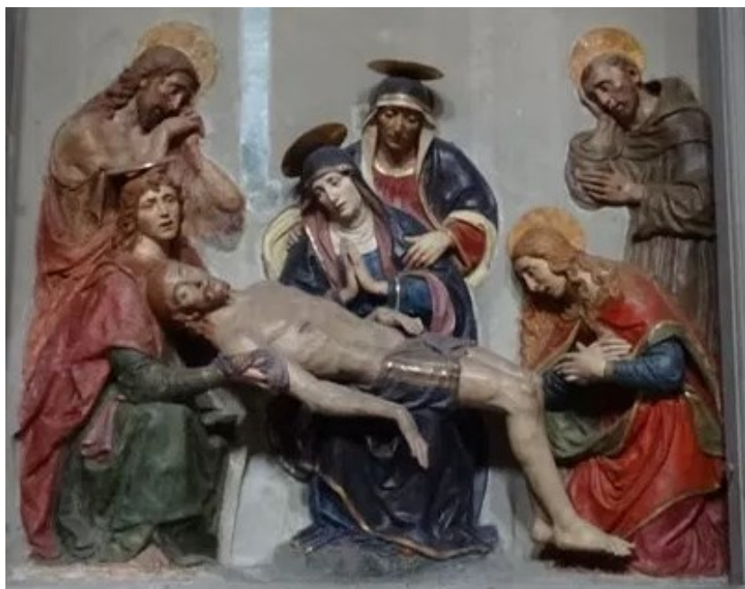
[10] Oplakávání se sv. Annou Samotřetí, Giovanni della Robbia, kolem 1528. Siena, observantského klášter San Salvatore al Monte