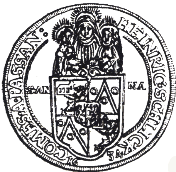
[19] Mince ražená v plánské mincovně v roce 1634