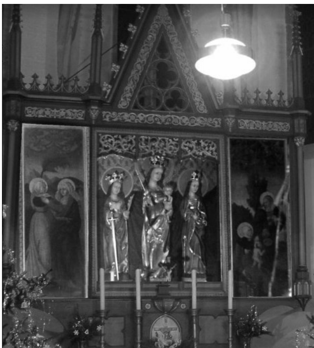
[I. 15.] Oltářní křídlo ze Živanic, neznámý mistr, kolem 1520. Hradec Králové, Biskupství královéhradecké, depozitář