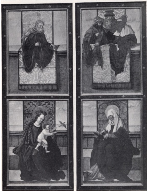
[I. 17. a] Chrudimský oltář, neznámý mistr, 1527. Chrudim, arciděkanský kostel Nanebevzetí Panny Marie