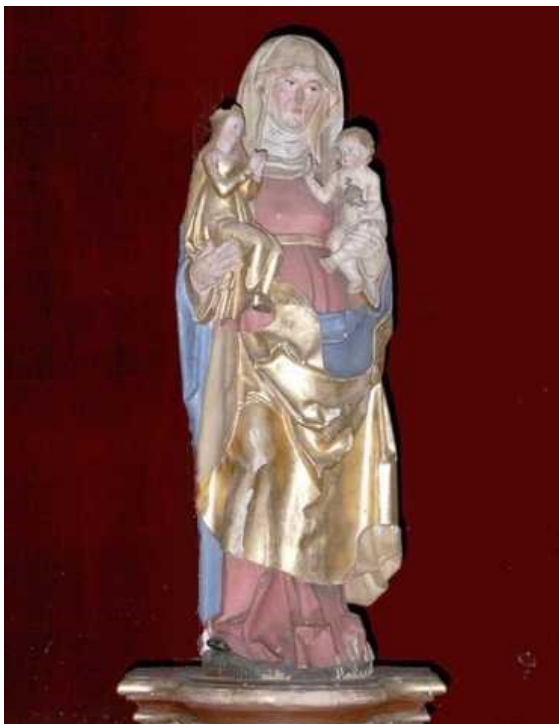
[17] Sv. Anna Samotřetí ze Sedlce u Karlových Varů, neznámý mistr, kolem 1520-1530. Sedlec, kostel sv. Anny