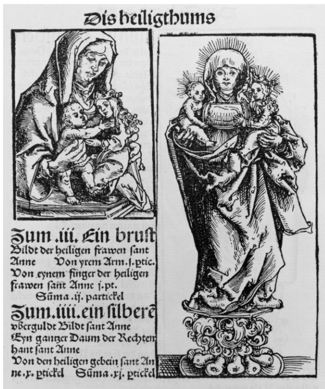
[3] Sv. Anna Samotřetí, Lucas Cranach st. – relikviář, Katalog wittenberských relikvií (Wittenberger Heiligthumsbuch), 1509/1510. Herzog August Bibliothek, inv. č. 154.2 Theol. 1