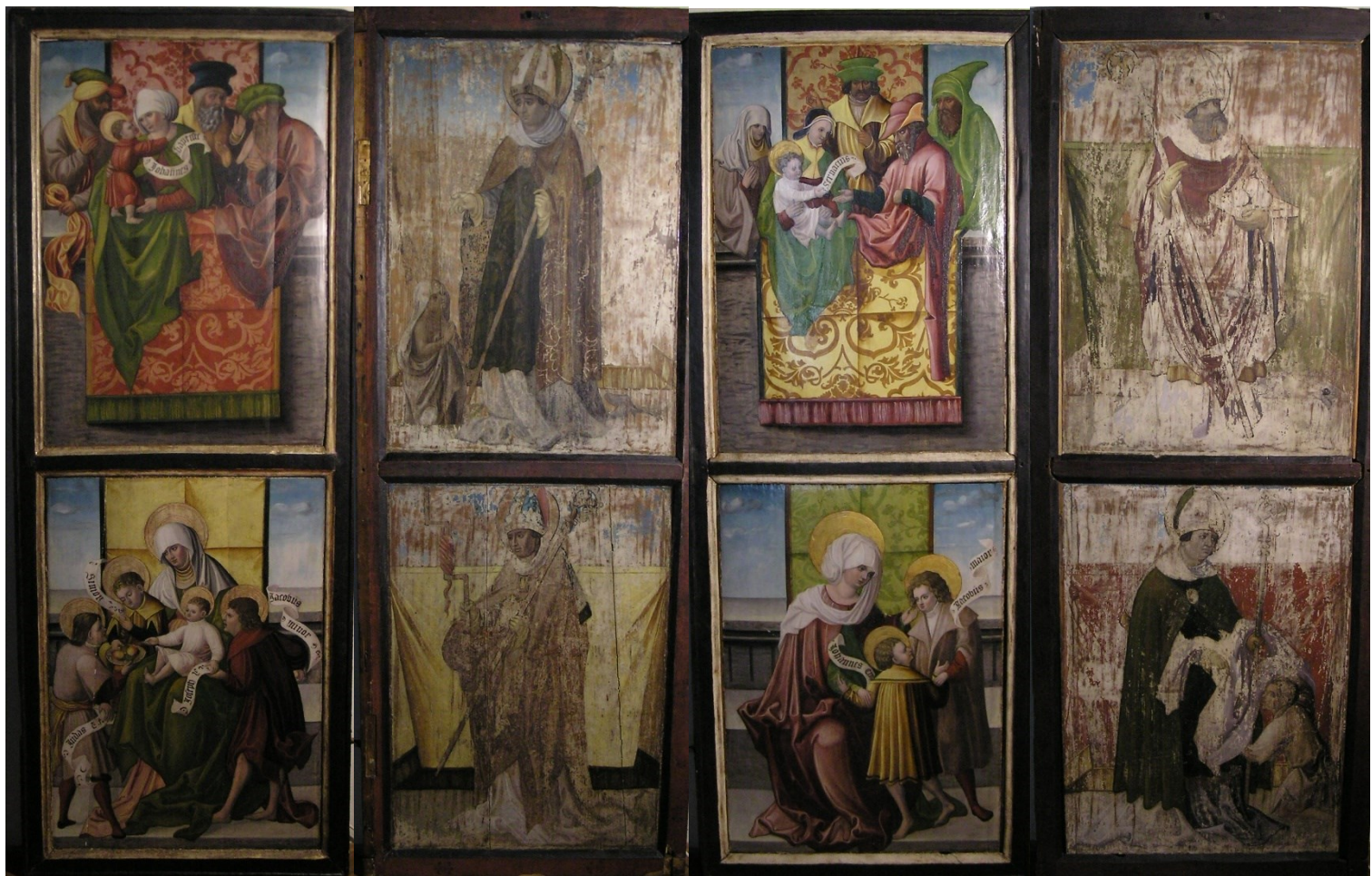
[I. 17. b] Chrudimský oltář, neznámý mistr, 1527. Chrudim, Regionální muzeum v Chrudimi, inv. č.: U 4037_1, U 4037_2