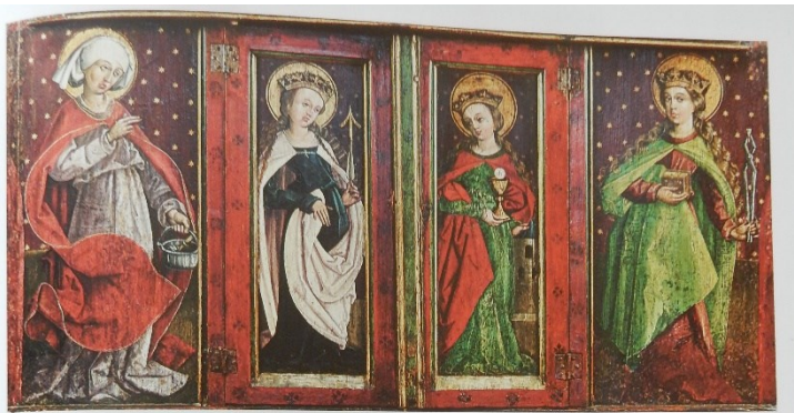
Oltář z Blanska (zavřená archa), 1500–1510, Alšova jihočeská galerie, Hluboká nad Vltavou