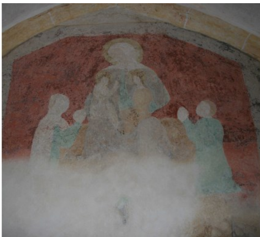
[II. 3.] Sv. Anna Samotřetí, neznámý mistr, kolem 1380. České Budějovice (okres České Budějovice), bývalý dominikánský klášter