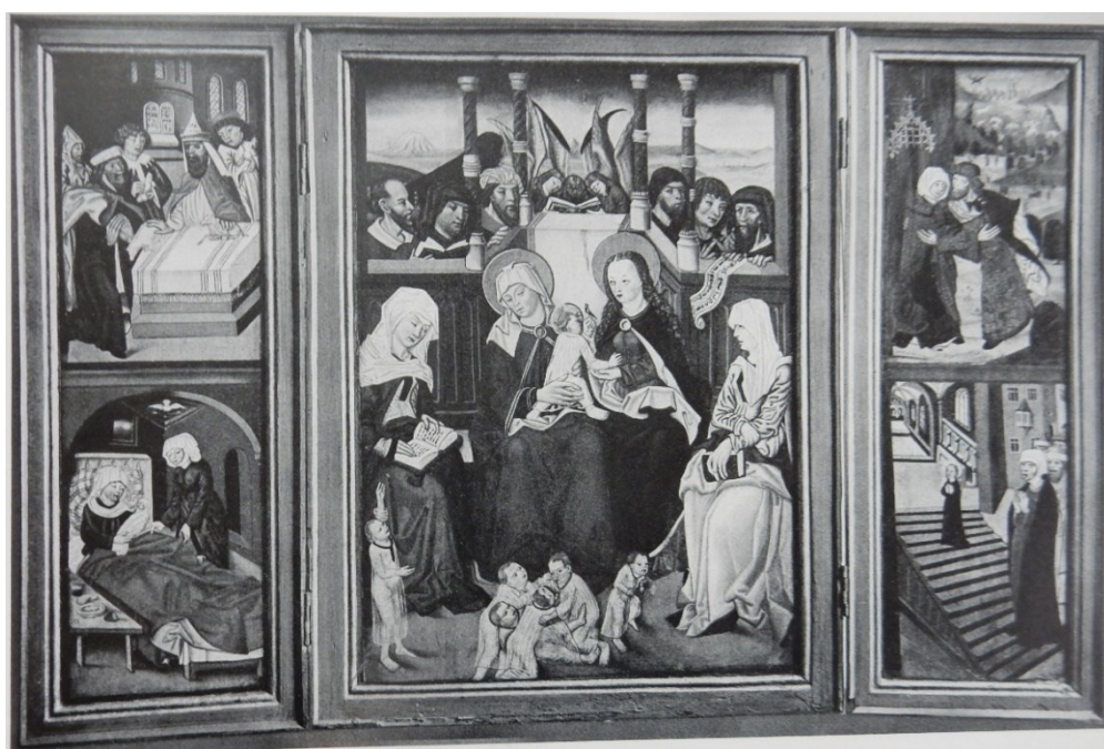
[I. 7.] Oltář křižovnického kláštera, Mistr Budňaského oltáře, po 1490. Praha, Rytířský řád Křižovníků s červenou hvězdou, inv. č. DO O 6781