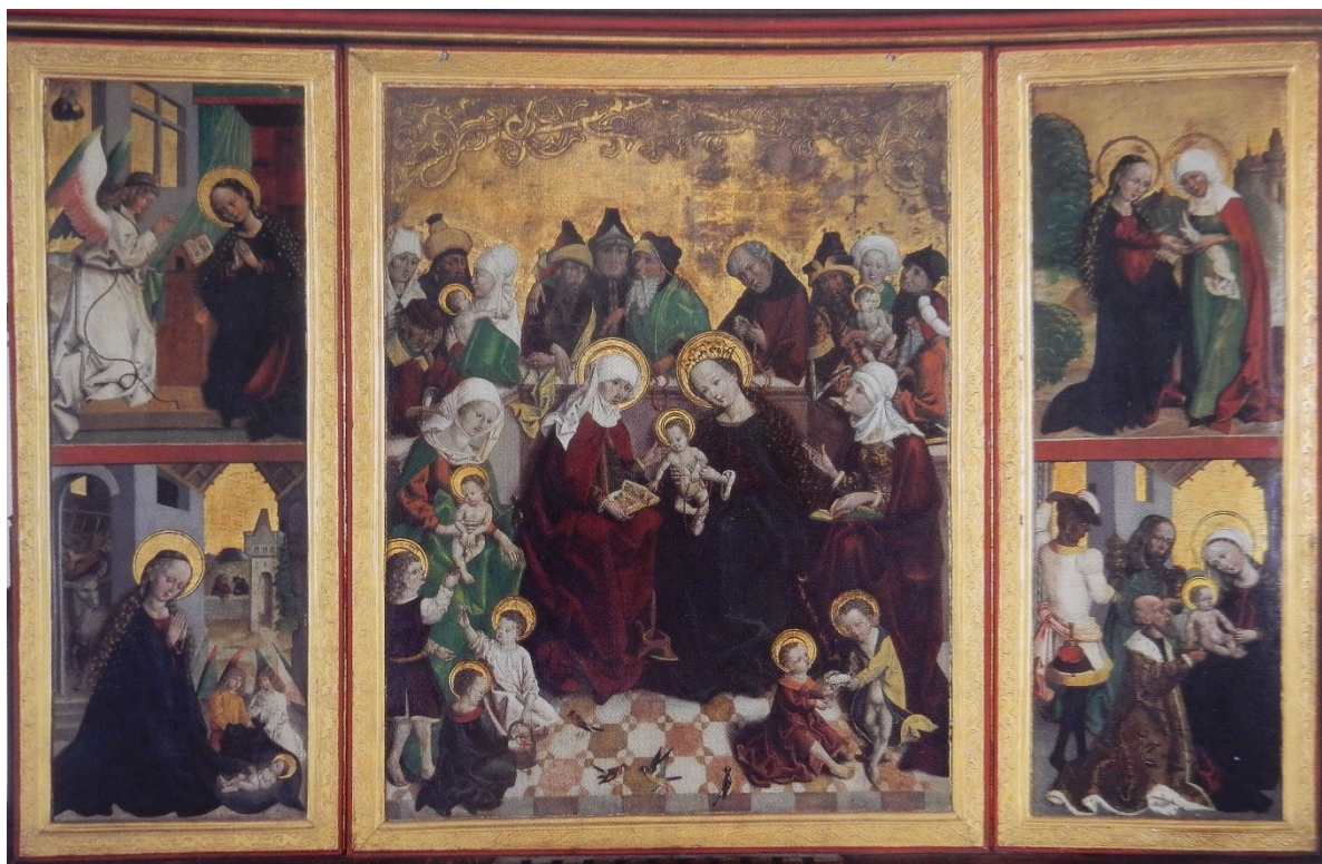
[I. 9.] Královéhradecký oltář, Mistr Královéhradeckého oltáře, 1494. Hradec Králové, biskupství královéhradecké, katedrální kostel sv. Ducha