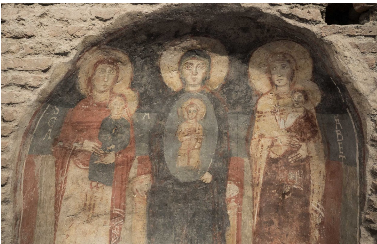
[2] Sv. Anna s Pannou Marií a sv. Alžbětou, Sv. Anna s Pannou Marií, Řím, Santa Maria Antiqua, kolem 760.