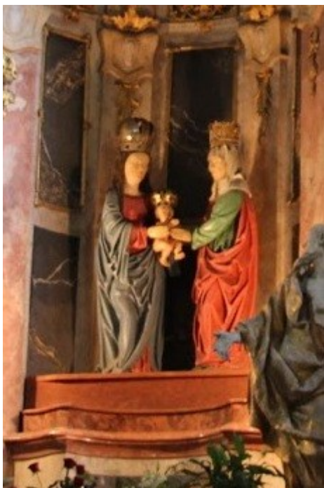
[20] Sv. Anna Samotřetí, neznámý mistr, kolem 1515. Planá u Mariánských Lázní, poutní kostel sv. Anny