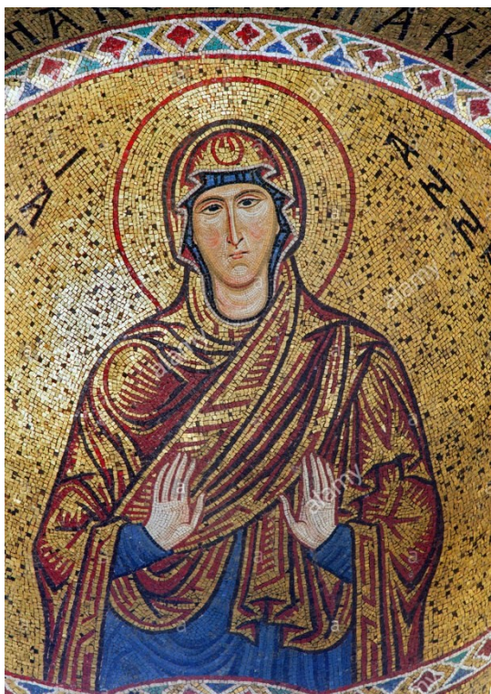
[5] Sv. Anna, Palermo, Church of Santa Maria dell' Ammiraglio, 1113-1143.