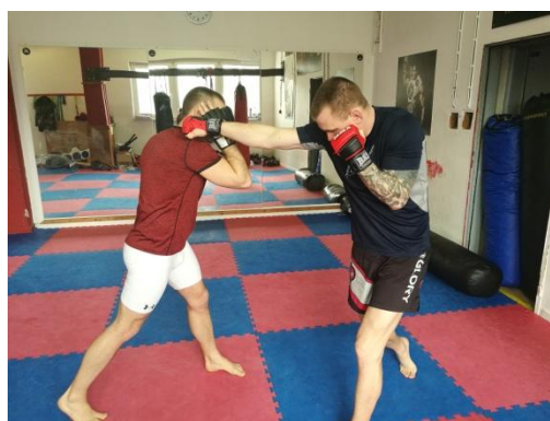
Obrázek 3 - Direkt z pravé ruky