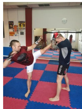
Obrázek 11 - High kick

High kick - kop na hlavu - je technikou na dlouhou vzdálenost, kdy se vytáčíme na stojné noze a soupeře trefujeme nártem nebo holenní kostí do oblasti hlavy. Technika je opět započítána pouze vy chvíli kdy projde přímo na hlavu, pokud jde kop přes ruce a tedy kryt není bodována.