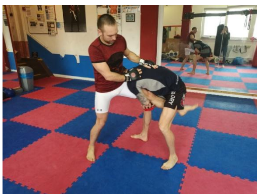
Obrázek 15 - Single leg

b) takedowny - porazy - jsou techniky, které slouží k přesunutí boje z postoje (striking) na podlahu (grappling). Rozeznáváme dva základní takedowny, tedy techniky k přenesení boje na zem. Single leg (obr.15) a double leg (obr.16). Jak již název napovídá, jedná se o techniky kdy při prvním z nich chytáme pouze jednu nohu soupeře, zpravidla to bývá noha přední, zatímco u double leg chytáme nohy obě. Obě techniky se dají použít jak při útoku, kdy soupeře zaměstnáme údery a poté následuje poraz. Zaměstnání soupeře je důležité, protože při snížení těžiště a zkrácení vzdálenosti hrozí nebezpečí kopu kolenem. Dají se ale využít i při útoku soupeře, kdy jde soupeř příliš rychle kupředu, snížíme těžiště pod jeho ruce a následuje poraz, při kterém dle situace volíme chycení jedné nebo obou nohou.