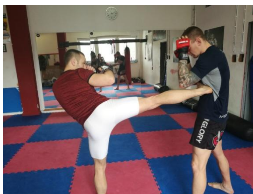
Obrázek 13 - Side kick

Side kick - boční kop - je technikou, kterou rychlí zápasníci využívají pro zastavení soupeře hlavně z přední nohy, kdy se vytočíme na stojné noze a chodidlo je vodorovně s podlahou. Jedná se zejména o rychlý a reflexivní kop, který je technicky velmi obtížný.