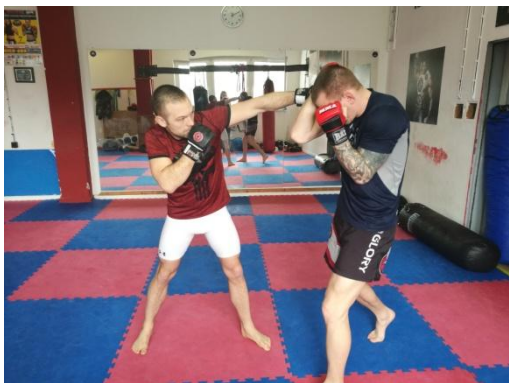
Obrázek 4 - Hák z levé ruky

Hák - boční úder - je technikou na střední nebo i krátkou vzdálenost. Přichází z boku z přední nebo zadní ruky zpravidla na hlavu. Úder začíná u hlavy a rotací boků a úhlu 90° v loktu udeřující ruky se snažíme trefit hlavu soupeře do odkrytého místa. Údery do krytu se nezapočítávají do bodování.