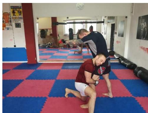
Obrázek 16 - Double leg