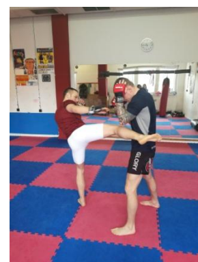
Obrázek 10 - Round kick

Roundhouse kick - kop na žebra - je technikou na střední vzdálenost, opět se při kopu vytáčíme na stojné noze, a snažíme se soupeře trefovat do oblasti břicha. Pokud je soupeř v dobrém postavení, měl by kop mířit přesně mezi lokty a pánevní kost, do měkké části pod žebry. Technika je bodována pouze pokud nejde do krytu.