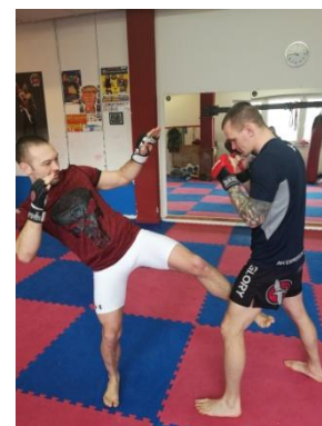
Obrázek 9 - Low kick

jako u úderů je kop bodován pouze tehdy, pokud jde na nekrytou část těla, u kopů to znamená, že nesmí technika přijít do krytu.