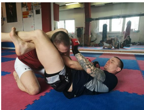
Obrázek 18 - Triangl choke

Triangle choke - trojúhelníkové škrcení - technika, která se nejčastěji nasazuje z boje na zádech. Je technicky těžkou technikou, kdy jednu nohu přehodíme soupeři přes krk a za jeho hlavou si nohy spojíme tak, aby náš nárt byl pod naším kolenem, poté nohy co nejvíce sevřeme, propneme pánev a tlačíme hlavu soupeře směrem dolů. Je mnoho detailů, které mohou hrát při nasazení triangu roli, proto je popis jen velmi základní a stejně jako u všech technik a motorického učení, je důležité techniky vždy správně ukázat, rozfázovat a opakovat.