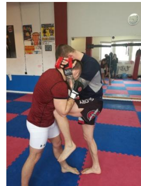
Obrázek 14 - Klinč s kolenem

a) klinč - je boj ve kterém na velmi krátkou vzdálenost, využívají se v něm techniky tzv. "špinavého boxu", loktů a kolen. Klinč se v MMA využívá hlavně v boji u pletiva. Vysvětlíme si pouze základní provedení. Obvykle po útočné kombinaci úderů, chytáme soupeře za temeno hlavy v co nejvyšším bodě, lokty opíráme o jeho tělo a snažíme se je držet co nejbliže u sebe. Následuje páka, kdy se snažíme soupeři hlavu tlačit směrem k zemi a navazujeme dalšími technikami (kopy kolenem, údery lokty).