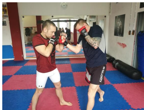
Obrázek 7 - Zvedák z pravé ruky