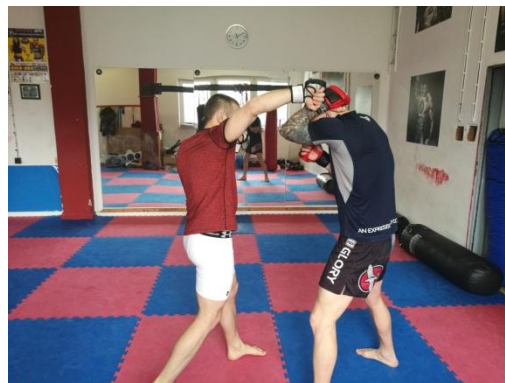
Obrázek 5 - Hák z pravé ruky

Zvedák - spodní úder - je technikou především na krátkou vzdálenost, která se často využívá v klinčích. Je technicky důležité ruku, kterou chceme udeřit před úderem nespouštět dolů a snížit mírně celé těžiště.