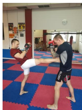
Obrázek 12 - Front kick

Front kick - kop na břicho soupeře - je technikou na střední a dlouhou vzdálenost, z přední nohy slouží zejména k zastavení soupeře při jeho pohybu vpřed (stop kick), ze zadní nohy případně k účinnému kopu do oblasti břicha.