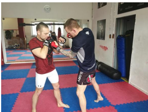
Obrázek 6 - Zvedák z levé ruky

Zvedák - spodní úder - je technikou především na krátkou vzdálenost, která se často využívá v klinčích. Je technicky důležité ruku, kterou chceme udeřit před úderem nespouštět dolů a snížit mírně celé těžiště.