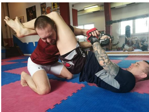
Obrázek 17 - Arm Bar

Arm Bar - tlak na ruku - jedná se o jednu ze základních technik boje na zemi, která se dá využít z mnoha pozic. Nejčastěji se využívá při boji na zádech, v tak zvaném fullguardu , kdy soupeře svíráme oběma nohama a máme je na jeho zádech spojené. Ve chvíli, kdy soupeř udělá chybu nebo techniku nasadíme, přehodí se jedna noha přes jeho hlavu a svíráme jeho ruku mezi kolena, které tlačíme k sobě a zároveň zvedáme pánev směrem ke stropu, tím vzniká tlak na loket. Je důležité mít soupeřovo ruku tak, aby palec jeho ruky směřoval vzhůru.