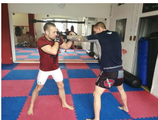
Obrázek 2 - Direkt z levé ruky

Direkt - přímý úder - je technikou na dlouhou vzdálenost, nejčastěji používaný z přední ruky, kterou si zápasníci naměřují vzdálenost. Ze zadní obvykle přichází ve chvíli, kdy máme jistotu, že soupeře zasáhneme. Úder vychází nejčastěji od hlavy, ale někteří zápasníci s dobrým pohybem jej praktikují i ze svěšených rukou. Trajektorií je vždy přímka a to jak dopředu, tak i zpět do původní polohy. Stejně jako u všech technik je bodován ve chvíli, kdy projde čistě buď na hlavu nebo tělo soupeře. Údery do krytu se nepočítají.