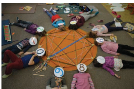
Zákonitosti násobkových mandal

Volná práce na fotografiích ze školního webu [online 32]