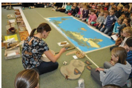
Velký příběh o vzniku písma