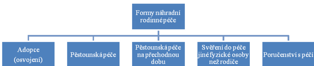
Obrázek 2: formy náhradní rodinné péče.