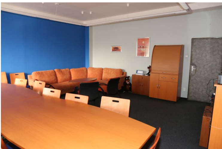
obr č. 3