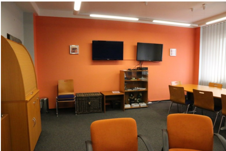
obr. č. 2