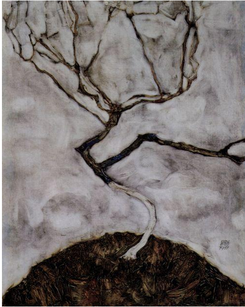
115 Bild 5: Egon Schiele: Kleiner Baum im Spätherbst, 1911