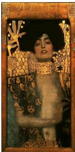
80 Bild 1: Gustav Klimt: Judith mit dem Kopf des Holofernes (1901)

Und Klimt wurde tatsächlich „zum psychologischen Maler der Frau“ 78 . Der Gegenstand seiner frühen Gemälde war vor allem die femme fatale . Klimt versuchte die Verführungskraft und Sinnlichkeit der Frau einzufangen, wovon auch zahlreiche seiner Zeichnungen zeugen. Im Fischblut (1898) geben sich die Frauen dem wässrigen Strom der Wollust hin, in dem sie dank ihrer Haare schwimmen können. Das Haar, ein bedeutendes Ornament der Secession, wird zugleich zu einem der Zeichen der weiblichen Sinnlichkeit. Die Frauen in den Wasserschlangen II (1904-7), gierig nach dem Vergnügen, lösen im Mann das Gefühl aus, dass er ihre Lust nur unzureichend befriedigen kann. Beim Untersuchen des sexuellen Lebens spielte bei Klimt die Moral keine Rolle, dagegen stieß er aber auf die Angst vor Sex, die einige seiner Bilder widerspiegeln. Dieses Gefühl setzte er ins „Thema der Kastration“ um. Außer der Jurisprudenz , eines der Fakultätsbilder, kommt dieses Thema im Bild von Judith mit dem Kopf des Holofernes (1901) vor. Hier verwendet Klimt für ihre femme fatale eine biblische Allegorie, jedoch ohne ihre biblische Bedeutung Judiths als Retterin ihres Volkes. Im Bild wird sie zur reinen Verführerin, ihr Gesichtsausdruck strahlt Befriedigung aus. Auf den Betrachter blickt sie von oben, der Kopf Holofernes' ist nur zur Hälfte am rechten Rand unten abgebildet. Das Bild drückt Judiths Dominanz aus. 79