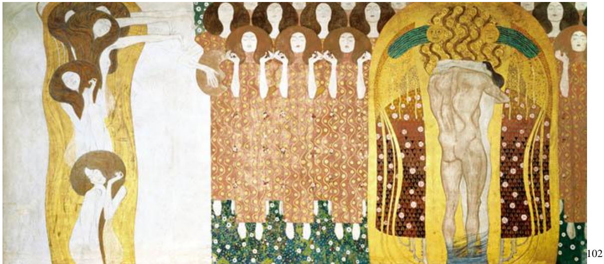
Bild 4: Gustav Klimt: Beethovenfries III - Die Sehnsucht nach Glück findet Stillung in der Poesie (1902)

Der dritte Teil des Frieses wurde selbstständig an der Nebenwand ausgestellt. Er stellt den Höhepunkt des Frieses dar. Klimt kommentierte ihn im Ausstellungskatalog folgend: