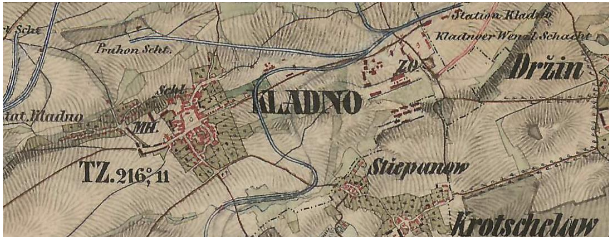
Mapa 1 1

Hned na začátek by bylo dobré si představit, jak Kladno v 19. století vypadalo. Proto jsou zde přiloženy mapy zobrazující Kladno v daném období. Mapa 1 zobrazuje Kladno během 2. vojenského mapování (1806 – 1869). Mapa 2 dokumentuje město během 3. vojenského mapování (1869 – 1887). Po porovnání těchto dvou map je zcela evidentní, jak se město i okolní obce rozrostly. Podrobněji bude zvětšení města popsáno dále.