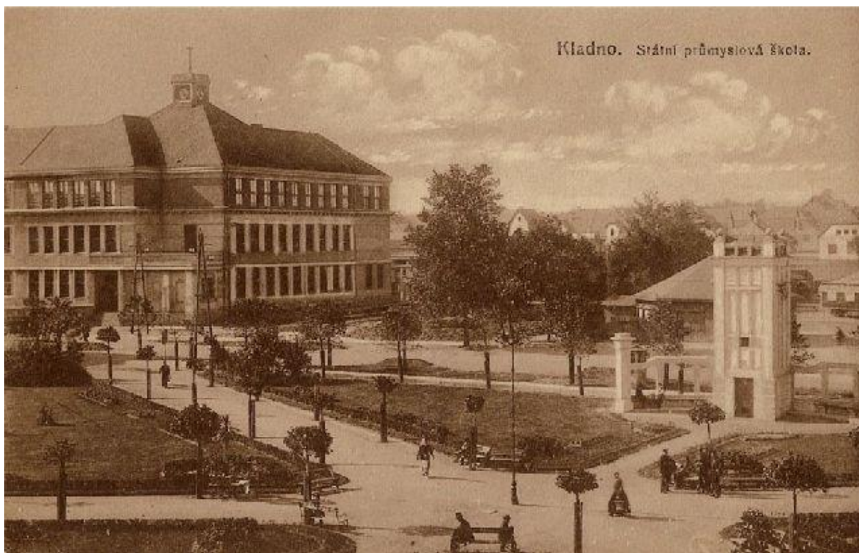
Obrázek č. 1 195

Rozpočet na stavbu hlavní budovy c. k. státní průmyslové školy na Kladně byl spočítán na 210 403 korun. Největší podíl na ceně měla práce nádenická a zednická, která stála necelých 70 000 korun, poté práce truhlářská, zámečnická a kovářská a dále tesařská, které všechny přesahovaly 10 000 korun. Domek pro ředitele vyšel na 22 024 korun a výstavba dílen stála 67 810 korun. 196