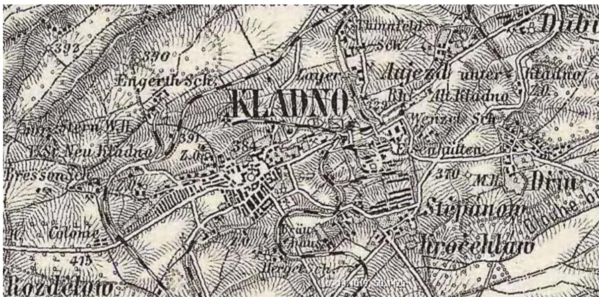
Mapa 2 2